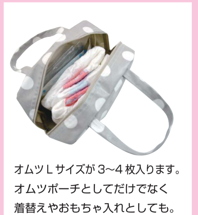
オムツサイズが3~4枚入ります。オムツポーチとしてだけでなく着替えやおもちゃ入れとしても。