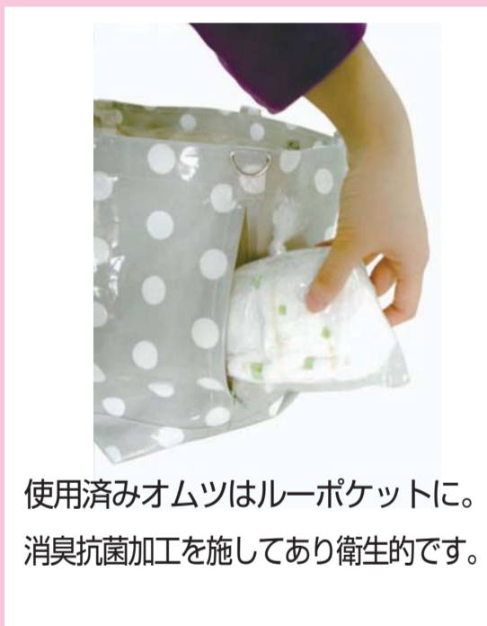
使用済みオムツはルーポケットに。消臭抗菌加工を施してあり衛生的です。