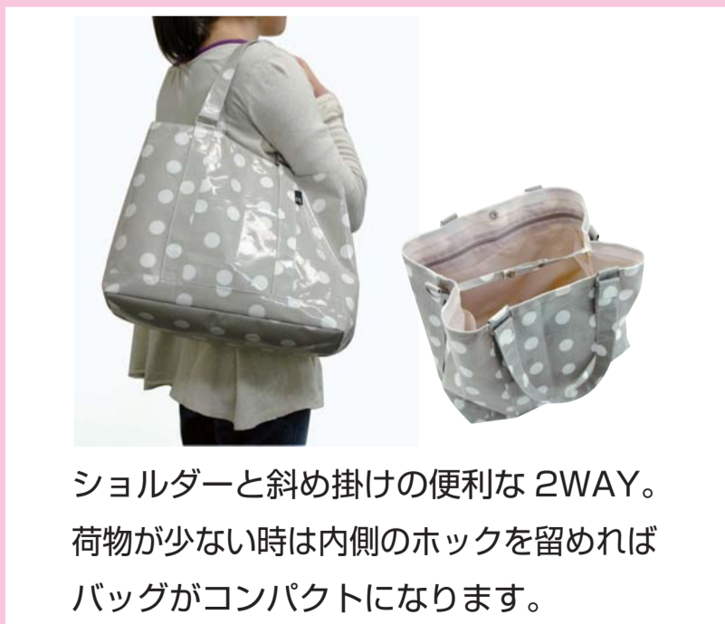
ショルダーと斜め掛けの便利な2WAY。荷物が少ない時は内側のホックを留めればバッグがコンパクトになります。