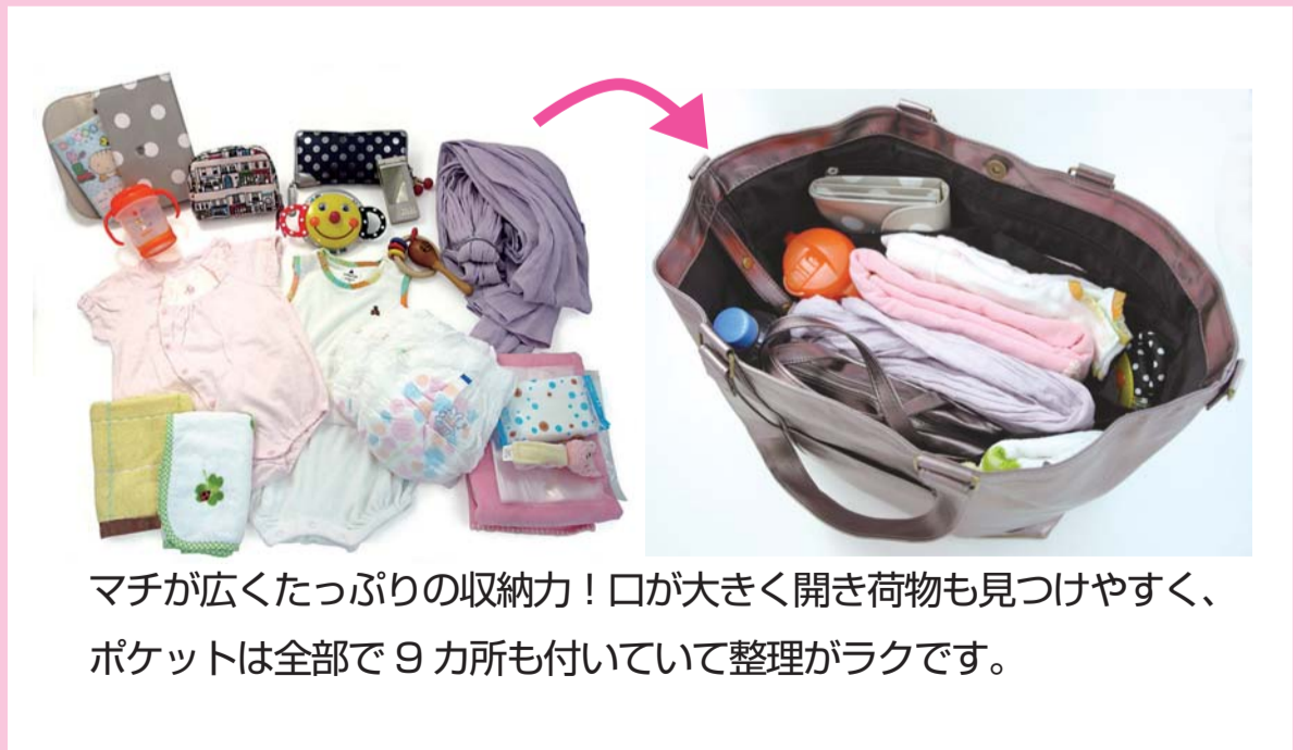
マチが広くたっぷりの収納力！口が大きく開き荷物も見つけやすく、ポケットは全部で9カ所も付いていて整理がラクです。