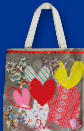
山田 優 (女優・モデル)