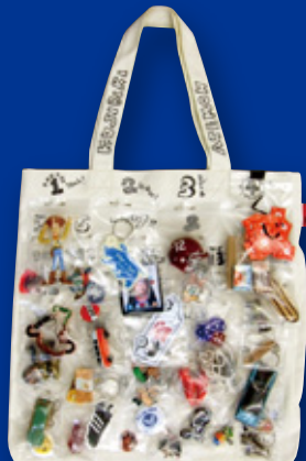
清水 圭 (タレント)