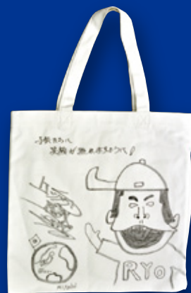
ケツメイシ / RYO (ミュージシャン / ケツメイシ MC)