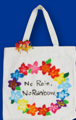
安田 美沙子 (タレント)