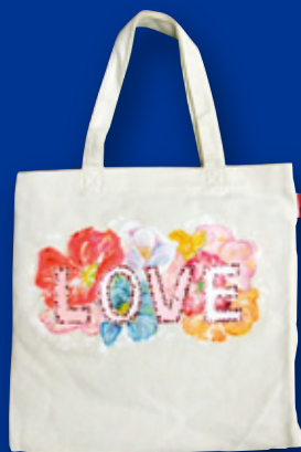
押切 もえ (モデル)

落札金のすべては、東北地方太平洋沖地震で被災された子どもたちへの物資提供や心のケアに活用させていただきます。