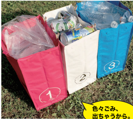
色々ごみ、出ちゃうから。

市販のゴミ袋を内側にセットできるのがルーガービッジ。見た目もすっきり、ゴミ捨て時もラクラクなトート。