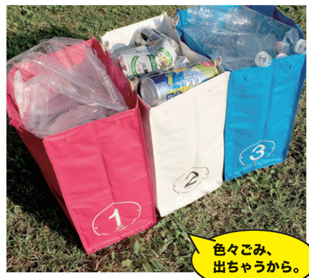
色々ごみ、出ちゃうから。

市販のゴミ袋を内側にセットできるのがルーガービッジ。見た目もすっきり、ゴミ捨て時もラクラクなトート。