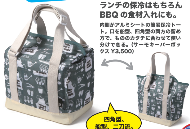
四角型、船型、二刀流。

ランチの保冷はもちろん BBQ の食材入れにも。 内側がアルミシートの簡易保冷トート。口を船型、四角型の両方の留め方で、もののかたちに合わせて使い分けできる。(サーモキーパーボックス ¥3,500)