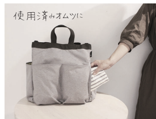
使用済みオムツに