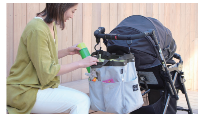
ベビーカーにかけても使いやすい