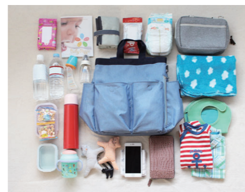
ママの荷物をたっぷり収納