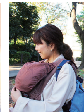
抱っこ紐と一緒に