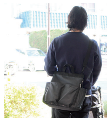
パパにもイメ合デザイン