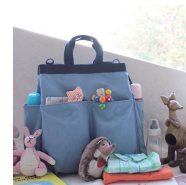
簡単アクセスな外ポケット