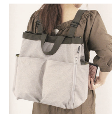
貴重品用ポケット