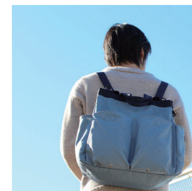
リュックにもなる 3WAY