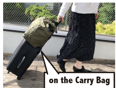
on the Carry Bag