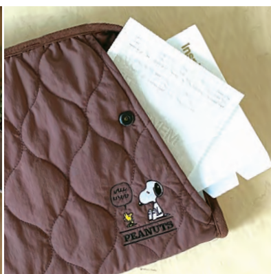
外側にはA4サイズも収納できるルーポケット。