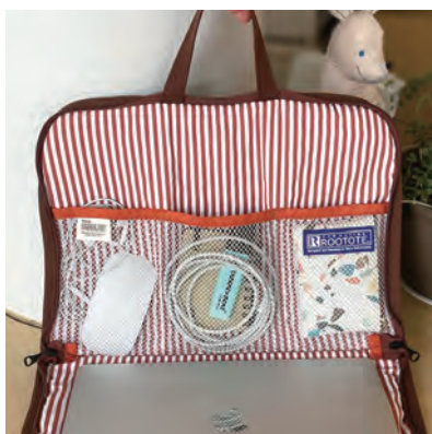
内側には3つに区切られたメッシュポケット付き。

本体はコの字型についたファスナーで、縦横どちらからも中身を出し入れできる仕様。13インチのノート型PC対応。