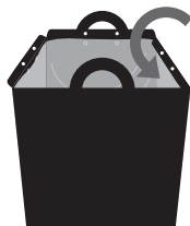
内側のドットボタンで ゴミ袋の4辺を固定