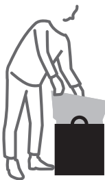
ルー・ガービッジの中に ゴミ袋をセット