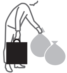
ゴミ出しもスマートに 行えます