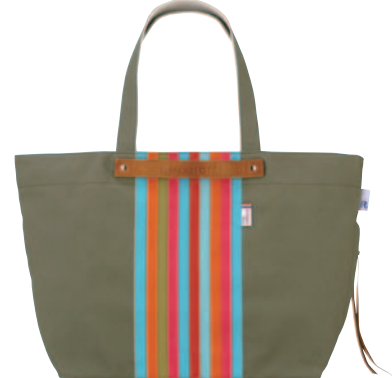
611503 GUETHARY JAN : 4980862611537