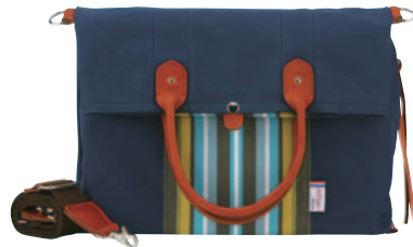
611402 TILH JAN : 4980862611421