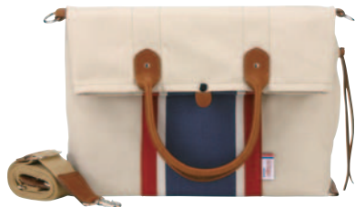
611401 PARIS JAN : 4980862611414