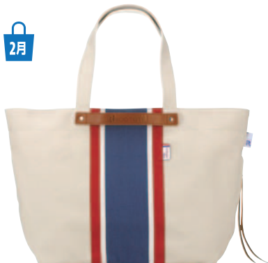
611501 PARIS JAN : 4980862611513