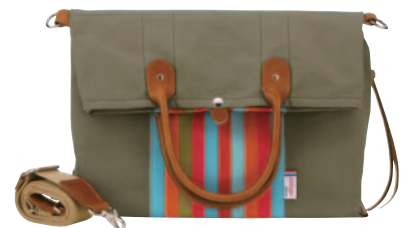
611403 GUETHARY JAN : 4980862611438