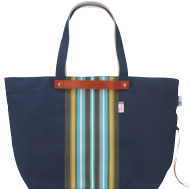
611502 TILH JAN : 4980862611520