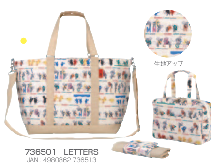
736501 LETTERS JAN: 4980862 736513

▼ 7365 MR LEO Lionni-B ¥6,500 (税込 ¥6,825)