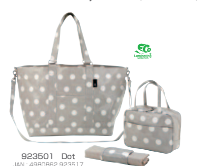
923501 Dot JAN: 4980862 923517

▼ 9235 RT Mammy ROO-A ¥5,600 (税込 ¥5,880)