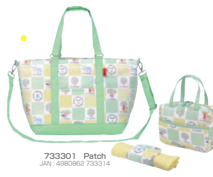
733301 Patch JAN: 4980862 733314

▼ 7333 MR. MOTTAINAI-C ¥5,600 (税込 ¥5,880)