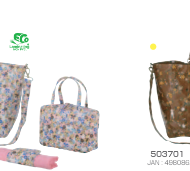
503701 Forest JAN: 4980862 503719

【オムツ替えシート】 サイズ: W45×H68cm 素材: シート部分/ポリエステル