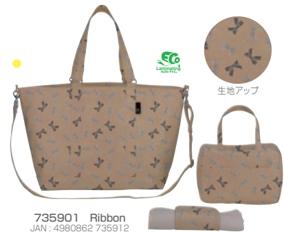
735901 Ribbon JAN: 4980862 735912

【ポーチ】 サイズ: W21×H15×D8cm 持ち手: 長さ30cm 素材: 表地/綿EVAラミネート加工 裏地/ポリエステル ポケット: 外側1箇所、内側1箇所