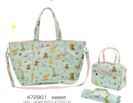
472901 sweet JAN: 4980862 472916

▼ 4729 MR. Suzy's Zoo-A ¥6,500 (税込 ¥6,825)