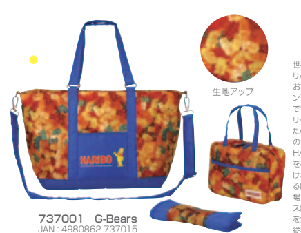
737001 G-Bears JAN: 4980862 737015