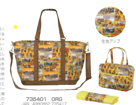
735401 ORG JAN: 4980862 735417

▼ 7354 MR RODY Kids-A ¥6,500 (税込 ¥6,825)