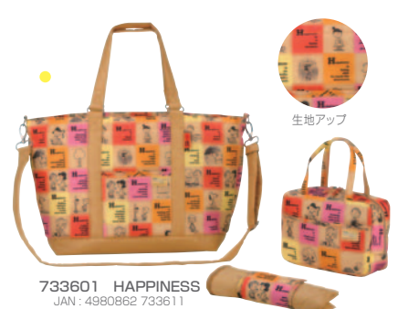
733601 HAPPINESS JAN: 4980862 733611