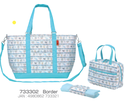
733302 Border JAN: 4980862 733321

【オムツ替えシート】 サイズ: W45×H68cm 素材: シート部分/ポリエステル