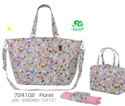
724102 Floret JAN: 4980862 724121

【ポーチ】 サイズ: W21×H15×D8cm 持ち手: 長さ30cm 素材: 表地/綿EVAラミネート加工 裏地/ポリエステル ポケット: 外側1箇所、内側1箇所