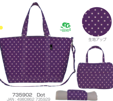
735902 Dot JAN: 4980862 735929

【オムツ替えシート】 サイズ: W45×H68cm 素材: シート部分/ポリエステル