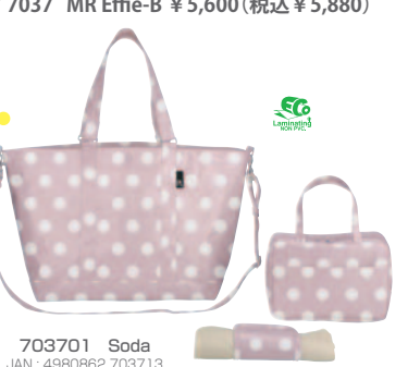
703701 Soda JAN: 4980862 703713

E6 Laminating NON PVC エコラミネーティング ●エコラミネーティング この商品には検知しても有害なダイオキシンの発生が少ない、環境に優しいラミネートを使用しております。素材の特性上、折りじわなどのあとが付きやすい素材ですのでその点をご了承の上、ご使用下さい。