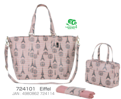
724101 Eiffel JAN: 4980862 724114