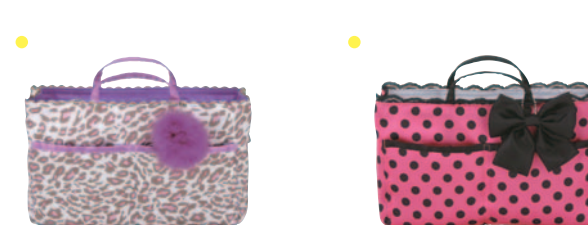
718301 Hyou JAN: 4980862 718311 ラビットファー付 718303 Dreamy JAN: 4980862 718335 リボンチャーム付

サイズ: W25×H15×D7cm 持ち手: 長さ13cm 高さ約3.5cm 素材: 表地/合成皮革 裏地/レーヨン 生産国: 中国 ポケット: 外側6箇所(うちファスナー付1箇所)、内側3箇所(うちファスナー付1箇所)