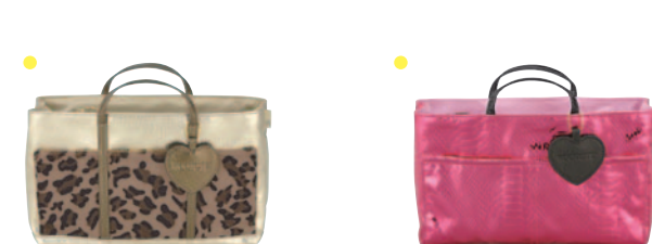
718201 Savanna JAN: 4980862 718212 ハートチャーム付 718202 Pison PIK JAN: 4980862 718229 ハートチャーム付

サイズ: W25×H15×D7cm 持ち手: 長さ13cm 高さ約3.5cm 素材: 表地/合成皮革、裏地/ポリエステル 生産国: 中国 ポケット: 外側6箇所(うちファスナー付1箇所)、内側3箇所(うちファスナー付1箇所)