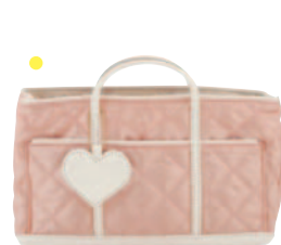
561901 pastel-pik JAN: 4980862 561917 ハートチャーム付

サイズ: W25×H15×D7cm 持ち手: 長さ13cm 高さ約3.5cm 素材: 表地/合成皮革 裏地/ポリエステル 生産国: 中国 ポケット: 外側6箇所(うち1箇所ファスナー付)、内側3箇所(うち1箇所ファスナー付)