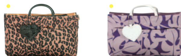
561801 Leo JAN: 4980862 561818 ハートチャーム付 561802 tropical JAN: 4980862 561825 ハートチャーム付

サイズ: W25×H15×D7cm 持ち手: 長さ13cm 高さ約3.5cm 素材: 表地/合成皮革 裏地/ポリエステル 生産国: 中国 ポケット: 外側6箇所(うちファスナー付1箇所)、内側3箇所(うちファスナー付1箇所)