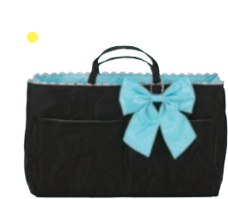
504002 Midnight JAN: 4980862 504020 リボンチャーム付