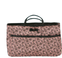
511401 Lace JAN: 4980862 511417 リボン付

サイズ: W25×H15×D7cm 持ち手: 長さ13cm 高さ約3.5cm 素材: 表地/ポリエステル 裏地/ポリエステル 生産国: 中国 ポケット: 外側6箇所(うちファスナー付1箇所)、内側3箇所(うちファスナー付1箇所)