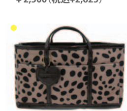
738101 dalmatian-B JAN: 4980862 738111 ハートチャーム付