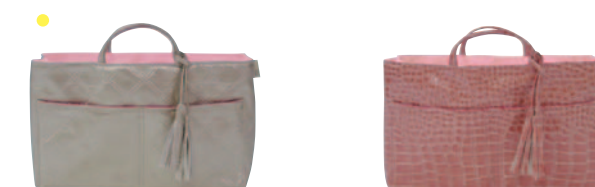
505503 Quilting GLD JAN: 4980862 505539 タッセル付 505504 Croco PIK JAN: 4980862 505546 タッセル付

サイズ: W25×H15×D7cm 持ち手: 長さ13cm 高さ約3.5cm 素材: 表地/ポリエステル 裏地/ポリエステル 生産国: 中国 ポケット: 外側6箇所(うちファスナー付1箇所)、内側3箇所(うち1箇所ファスナー付)