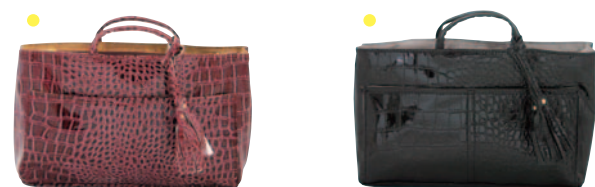
561701 RED JAN: 4980862 561719 タッセル付き 561702 BLK JAN: 4980862 561726 タッセル付き

サイズ: W25×H15×D7cm 持ち手: 長さ13cm 高さ約3.5cm 素材: 表地/ポリエステル 裏地/ポリエステル 生産国: 中国 ポケット: 外側7箇所(うちファスナー付1箇所)、内側3箇所(うちファスナー付1箇所)