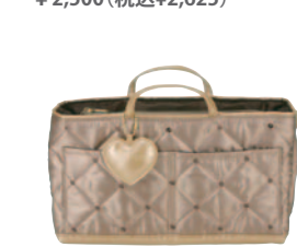
738801 Quilt-span JAN: 4980862 738814 ハートチャーム付

サイズ: W25×H15×D7cm 持ち手: 長さ13cm 高さ約3.5cm 素材: 表地/O1.合成皮革、ポリエステル O2.ポリエステル、表PUコーティング 裏地/ポリエステル 生産国: 中国 ポケット: 外側6箇所(うちファスナー付1箇所)、内側3箇所(うちファスナー付1箇所)*O1は外側7箇所