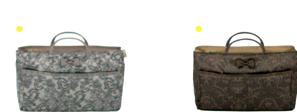
734201 Grace JAN: 4980862 734212 リボン付 734202 Baroq JAN: 4980862 734229 リボン付

サイズ: W25×H15×D7cm 持ち手: 長さ13cm 高さ約3.5cm 素材: 表地/ポリエステル 裏地/ポリエステル 生産国: 中国 ポケット: 外側6箇所(うち1箇所ファスナー付)、内側3箇所(うち1箇所ファスナー付)