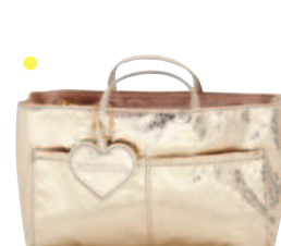
596501 S-GOLD JAN: 4980862 596513 ハートチャーム付

サイズ: W25×H15×D7cm 持ち手: 長さ13cm 高さ約3.5cm 素材: 表地/ポリエステル、合成皮革 裏地/ポリエステル 生産国: 中国 ポケット: 外側7箇所(うち1箇所ファスナー付)、内側3箇所(うち1箇所ファスナー付)*7388は外側6箇所