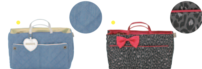
729403 Q-DENIM JAN: 4980862 729430 ハートチャーム付 729404 LEO JAN: 4980862 729447 リボンチャーム付

サイズ: W25×H15×D7cm 持ち手: 長さ13cm 高さ約3.5cm 素材: 表地/ポリエステル 裏地/ポリエステル 生産国: 中国 ポケット: 外側6箇所(うちファスナー付1箇所)、内側3箇所(うちファスナー付1箇所)