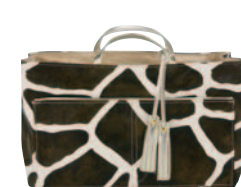
705502 Giraffe JAN: 4980862 705526 タッセル付

サイズ: W25×H15×D7cm 持ち手: 長さ13cm 高さ約3.5cm 素材: 表地/合成皮革 裏地/ポリエステル 生産国: 中国 ポケット: 外側6箇所(うちファスナー付1箇所)、内側3箇所(うちファスナー付1箇所)