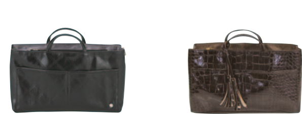
737701 Quilt-BLK JAN: 4980862 737718 ラインストーン付 737702 Croco-BRN JAN: 4980862 737725 タッセル付

サイズ: W25×H15×D7cm 持ち手: 長さ13cm 高さ約3.5cm 素材: 表地/O3.綿 O4.レーヨン 裏地/ポリエステル 生産国: 中国 ポケット: O3.O4 外側6箇所(うちファスナー付1箇所)、内側3箇所(うちファスナー付1箇所)