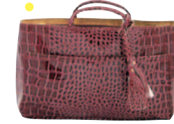
561701 RED JAN: 4980862 561719 タッセル付