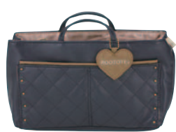
775602 Quilt-nvy JAN: 4980862 775628 ハートチャーム付

サイズ：W25×H15×D7cm 持ち手：13cm 高さ約3.5cm 素材：表地/綿 裏地/ポリエステル 生産国：中国 ポケット：外側6箇所(うち1箇所ファスナー付)、内側3箇所(うち1箇所ファスナー付)