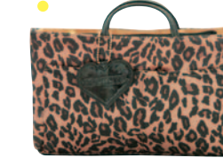
561801 Leo JAN: 4980862 561818 ハートチャーム付