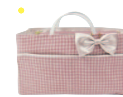
739102 chidori-pik JAN: 4980862 739125 リボンチャーム付