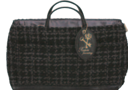
775103 Tweed-gry JAN: 4980862 775130 チャーム付

サイズ：W25×H15×D7cm 持ち手：長さ13cm 高さ約3.5cm 素材：表地/合成皮革 裏地/ポリエステル 生産国：中国 ポケット：外側6箇所(うちファスナー付1箇所)、内側3箇所(うちファスナー付1箇所)