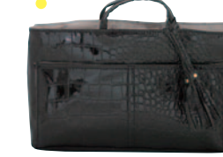
561702 BLK JAN: 4980862 561726 タッセル付

サイズ：W25×H15×D7cm 持ち手：長さ13cm 高さ約3.5cm 素材：表地/ポリエステル 裏地/ポリエステル 生産国：中国 ポケット：外側6箇所(うちファスナー付1箇所)、内側3箇所(うちファスナー付1箇所)