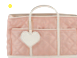
561901 pastel-pik JAN: 4980862 561917 ハートチャーム付

サイズ：W25×H15×D7cm 持ち手：長さ13cm 高さ約3.5cm 素材：表地/合成皮革 裏地/ポリエステル 生産国：中国 ポケット：外側6箇所(うちファスナー付1箇所)、内側3箇所(うちファスナー付1箇所)