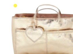
596501 S-GOLD JAN: 4980862 596513 ハートチャーム付