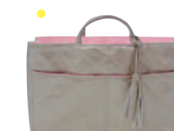
505503 Quilting GLD JAN: 4980862 505539 タッセル付