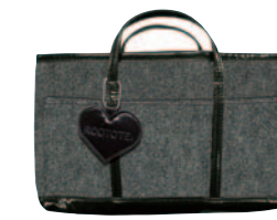
739101 lame-tweed JAN: 4980862 739118 ハートチャーム付

▼ 7391 RC ROO Carriage-N ¥2,500 (税込¥2,625)