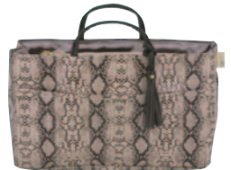
775601 Python-beg JAN: 4980862 775611 タッセル付