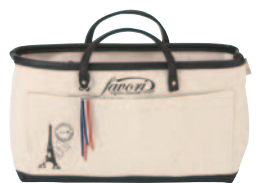
759101 IVOXBLK JAN: 4980862 759116 トリコロールボンチャーム付

▼ 7591 RC ROO Carriage-P ¥2,500 (税込¥2,625)