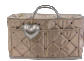
738801 Quilt-span JAN: 4980862 738814 ハートチャーム付

▼ 7388 RC ROO Carriage-K ¥2,500 (税込¥2,625)