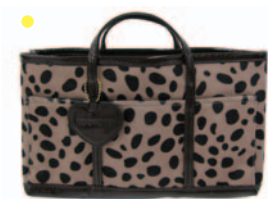
738101 dalmatian-B JAN: 4980862 738111 ハートチャーム付

▼ 7381 RC ROO Carriage-J ¥2,500 (税込¥2,625)