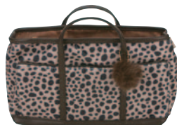
775102 Cheetah-beg JAN: 4980862 775123 ボンボンチャーム付