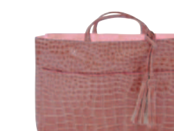
505504 Croco PIK JAN: 4980862 505546 タッセル付

サイズ：W25×H15×D7cm 持ち手：長さ13cm 高さ約3.5cm 素材：表地/01,ポリエステル,ウール,02,アクリル,ポリエステル,その他,03,ポリエステル,アクリル,その他 裏地/ポリエステル 生産国：中国 ポケット：02,外側6箇所(うちファスナー付1箇所)、内側3箇所(うちファスナー付1箇所) 01,03,外側7箇所(うちファスナー付1箇所)、内側3箇所(うちファスナー付1箇所)