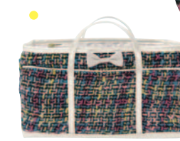
739103 colorful tweed JAN: 4980862 739132 リボン付