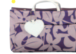
561802 tropical JAN: 4980862 561825 ハートチャーム付

サイズ：W25×H15×D7cm 持ち手：長さ13cm 高さ約3.5cm 素材：表地/ポリエステル 裏地/ポリエステル 生産国：中国 ポケット：外側7箇所(うちファスナー付1箇所)、内側3箇所(うちファスナー付1箇所)