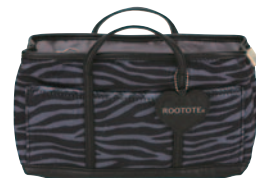
775101 Zebra-blk JAN: 4980862 775116 ハートチャーム付