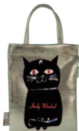
933701 Cat JAN : 4980862 933714