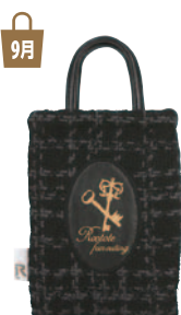
775003 Tweed-gry JAN : 4980862 775031