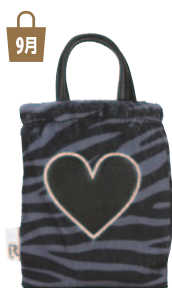
775001 Zebra-bk JAN : 4980862 775017

サイズ：W9.5×H13cm 持ち手：長さ11.5cm 高さ約5cm 素材：表地/合成皮革 裏地/ポリエステル 持ち手/合成皮革 生産国：中国 ポケット：外側ファスナー付1箇所 リュストル ▼ 7755 TR Lustre-R ¥1,200 (税込¥1,260)