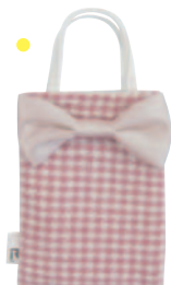
739202 chidori-pik JAN : 4980862 739224 リボン付