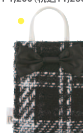
738301 tweed-ribbon JAN : 4980862 738319 リボン付

サイズ：W9.5×H12cm 持ち手：長さ11.5cm 高さ約5cm 素材：表地/ポリエステル 裏地/ポリエステル 持ち手/合成皮革 生産国：中国 ポケット：外側ファスナー付1箇所 リュストル ▼ 9238 TR Lustre-C ¥1,200 (税込¥1,260)