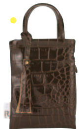
738002 Croco-BRN JAN : 4980862 738029 タassel付