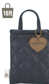
775502 Quilt-nvy JAN : 4980862 775529 ハートチャーム付

サイズ：W9.5×H12cm 持ち手：長さ11.5cm 高さ約5cm 素材：表地/O1.ポリエステル,ウール O2/アクリル,ポリエステル,他 O3/アクリル,その他 裏地/ポリエステル 持ち手/合成皮革 生産国：中国 ポケット：外側ファスナー付1箇所 リュストル ▼ 7392 TR Lustre-N ¥1,200 (税込¥1,260)