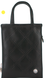
738001 Quilt-BLK JAN : 4980862 738012 ラインストーン付