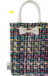
739203 colorful tweed JAN : 4980862 739231 リボン付