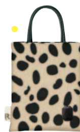
923805 dalmatian JAN : 4980862 923852 ビジュ付

サイズ：W9.5×H12cm 持ち手：長さ11.5cm 高さ約5cm 素材：表地/合成皮革 裏地/ポリエステル 持ち手/合成皮革 生産国：中国 ポケット：外側ファスナー付1箇所 アンディ・ウォーホル タイニールー ▼ 9337 AW tinyroo-A ¥1,200 (税込¥1,260)