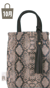
775501 Python-beg JAN : 4980862 775512 タassel付