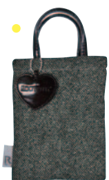
739201 lame-tweed JAN : 4980862 739217 ハートチャーム付

サイズ：W9.5×H12cm 持ち手：長さ11.5cm 高さ約5cm 素材：表地/ポリエステル 裏地/ポリエステル 持ち手/合成皮革 生産国：中国 ポケット：外側ファスナー付1箇所 リュストル ▼ 7383 TR Lustre-J ¥1,200 (税込¥1,260)