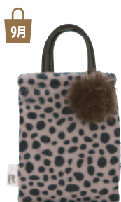
775002 Cheetah-beg JAN : 4980862 775024 ファーチャーム付