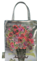
933702 Bouquet JAN : 4980862 933721