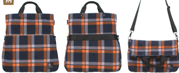
781101 check JAN : 4980862 781117