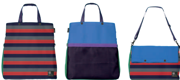
763301 Border JAN : 4980862 763311

▼ 7633 RT FM PATTERN-C ¥2,800 (税込¥2,940)