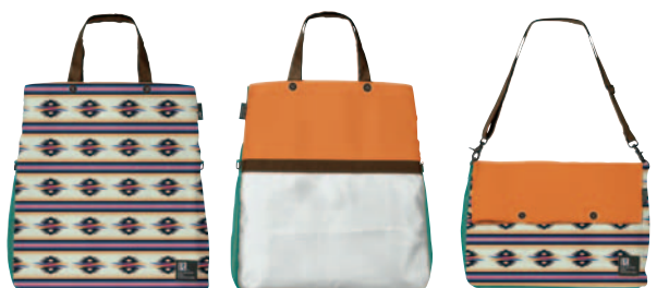
763303 Native JAN : 4980862 763335