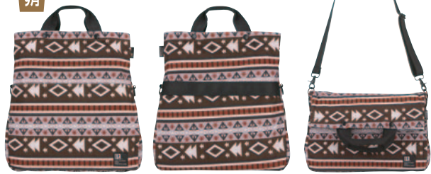
781102 native JAN : 4980862 781124