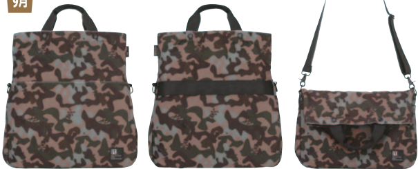
781103 camoskull JAN : 4980862 781131

サイズ：W37×H40×D11cm 持ち手:長さ24cm、ショルダー全長110cm 素材：表地/ポリエステル 裏地/ポリエステル、ドットボタン 生産国：中国 ポケット：外側フラスナー付1箇所 ファーマーズ パターン