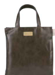
744702 Frost-gry JAN: 4980862 744723