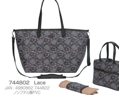
744802 Lace JAN: 4980862 744822 ノンフタル酸PVC

【ポーチ】 サイズ: W21×H15×D8cm 持ち手: 長さ30cm 素材: 表地/綿,PVCラミネート加工 裏地/ポリエステル ポケット: 外側1箇所、内側1箇所