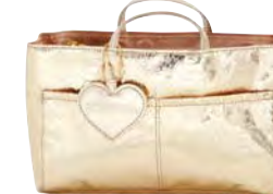
596501 S-GOLD JAN: 4980862 596513 ハートチャーム付