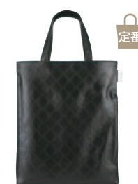
737901 Quilt-BLK JAN: 4980862 737916

▼ 7379 RT A-quatre Lustre-H ¥2,800 (税込¥2,940)