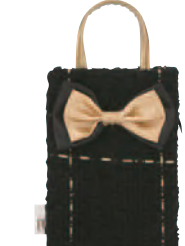
744302 Tweed-G-Stitch JAN: 4980862 744327