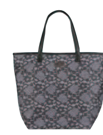
744902 Lace JAN: 4980862 744921 ノンフタル酸PVC