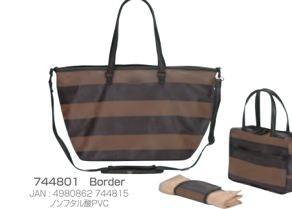
744801 Border JAN: 4980862 744815 ノンフタル酸PVC

▼ 7448 MR LT Shibo Lami-A ¥6,500 (税込¥6,825)