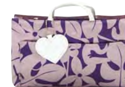
561802 tropical JAN: 4980862 561825 ハートチャーム付

サイズ: W25×H15×D7cm 持ち手: 長さ13cm 高さ約3.5cm 素材: 表地/ポリエステル 裏地/ポリエステル 生産国: 中国 ポケット: 外側7箇所(うちファスナー付1箇所)、内側3箇所(うちファスナー付1箇所)