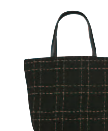
743902 Tweed-G-Stitch JAN: 4980862 743924