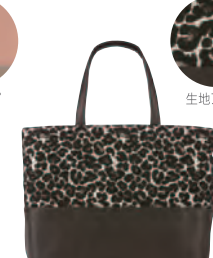
745403 Leo-brn JAN: 4980862 745430