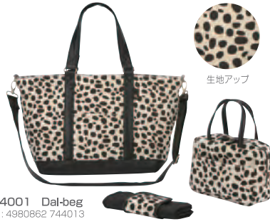
744001 Dal-beg JAN: 4980862 744013

【ポーチ】 サイズ: W21×H15×D8cm 持ち手: 長さ30cm 素材: 表地/ポリエステル 裏地/ポリエステル ポケット: 外側1箇所、内側1箇所