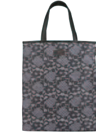
749302 Lace JAN: 4980862 749322 ノンフタル酸PVC