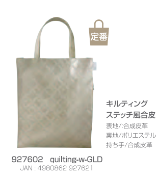
927602 quilting-w-GLD JAN: 4980862 927621

▼ 9276 RT A-quatre Lustre-C ¥2,800 (税込¥2,940)