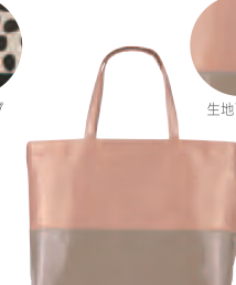
745402 Pik-moca JAN: 4980862 745423