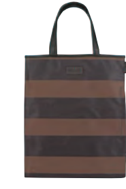
749301 Border JAN: 4980862 749315 ノンフタル酸PVC

▼ 7493 RT A-quatre LT Shibo Lami-A ¥3,000 (税込¥3,150)