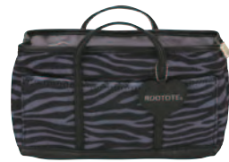
775101 Zebra-blk JAN: 4980862 775116 ハートチャーム付