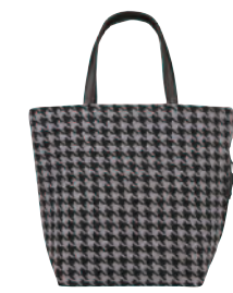
776102 chidori-gry JAN: 4980862 776120