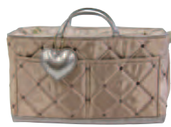
738801 Quilt-span JAN: 4980862 738814 ハートチャーム付

▼ 7388 RC ROO Carriage-K ¥2,500 (税込¥2,625)