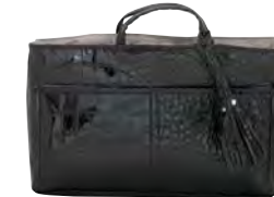
561702 BLK JAN: 4980862 561726 タッセル付

サイズ: W25×H15×D7cm 持ち手: 長さ13cm 高さ約3.5cm 素材: 表地/ポリエステル 裏地/ポリエステル 生産国: 中国 ポケット: 外側6箇所(うちファスナー付1箇所)、内側3箇所(うちファスナー付1箇所)