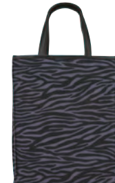
774801 Zebra-blk JAN: 4980862 774812

▼ 7748 RT A-quatre Lustre-Q ¥2,800 (税込¥2,940)