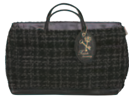
775103 Tweed-gry JAN: 4980862 775130 チャーム付

サイズ: W25×H15×D7cm 持ち手: 長さ13cm 高さ約3.5cm 素材: 表地/合成皮革 裏地/ポリエステル 生産国: 中国 ポケット: 外側6箇所(うちファスナー付1箇所)、内側3箇所(うちファスナー付1箇所)