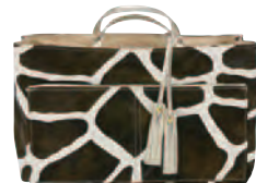
705502 Giraffe JAN: 4980862 705526 タッセル付

サイズ: W25×H15×D7cm 持ち手: 長さ13cm 高さ約3.5cm 素材: 表地/ポリエステル 裏地/ポリエステル 生産国: 中国 ポケット: 外側6箇所(うちファスナー付1箇所)、内側3箇所(うちファスナー付1箇所)