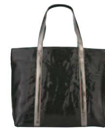
763501 BLK JAN: 4980862 763519 本体生地ス/ンコール

サイズ: W44×H32×D14.5cm 持ち手: 長さ44.5cm 高さ約18.5cm 素材: 表地/ポリエステル 裏地/ポリエステル 持ち手/合成皮革 底板/ベルボレーン マグネットホック 生産国: 中国 ポケット: 外側ファスナー付1箇所、内側3箇所(うちファスナー付1箇所) 小売LOT: 2 / 問屋LOT: 12 ▼ 7635 RT MEDIUM Lustre-ZAG-A ¥3,000 (税込¥3,150)