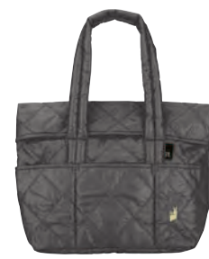
769701 Charcoal JAN: 4980862 769719