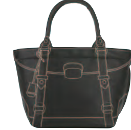
776602 Licorice JAN: 4980862 776625