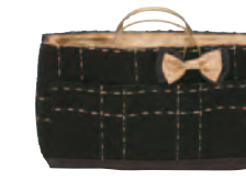
744402 Tweed-G-Stitch JAN: 4980862 744426