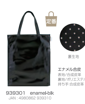
939301 enamel-blk JAN: 4980862 939310

▼ 9393 RT A-quatre Lustre-A ¥2,800 (税込¥2,940)