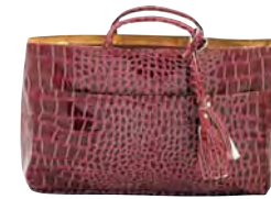
561701 RED JAN: 4980862 561719 タッセル付