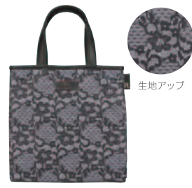
749402 Lace JAN: 4980862 749421 ノンフタル酸PVC