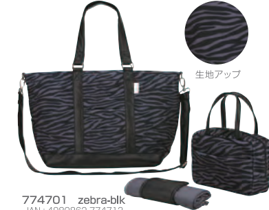
774701 zebra-blk JAN: 4980862 774713