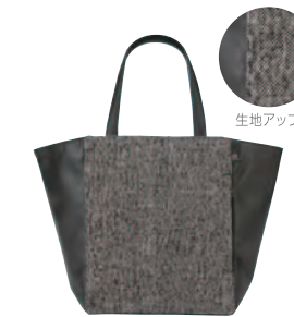
745503 Tubu-blk JAN: 4980862 745539