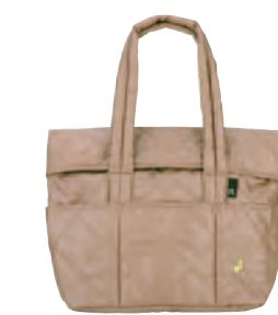
769702 Beige JAN: 4980862 769726