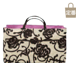
705802 Bloom JAN: 4980862 705823