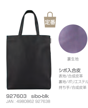
927603 sibo-blk JAN: 4980862 927638