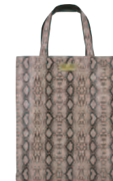
775301 Python-beg JAN: 4980862 775314

▼ 7753 RT A-quatre Lustre-R ¥2,800 (税込¥2,940)