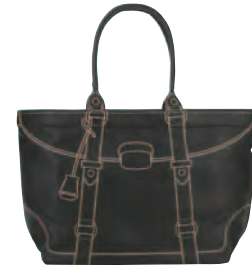
776502 Licorice JAN: 4980862 776526