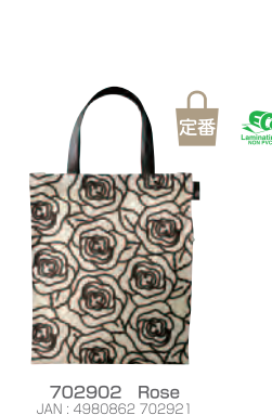
702902 Rose JAN: 4980862 702921

▼ 7029 RT A-quatre Vacance-C ¥2,500 (税込¥2,625)