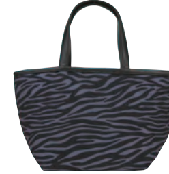
774901 Zebra-blk JAN: 4980862 774911

サイズ: W39×H21×D17.5cm 持ち手: 長さ37.5cm 高さ約16cm 素材: 表地/ポリエステル 裏地/ポリエステル 持ち手/合成皮革 生産国: 中国 ポケット: 外側ファスナー付1箇所、内側3箇所(うちファスナー付1箇所) [7449] 小売LOT: 3 / 問屋LOT: 18 [7759] 小売LOT: 2 / 問屋LOT: 12 ▼ 7749 RT DELI Lustre-Q ¥2,600 (税込¥2,730) ▼ 7759 RT DELI LT Full Span-A ¥3,000 (税込¥3,150)