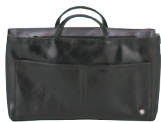
737701 Quilt-BLK JAN: 4980862 737718 ラインストーン付

▼ 7377 RC ROO Carriage-H ¥2,500 (税込¥2,625)