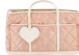
561901 pastel-pik JAN: 4980862 561917 ハートチャーム付

サイズ: W25×H15×D7cm、持ち手: 長さ13cm 高さ約3.5cm 素材: 表地/合成皮革 裏地/ポリエステル 生産国: 中国 ポケット: 外側6箇所(うちファスナー付1箇所)、内側3箇所(うちファスナー付1箇所)