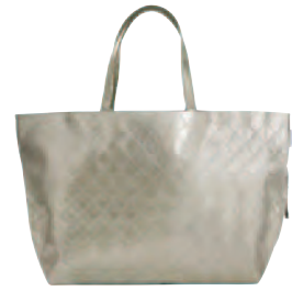
703301 quilting-w-GLD JAN: 4980862 703317 キルティングステッチ風合皮

▼ 7033 RT GRANDE Lustre-A ¥4,500 (税込¥4,725)