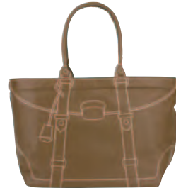
776501 Moca JAN: 4980862 776519

▼ 7765 RT GRANDE LT Minicry-H ¥3,800 (税込¥3,990)