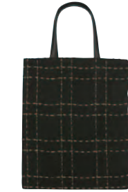
744102 Tweed-G-Stitch JAN: 4980862 744129