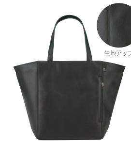
745501 Shibo-blk JAN: 4980862 745515

▼ 7455 RT MEDIUM LT Side-A ¥3,200 (税込¥3,360)