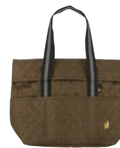
795701 Moss JAN: 4980862 795718

サイズ: W44×H32×D15cm 持ち手: 長さ46cm 高さ約21cm 素材: 表地/ポリエステル 裏地/[7957]ポリエステル 持ち手/PPテープ [7697]綿、ポリエステル マグネット 生産国: 中国 ポケット: 外側ファスナー付5箇所(うちファスナー付2箇所)、内側3箇所(うちファスナー付1箇所) 小売LOT: 2 / 問屋LOT: 12 ▼ 7957 RT Hoodie ROO-B ¥3,500 (税込¥3,675) ▼ 7697 RT Hoodie ROO-A ¥3,500 (税込¥3,675)