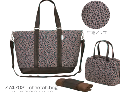
774702 cheetah-beg JAN: 4980862 774720