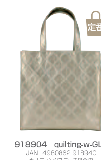
918904 quilting-w-GLD JAN: 4980862 918940 キルティングステッチ風合皮

▼ 9189 RT SQUARE Lustre-A ¥2,400 (税込¥2,520)