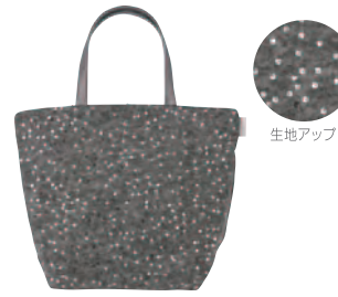
745201 Gry JAN: 4980862 745218

▼ 7452 RT MEDIUM LT-Span-wool-A ¥3,500 (税込¥3,675)