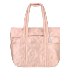
769703 Champagne JAN: 4980862 769733