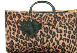
561801 Leo JAN: 4980862 561818 ハートチャーム付