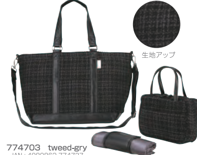
774703 tweed-gry JAN: 4980862 774737

【ポーチ】 サイズ：W21×H15×D8cm 持ち手：長さ30cm 素材：表地/ポリエステル 裏地/ポリエステル ポケット：外側1箇所、内側1箇所