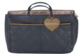
775602 Quilt-nvy JAN: 4980862 775628 ハートチャーム付

サイズ: W25×H15×D7cm 持ち手: 長さ13cm 高さ約3.5cm 素材: 表地/合成皮革 裏地/ポリエステル 生産国: 中国 ポケット: 外側6箇所(うちファスナー付1箇所)、内側3箇所(うちファスナー付1箇所)