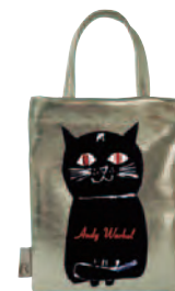
933701 Cat JAN: 4980862 933714