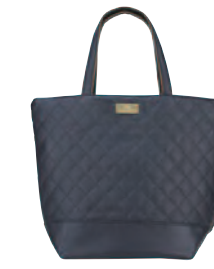
775202 Quilt-nvy JAN: 4980862 775222