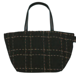
744202 Tweed-G-Stitch JAN: 4980862 744228