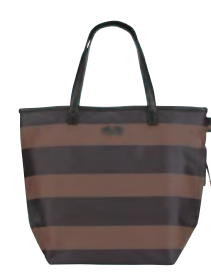
744901 Border JAN: 4980862 744914 ノンフタル酸PVC

▼ 7449 RT MEDIUM LT Shibo Lami-A ¥3,500 (税込¥3,675)