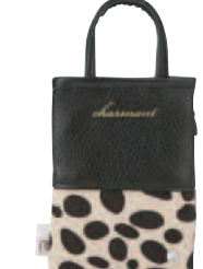
744301 Dal-beg JAN: 4980862 744310