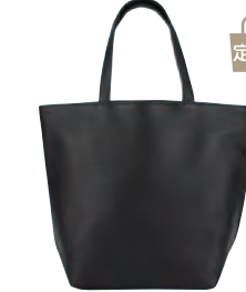
927303 Sibob-blk JAN: 4980862 927331 シボ入合成

サイズ: W42×H32×D17cm 持ち手: 長さ43cm 高さ約18cm 素材: 表地/合成皮革 裏地/ポリエステル 持ち手/合成皮革 底板/ベルボレーン マグネットホック 生産国: 中国 ポケット: 外側ファスナー付1箇所、内側3箇所(うちファスナー付1箇所) 小売LOT: 2 / 問屋LOT: 12 ▼ 9273 RT MED Lustre-C ¥2,800 (税込¥2,940)