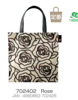
702402 Rose JAN: 4980862 702426

▼ 7024 RT SQUARE Vacance-C ¥1,900 (税込¥1,995)