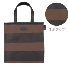
749401 Border JAN: 4980862 749414 ノンフタル酸PVC

サイズ: W24×H24×D10.5cm 持ち手: 長さ31cm 高さ約13cm 素材: 表地/綿、PVCラミネート加工 裏地/ポリエステル 持ち手/合成皮革 底板/ベルボレーン マグネットホック 生産国: 中国 ポケット: 外側ファスナー付1箇所、内側1箇所 小売LOT: 3 / 問屋LOT: 18 ▼ 7494 RT SQUARE LT Shibo Lami-A ¥2,600 (税込¥2,730)