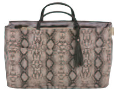
775601 Python-beg JAN: 4980862 775611 タッセル付