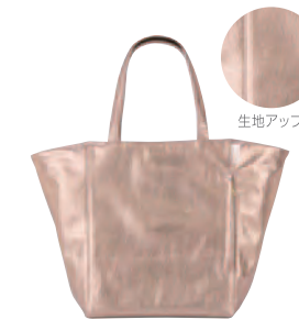
745502 Metallic-pik JAN: 4980862 745522