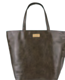
744502 Frost-gry JAN: 4980862 744525