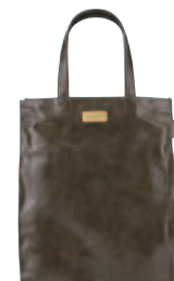
744602 Frost-gry JAN: 4980862 744624