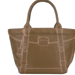
776601 Moca JAN: 4980862 776618

サイズ: W39×H21×D17.5cm 持ち手: 長さ37.5cm 高さ約16cm 素材: 表地/合成皮革 裏地/ポリエステル 持ち手/合成皮革 底板/ベルボレーン マグネットホック 生産国: 中国 ポケット: 外側ファスナー付1箇所、内側3箇所 小売LOT: 3 / 問屋LOT: 18 ▼ 7766 RT DELI LT Mimicry-H ¥2,800 (税込¥2,940)