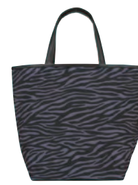
774601 Zebra-blk JAN: 4980862 774614

サイズ: W42×H32×D17cm 持ち手: 長さ43cm 高さ約18cm 素材: 表地/[7746]ポリエステル [7752]合成皮革 [7761]ポリエステル、ウール 裏地/ポリエステル 持ち手/合成皮革 底板/ベルボレーン マグネットホック 生産国: 中国 ポケット: 外側ファスナー付1箇所、内側3箇所(うちファスナー付1箇所) 小売LOT: 2 / 問屋LOT: 12 ▼ 7746 RT MEDIUM Lustre-Q ¥2,800 (税込¥2,940) ▼ 7752 RT MEDIUM Lustre-R ¥3,200 (税込¥3,360) ▼ 7761 RT MEDIUM Lustre-T ¥3,500 (税込¥3,675)