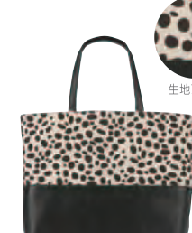
745401 Dal-blk JAN: 4980862 745416

▼ 7454 RT MEDIUM LT 2tone-C ¥3,000 (税込¥3,150)