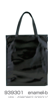
939301 enamel-blk JAN : 4980862 939310