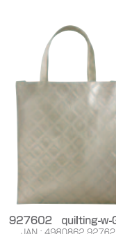
927602 quilting-w-GLD JAN : 4980862 927621

キルティング ステッチ風合皮 表地/合成皮革 裏地/ポリエステル 持ち手/合成皮革