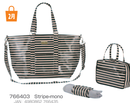
766403 Stripe-mono JAN : 4980862 766435