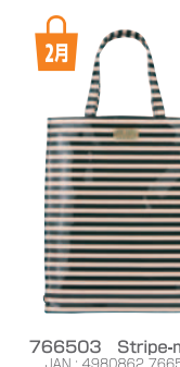
766503 Stripe-mono JAN : 4980862 766534