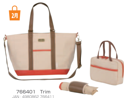
766401 Trim JAN : 4980862 766411