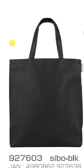
927603 sibo-blk JAN : 4980862 927638

キルティング ステッチ風合皮 表地/合成皮革 裏地/ポリエステル 持ち手/合成皮革