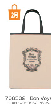
766502 Bon Voyage JAN : 4980862 766527