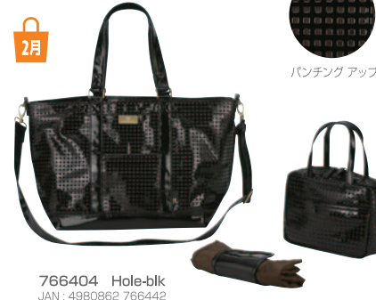
766404 Hole-blk JAN : 4980862 766442