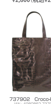
737902 Croco-BRN JAN : 4980862 737923

▼ 9393 RT A-quatre Lustre-A ¥2,800 (税込 ¥2,940)