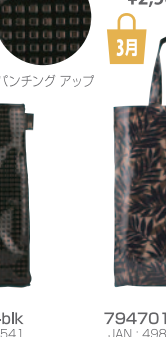
794701 Leaf-NVY JAN : 4980862 794711