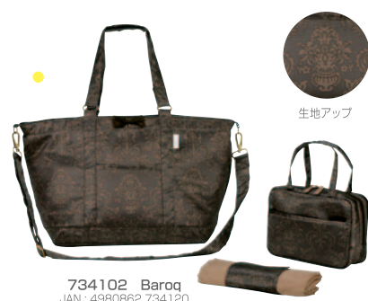
734102 Baroq JAN : 4980862 734120