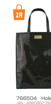
766504 Hole-blk JAN : 4980862 766541