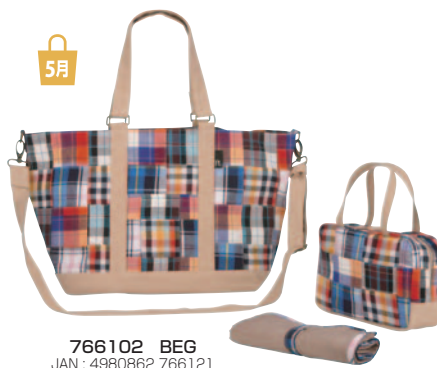
766102 BEG JAN : 4980862 766121