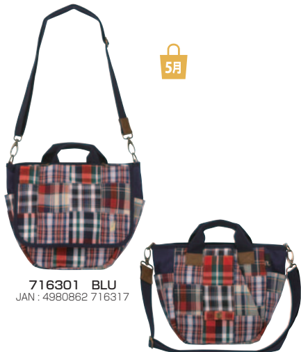
716301 BLU JAN : 4980862 716317

▼ 7163 MR mini MN PATCH WORK-A ¥4,500 (税込¥4,725)