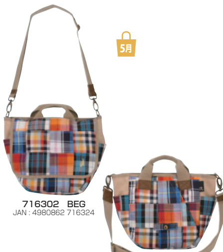
716302 BEG JAN : 4980862 716324