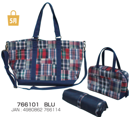
766101 BLU JAN : 4980862 766114

▼ 7661 MR MN PATCH WORK-A ¥6,500 (税込¥6,825)