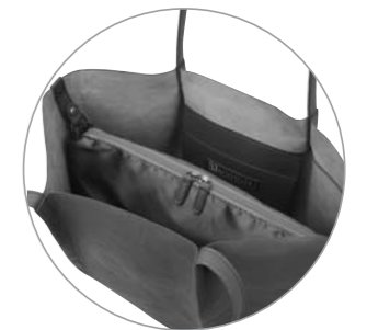
インナーポーチ付