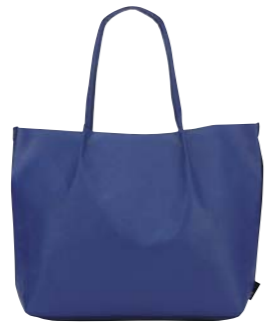
223102 BLU JAN : 4980862 223129