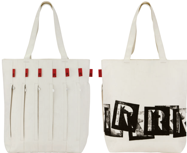
975401 ポケット JAN : 4980862 975417