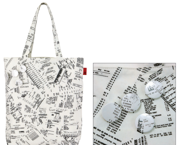
975701 レシート JAN : 4980862 975714