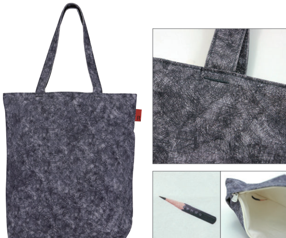
975601 スクリブ JAN : 4980862 975615

サイズ：W40×H39×D10cm 持ち手の長さ:52cm 素材：表地/綿100% ポケット：外側ファスナー付1箇所 内側3箇所 生産国：中国 小売LOT:1/問屋LOT:6