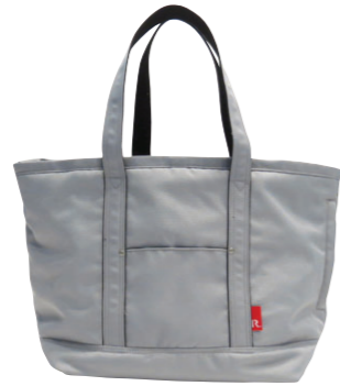
415702 GRAY JAN: 4980862 415722