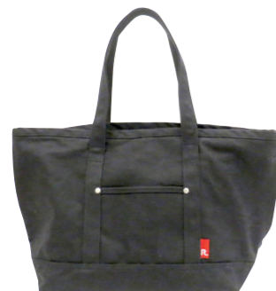
415601 BLACK JAN: 4980862 415616

4月 サイズ: W56×H33×D20cm 持ち手: 長さ56cm 高さ約23cm 重さ: 約820g 素材: 綿 ポリエステル 底板ベルボレーン ドットボタン 生産国: 中国 ポケット: 外側2箇所(うちファスナー付きルーポケット1箇所)、内側4箇所 ペンホルダー: 2箇所 ※背面内ポケット(大): サイズ(内寸): W約37×H約28cm(マチなし) 背面内ポケット(小): サイズ(内寸): W約34×H約24cm(マチなし) (目安としては、背面内ポケット(大)には画面サイズ13インチ程度のPC、背面内ポケット(小)には画面サイズ9.7インチ程度のタブレットが収納できます。)