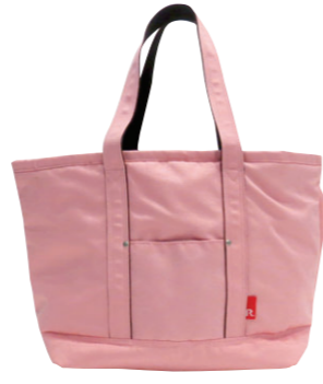
415703 PINK JAN: 4980862 415739