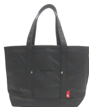
415701 BLACK JAN: 4980862 415715

4月 サイズ: W56×H33×D20cm 持ち手: 長さ56cm 高さ約23cm 重さ: 約730g 素材: ポリエステル 底板ベルボレーン ドットボタン 生産国: 中国 ポケット: 外側2箇所(うちファスナー付きルーポケット1箇所)、内側4箇所 ペンホルダー: 2箇所 ※背面内ポケット(大): サイズ(内寸): W約37×H約28cm(マチなし) 背面内ポケット(小): サイズ(内寸): W約34×H約24cm(マチなし) (目安としては、背面内ポケット(大)には画面サイズ13インチ程度のPC、背面内ポケット(小)には画面サイズ9.7インチ程度のタブレットが収納できます。)