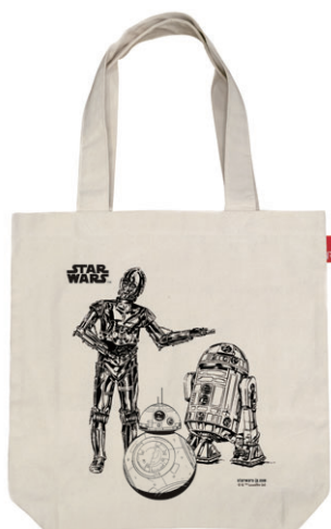
481804 TRIO JAN : 4980862 481840