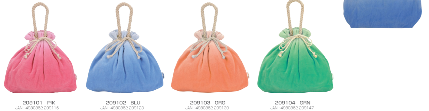
209101 PIK JAN: 4980862 209116 209102 BLU JAN: 4980862 209123 209103 ORG JAN: 4980862 209130 209104 GRN JAN: 4980862 209147