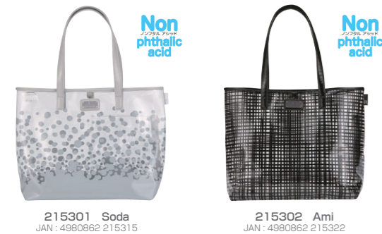
215301 Soda JAN: 4980862 215315 215302 Ami JAN: 4980862 215322

サイズ：W44×H32×D14.5cm 持ち手：長さ54.5cm 高さ約23cm 素材：表地/ノンフタル酸PVC 持ち手/合成皮革 ドットボタン 生産国：中国 ポケット：外側ファスナー付1箇所