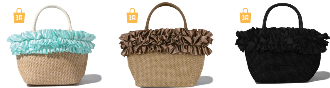
241803 Mint JAN: 4980862 241833 241802 BEG JAN: 4980862 241826 241801 BLK JAN: 4980862 241819

サイズ: W39×H21×D17cm 持ち手: 長さ37.5cm 高さ約14cm 素材: 表地/ポリエチレン 裏地/ポリエステル 持ち手/合成皮革 ポケット: 外側ファスナー付1箇所、内側2箇所 生産国: 中国