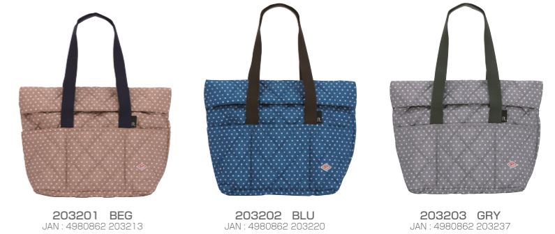
203201 BEG JAN: 4980862 203213 203202 BLU JAN: 4980862 203220 203203 GRY JAN: 4980862 203237

サイズ: W44×H32×D15cm 持ち手: 長さ46cm 高さ約21cm 素材: 表地/ポリエステル 裏地/ポリエステル、綿 持ち手/ポリエステルテープ マグネット ポケット: 外側5箇所(うちファスナー付2箇所)、内側3箇所(うちファスナー付1箇所)