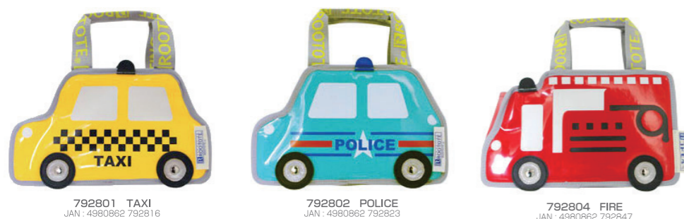
792801 TAXI JAN : 4980862 792816