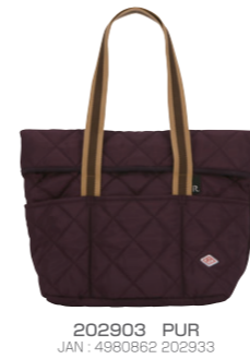
202903 PUR JAN: 4980862 202933

サイズ: W44×H32×D15cm 持ち手: 長さ46cm 高さ約21cm 素材: 表地/ポリエステル 裏地/ポリエステル・綿 持ち手/ポリエステルテープ マグネット ポケット: 外側5箇所(うちファスナー付2箇所)、内側3箇所(うちファスナー付1箇所) 生産国: 中国