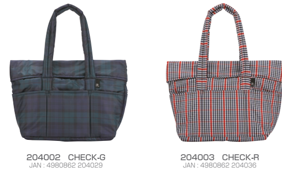
204002 CHECK-G JAN: 4980862 204029 204003 CHECK-R JAN: 4980862 204036

サイズ: W44×H32×D15cm 持ち手: 長さ46cm 高さ約21cm 素材: 表地/ポリエステル 裏地/ポリエステル 持ち手/ポリエステルテープ マグネット 生産国: ベトナム ポケット: 外側5箇所(うちファスナー付2箇所)、内側3箇所(うちファスナー付1箇所)