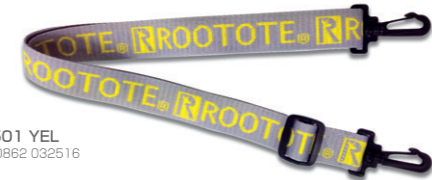
032501 YEL JAN: 4980862 032516

Non phthalic acid ノンフタルアジッド この商品はノンフタル酸PVCを使用しております。ノンフタル酸PVCとは、環境ホルモンとの疑いがあるフタル酸エステル類 (DEHP等) を使用していないPVC素材です。 ※環境ホルモンとは、生活環境中にあり、生体の成長、生殖や行動に関するホルモンの作用を阻害する性質を持っている化学物質のことです。