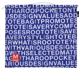
029502 A-soup JAN : 4980862 029523