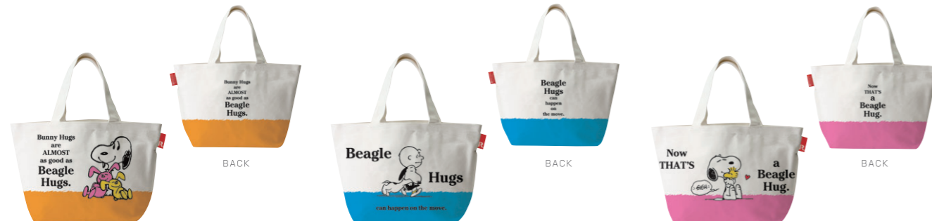
428301 Bunny JAN: 4980862 428319 428302 SN&CB JAN: 4980862 428326 428303 SN&WS JAN: 4980862 428333

© 2014 Peanuts Worldwide LLC www.SNOOPY.co.jp