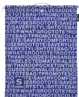
029402 A-soup JAN : 4980862 029424