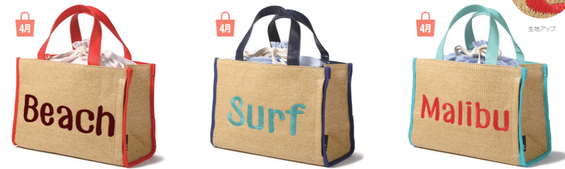
245701 Beach JAN: 4980862 245718 245702 Surf JAN: 4980862 245725 245703 Malibu JAN: 4980862 245732

サイズ: W30×H21×D15cm 持ち手: 長さ32cm 高さ約15cm 素材: 表地/ポリエチレン・ポリプロピレン 裏地/ポリエステル 持ち手/合成皮革 ポケット: 外側ファスナー付1箇所、内側3箇所