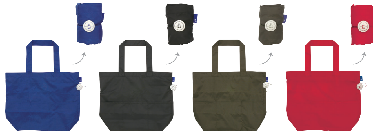
026801 ROOBLUE JAN : 4980862 026812

サイズ：W48×H38×D15cm 持ち手：長さ 55cm 高さ約 24.5cm(収納時：W13× 直径約 7cm) 素材：ポリエステル 生産国：中国 ポケット：外側4箇所 (うちファスナー付1箇所)