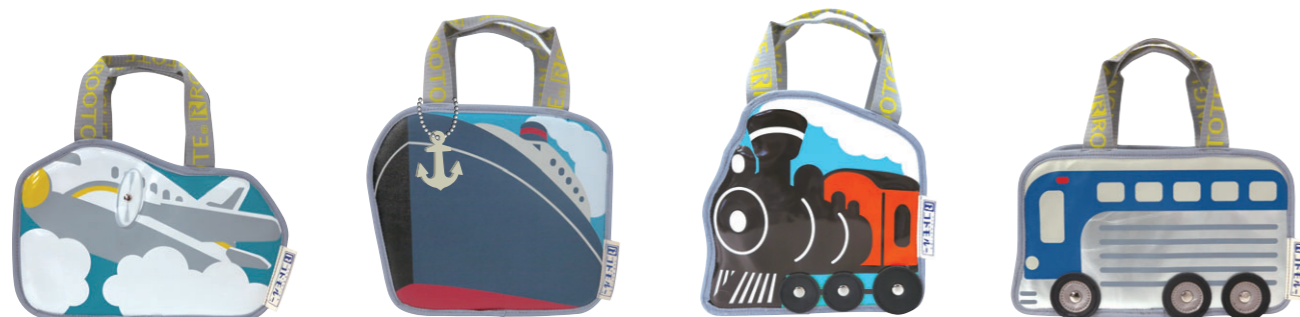
793201 ヒコウキ JAN : 4980862 793219