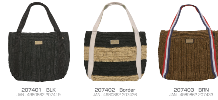
207401 BLK JAN: 4980862 207419 207402 Border JAN: 4980862 207426 207403 BRN JAN: 4980862 207433

サイズ: W44×H30×D14cm 持ち手: 長さ50cm 高さ約19cm 素材: 表地/雑材(紙) 裏地/ポリエステル 持ち手/O1,ポリエステル,ス/ニコール O2,合成皮革 O3,ポリエステル ドットボタン 生産国: 中国 ポケット: 外側1箇所、内側3箇所(うちファスナー付1箇所)