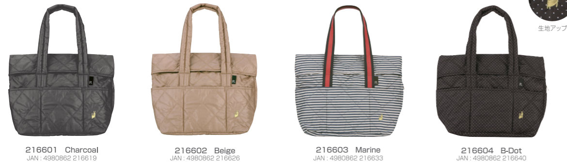
216601 Charcoal JAN: 4980862 216619 216602 Beige JAN: 4980862 216626 216603 Marine JAN: 4980862 216633 216604 B-Dot JAN: 4980862 216640

サイズ: W44×H32×D15cm 持ち手: 長さ46cm 高さ約21cm 素材: 表地/ポリエステル 裏地/綿、ポリエステル 持ち手/01,02,04,ポリエステル 03,ポリエステルテープ マグネット ポケット: 外側5箇所(うちファスナー付2箇所)、内側3箇所(うちファスナー付1箇所) 生産国: 中国