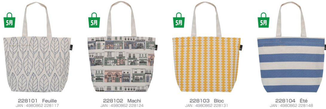
228101 Feuille JAN: 4980862 228117 228102 Machi JAN: 4980862 228124 228103 Bloc JAN: 4980862 228131 228104 Été JAN: 4980862 228148

サイズ: W42×H32×D14cm 持ち手: 長さ50cm 高さ約23cm 素材: 綿 ポケット: 外側ファスナー付1箇所、内側3箇所 生産国: 中国