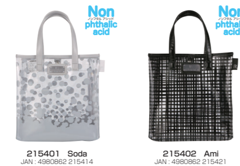
215401 Soda JAN: 4980862 215414 215402 Ami JAN: 4980862 215421

サイズ：W24×H24×D10.5cm 持ち手：長さ31cm 高さ約13cm 素材：表地/ノンフタル酸PVC 持ち手/合成皮革 ドットボタン 生産国：中国 ポケット：外側ファスナー付1箇所