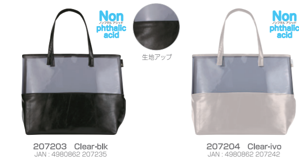
207203 Clear-blk JAN: 4980862 207235 207204 Clear-ivo JAN: 4980862 207242

サイズ：W44×H32×D14.5cm 持ち手：長さ44.5cm 高さ約18.5cm 素材：表地/合成皮革 ノンフタル酸PVC 裏地/ポリエステル 持ち手/合成皮革 底板/ベルボレーン ドットボタン 生産国：中国 ポケット：外側ファスナー付1箇所、内側2箇所