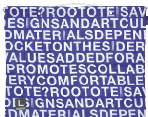
029602 A-soup JAN : 4980862 029622