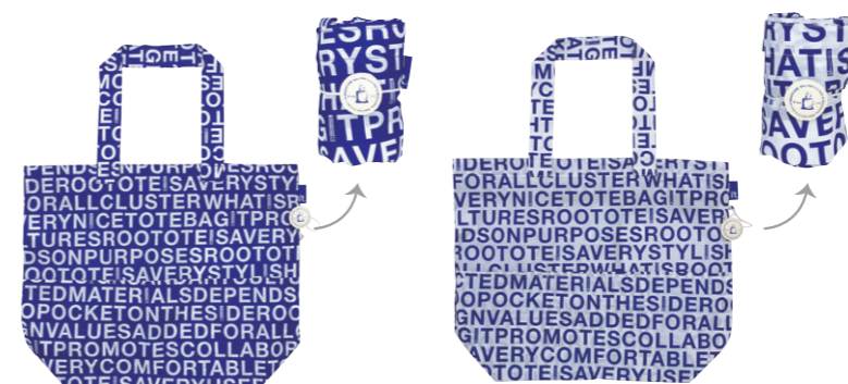
026601 A-SOUP/NEGA JAN : 4980862 026614

サイズ：W48×H38×D15cm 持ち手：長さ 55cm 高さ約 24.5cm(収納時：W13× 直径約 7cm) 素材：ポリエステル 生産国：中国 ポケット：外側4箇所 (うちファスナー付1箇所)