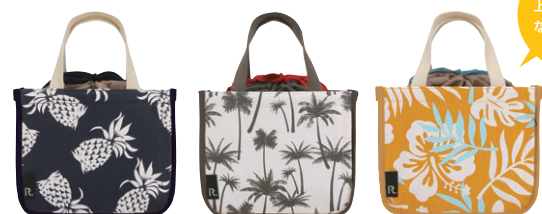
212701 Pineapple JAN :4980862 212710 212702 Palm Tree JAN :4980862 212727 212703 Hibiscus JAN :4980862 212734

▼ 2127 RT Thermo Keeper SQUARE SC Pattern-E 税抜 ¥2,200