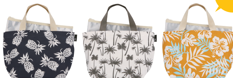
212801 Pineapple JAN :4980862 212819 212802 Palm Tree JAN :4980862 212826 212803 Hibiscus JAN :4980862 212833

▼ 2128 RT Thermo Keeper 2way LUNCH SC Pattern-E 税抜 ¥2,500