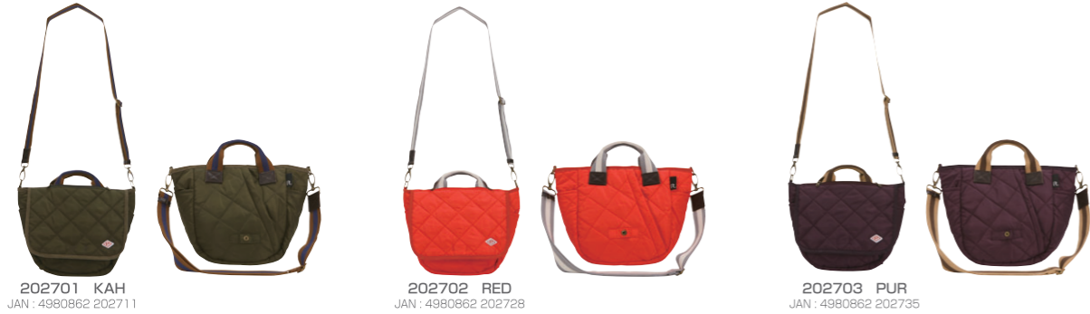
202701 KAH JAN: 4980862 202711 202702 RED JAN: 4980862 202728 202703 PUR JAN: 4980862 202735

サイズ: W22.5×H24×D14cm 持ち手: 長さ19cm 高さ約4cm ショルダー: 最長120cm 素材: 表地/ポリエステル 裏地/ポリエステル・綿 持ち手/ポリエステルテープ ドットボタン ポケット: 外側4箇所(うちファスナー付2箇所)、内側5箇所(うちファスナー付1箇所、ボトルホルダー1箇所) 生産国: 中国