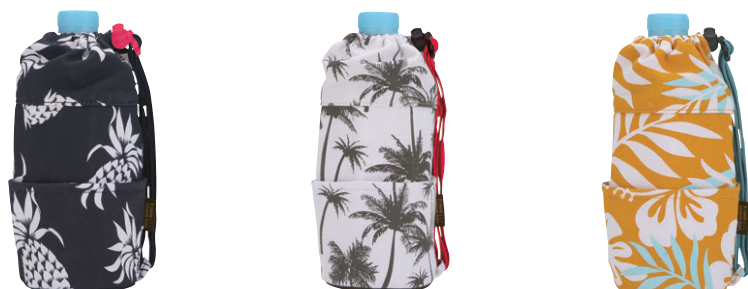
212601 Pineapple JAN :4980862 212611 212602 Palm Tree JAN :4980862 212628 212603 Hibiscus JAN :4980862 212635