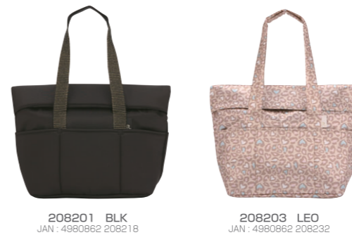
208201 BLK JAN: 4980862 208218 208203 LEO JAN: 4980862 208232

サイズ: W44×H32×D15cm 持ち手: 長さ46cm 高さ約21cm 素材: 表地/ポリエステル 裏地/ポリエステル 持ち手/01,02,ポリエステルテープ 03,ポリエステル マグネット 生産国: 中国 ポケット: 外側5箇所(うちファスナー付2箇所)、内側3箇所(うちファスナー付1箇所)