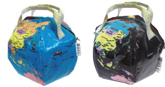
793401 BLU JAN: 4980862 793417 793402 BLK JAN: 4980862 793424

サイズ：巾3cm、ショルダー：最長時115cm (ナスカン含む) 素材：PPテープ、プラスチックナスカン 生産国：中国 小売LOT:5/問屋LOT:30