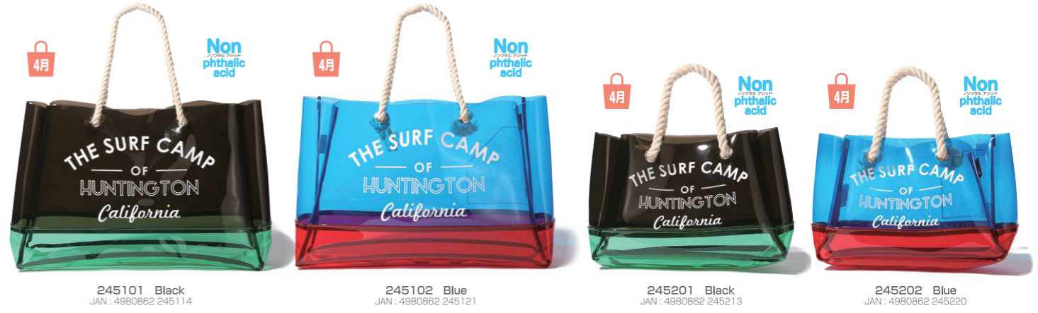
245101 Black JAN: 4980862 245114 245102 Blue JAN: 4980862 245121 245201 Black JAN: 4980862 245213 245202 Blue JAN: 4980862 245220

サイズ：W48×H34×D17cm 持ち手：長さ56cm 高さ約24cm 素材：表地/ノンフタル酸PVC 持ち手/綿 ポケット：外側1箇所 生産国：中国