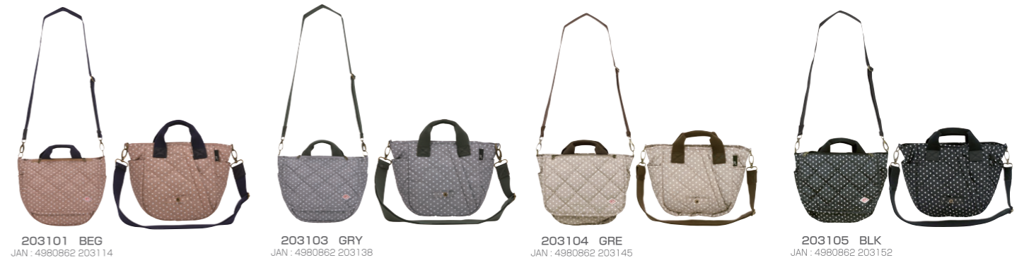
203101 BEG JAN: 4980862 203114 203103 GRY JAN: 4980862 203138 203104 GRE JAN: 4980862 203145 203105 BLK JAN: 4980862 203152

サイズ: W22.5×H24×D14cm 持ち手: 長さ19cm 高さ約4cm ショルダー: 最長120cm 素材: 表地/ポリエステル 裏地/ポリエステル、綿 持ち手/ポリエステルテープ ドットボタン ポケット: 外側4箇所(うちファスナー付2箇所)、内側5箇所(うちファスナー付1箇所、ボトルホルダー1箇所)