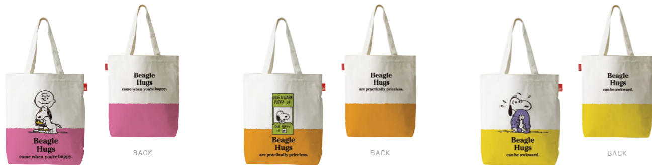
428201 Happy JAN: 4980862 428210 428202 Priceless JAN: 4980862 428227 428203 Cat JAN: 4980862 428234

© 2014 Peanuts Worldwide LLC www.SNOOPY.co.jp