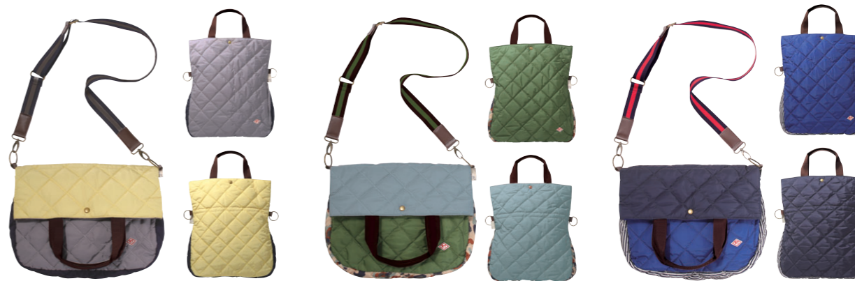
287001 Plain JAN: 4980862 287015 287002 Camo JAN: 4980862 287022 287003 Border JAN: 4980862 287039

Simply natural 2016 S/S Collection | vol.2