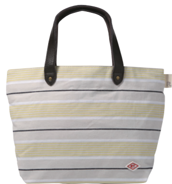
287601 YEL JAN: 4980862 287619