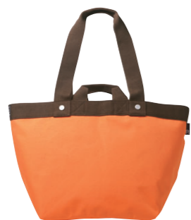
205003 Orange JAN: 4980862 287930