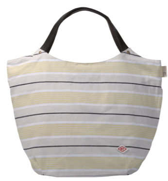
287701 YEL JAN: 4980862 287718