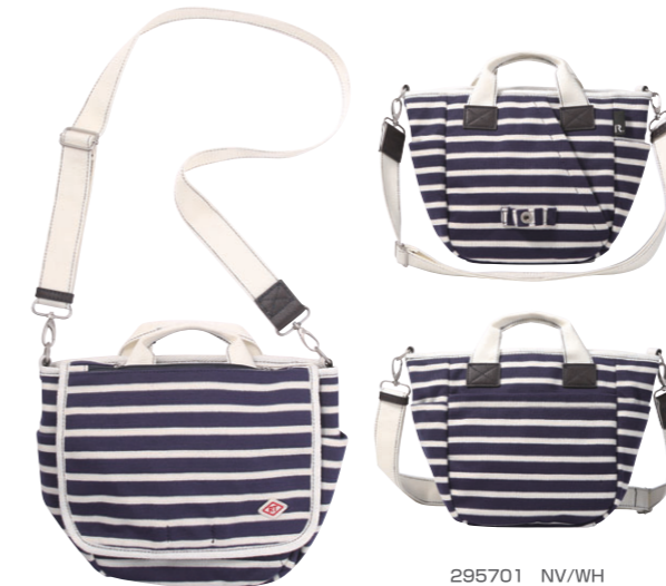
295701 NV/WH JAN: 4980862 295713