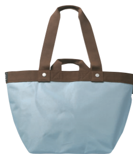
287904 Sax JAN: 4980862 287947