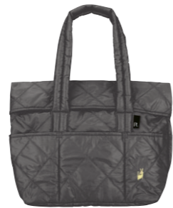
216601 Charcoal JAN: 4980862 216619

サイズ: W44×H32×D15cm 持ち手: 長さ46cm 高さ約21cm 素材: 表地/ポリエステル 裏地/綿、ポリエステル 持ち手/ポリエステル マグネット ポケット: 外側5箇所(うちファスナー付2箇所) 内側3箇所(うちファスナー付1箇所) 生産国: 中国 小売LOT: 2 / 問屋LOT: 12