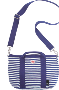
287402 BL/WH JAN: 4980862 287428