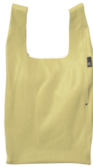
288803 YEL JAN : 4980862 288838