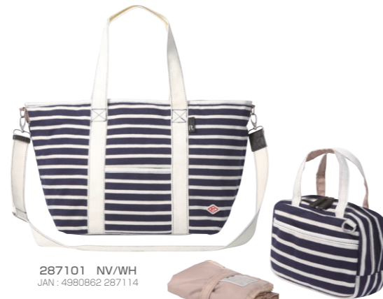
287101 NV/WH JAN: 4980862 287114

2871 MR.SN.Border-H 税抜 ¥6,500 【トートバッグ】 サイズ: W55×H30×D20cm 持ち手: 長さ52cm 高さ約23cm ショルダー: 長さ最長120cm 素材: 表地/綿 裏地/ポリエステル 持ち手 ショルダー/ポリエステル 底板/ベルボレーン マグネットホック ポケット: 外側3箇所(うちファスナー付1箇所)、内側6箇所(うちファスナー付1箇所) 【ポーチ】 サイズ: W21×H15×D8cm 持ち手: 長さ30cm 素材: 表地/綿 裏地/ポリエステル ポケット: 外側1箇所、内側1箇所 【オムツ替えシート】 サイズ: W45×H68cm 素材: シート部分 ポリエステル 生産国: インドネシア 小売LOT: 2 / 問屋LOT: 12