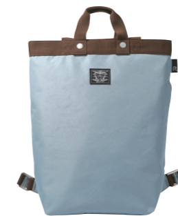
288104 Sax JAN: 4980862 288142