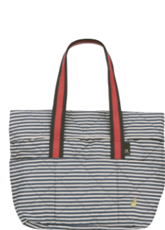
216603 Marine JAN: 4980862 216633