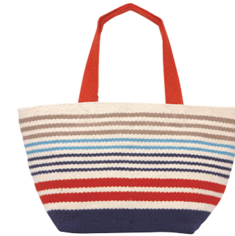
242901 Trico JAN : 4980862 242915

デリ ラグ 2429 RT DELI SY Rug-C 税抜 ¥3,000 サイズ: W39×H21×D17.5cm 持ち手: 長さ37.5cm 高さ約16cm 素材: 綿 ポケット: 外側1箇所、内側2箇所 生産国: インド 小売LOT: 3 / 問屋LOT: 18