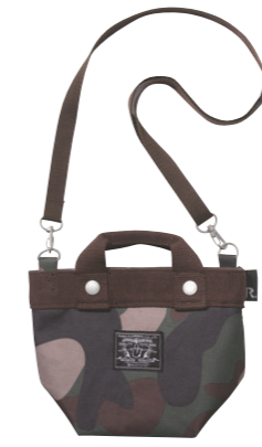
274602 CAMO JAN: 4980862 274626