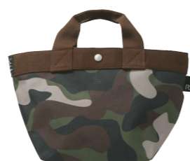
288002 Camo JAN: 4980862 288029