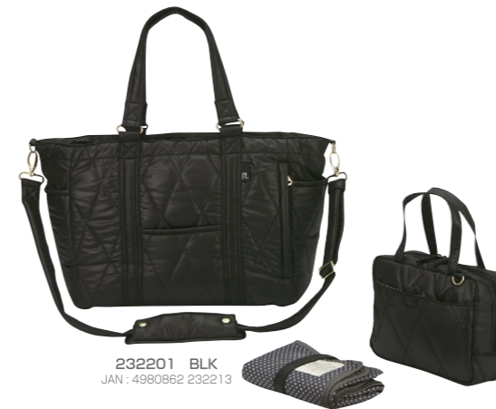
232201 BLK JAN: 4980862 232213