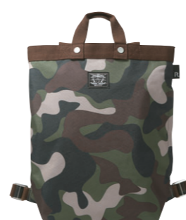
288102 Camo JAN: 4980862 288128