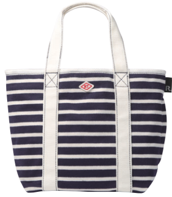
287201 NV/WH JAN: 4980862 287213