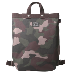
273202 CAMO JAN: 4980862 273223