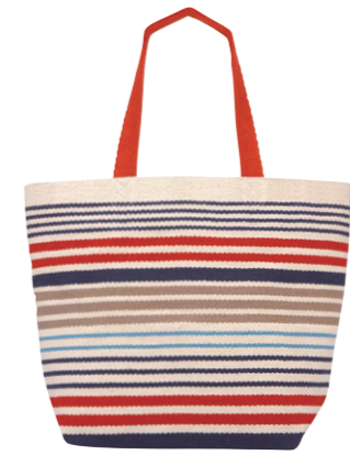
242801 Trico JAN : 4980862 242816

ミディアム ラグ 2428 RT MED SY Rug-C 税抜 ¥3,800 サイズ: W46×H34×D16cm 持ち手: 長さ52cm 高さ約20cm 素材: 綿 ポケット: 外側1箇所、内側2箇所 生産国: インド 小売LOT: 2 / 問屋LOT: 12