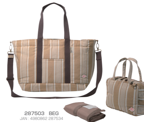
287503 BEG JAN : 4980862 287534