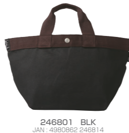
246801 BLK JAN: 4980862 246814

サイズ: W41×H23×D20cm 持ち手: 長さ28cm 高さ約14cm 素材: 表地/ポリエステル 裏 TPE加工 持ち手/ポリエステル ドットボタン ポケット: 外側ファスナー付1箇所、内側ファスナー付1箇所 生産国: 中国 小売LOT: 3 / 問屋LOT: 18