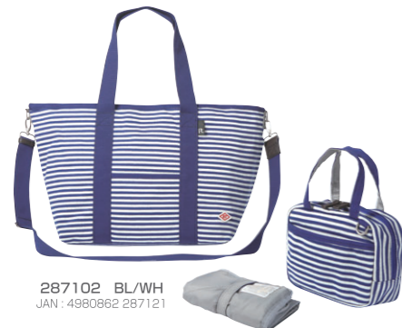
287102 BL/WH JAN: 4980862 287121