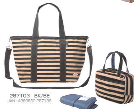
287103 BK/BE JAN: 4980862 287138