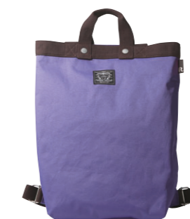
273204 PUR JAN: 4980862 273247