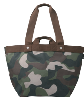
287902 Camo JAN: 4980862 287923