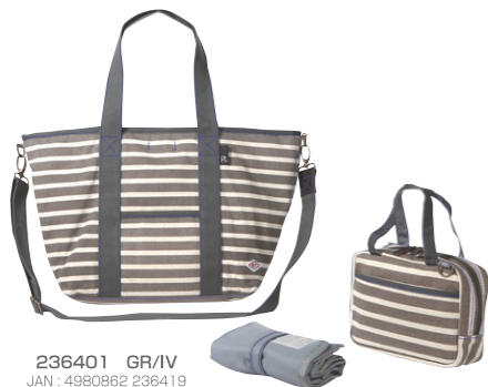
236401 GR/IV JAN: 4980862 236419

【トートバッグ】 サイズ: W55×H30×D20cm 持ち手: 長さ52cm 高さ約23cm ショルダー: 長さ最長120cm 素材: 表地/綿 裏地/ポリエステル 持ち手 ショルダー/ポリエステル マグネットホック ポケット: 外側3箇所(うちファスナー付1箇所)、内側6箇所(うちファスナー付1箇所) 【ポーチ】 サイズ: W21×H15×D8cm 持ち手: 長さ30cm 素材: 表地/綿 裏地/ポリエステル ポケット: 外側1箇所、内側1箇所 【オムツ替えシート】 サイズ: W45×H68cm 素材: シート部分 ポリエステル 生産国: 中国 小売LOT: 2 / 問屋LOT: 12