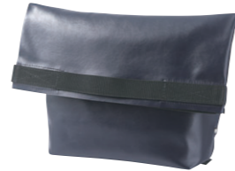
288904 Nvy JAN : 4980862 288944