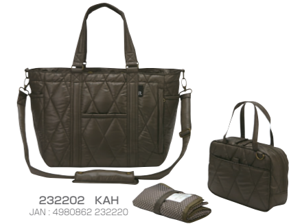
232202 KAH JAN: 4980862 232220

【トートバッグ】 サイズ: W55×H30×D18cm 持ち手: 長さ50cm 高さ約23cm ショルダー: 長さ最長120cm 素材: 表地/ポリエステル 裏地/ポリエステル マグネットホック ポケット: 外側4箇所(うちファスナー付1箇所)、内側10箇所(うちファスナー付1箇所) 【ポーチ】 サイズ: W21×H15×D8cm 持ち手: 長さ30cm 素材: 表地/ポリエステル 裏地/ポリエステル ポケット: 外側1箇所、内側1箇所 【オムツ替えシート】 サイズ: W45×H68cm 素材: ポリエステル 生産国: 中国 小売LOT: 2 / 問屋LOT: 12