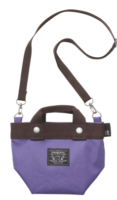
274604 PUR JAN: 4980862 274640