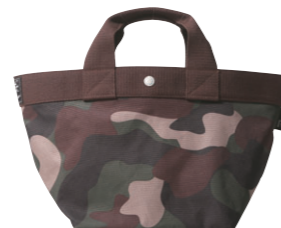
273102 CAMO JAN: 4980862 273124