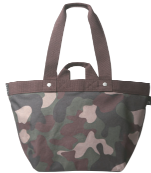
273002 CAMO JAN: 4980862 273025