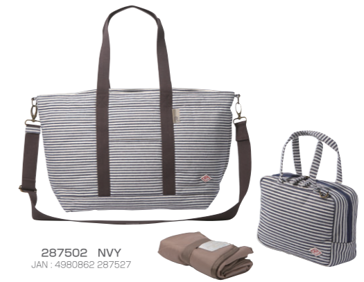
287502 Nvy JAN : 4980862 287527