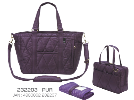
232203 PUR JAN: 4980862 232237