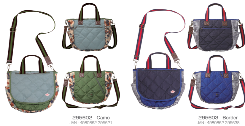
295602 Camo JAN: 4980862 295621 295603 Border JAN: 4980862 295638