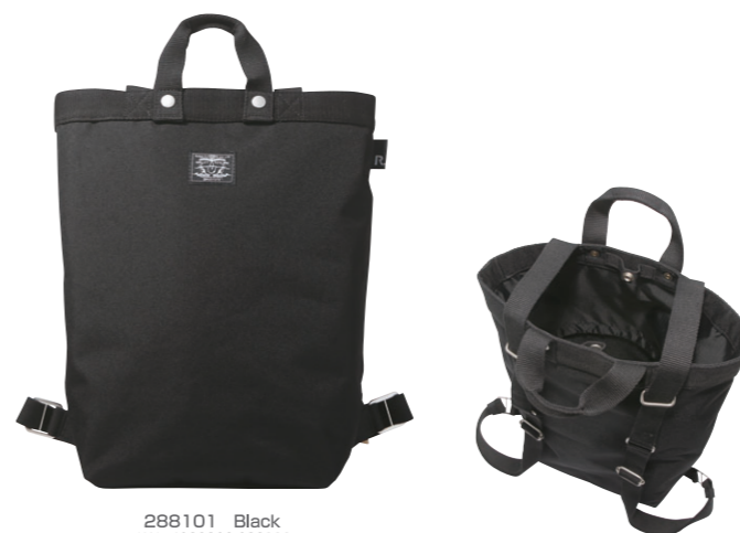
288101 Black JAN: 4980862 288111

2880 RT.DELI.SN.Poly-D 税抜 ¥3,000 サイズ: W41×H23×D20cm 持ち手: 長さ28cm 高さ約10cm 素材: 表地/ポリエステル 裏 TPE加工 持ち手/ポリエステル ドットボタン ポケット: 外側ファスナー付1箇所、内側ファスナー付1箇所 生産国: ベトナム 小売LOT: 3 / 問屋LOT: 18