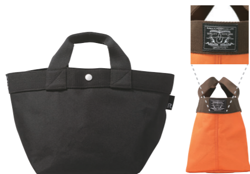
288001 Black JAN: 4980862 288012

2879 RT.Grande.SN.Poly-D 税抜 ¥4,000 サイズ: W54×H32×D24cm 持ち手: (大)長さ64cm 高さ約27cm (小)長さ21cm 高さ約6.5cm 素材: 表地/ポリエステル 裏 TPE加工 持ち手/ポリエステル ドットボタン ポケット: 外側ファスナー付1箇所、内側ファスナー付1箇所 生産国: ベトナム 小売LOT: 2 / 問屋LOT: 12