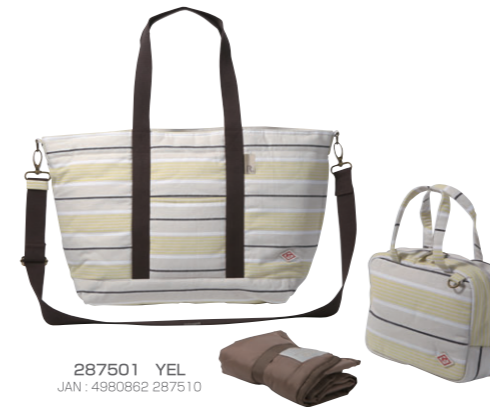
287501 YEL JAN : 4980862 287510