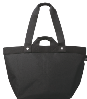
287901 Black JAN: 4980862 287916