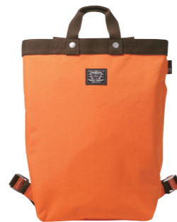
288103 Orange JAN: 4980862 288135