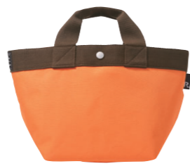
288003 Orange JAN: 4980862 288036