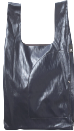
288804 Nvy JAN : 4980862 288845