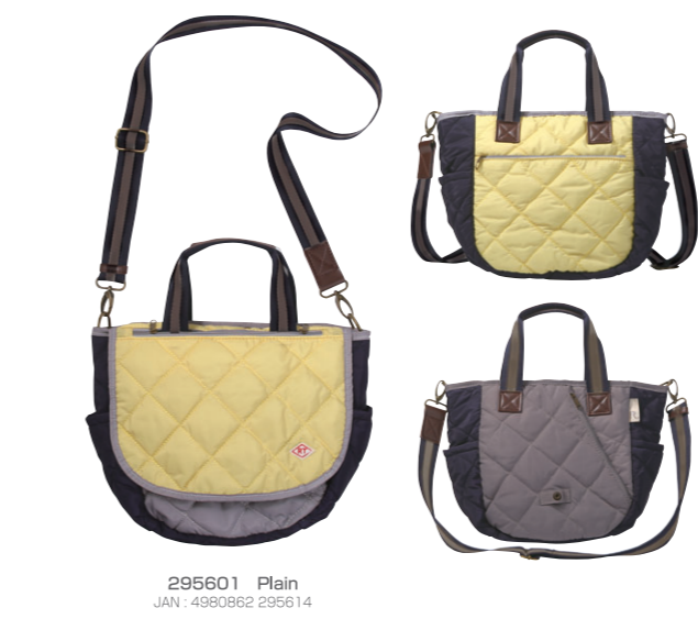
295601 Plain JAN: 4980862 295614

ROUND™ Jan.1 2869 RT.ROUND.SN.P-Quilting-P 税抜 ¥3,800 サイズ: W46×H33×D23cm 持ち手: 長さ35cm 高さ約16cm 素材: 表地/ポリエステル 裏地/ポリエステル、綿 持ち手/ポリエステル マグネットホック ポケット: 外側ファスナー付1箇所、内側3箇所(うちファスナー付1箇所) 生産国: 中国 小売LOT: 2/問屋LOT: 12