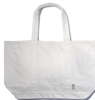
292301 White JAN : 4980862 292316 ホワイトデニムにダメージ加工とリメイク加工を施しました。

サイズ：W56×H34×D17cm 持ち手：長さ54cm 高さ約24cm 素材：綿 ポケット：外側1箇所、内側2箇所 生産国：中国 小売LOT：2 / 問屋LOT：12 ※この商品は、製品洗い加工のためサイズにばらつきがございます。 ご了承ください。