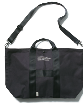
292701 Navy JAN : 4980862 292712

サイズ：W60×H37×D17cm 持ち手：長さ25cm 高さ約8cm ショルダー最長110cm 素材：表地/綿 O2のみ撥水加工 持ち手/ポリエステル ドットボタン ポケット：外側2箇所(うちファスナー付1箇所)、内側2箇所、ペンポケット 生産国：中国 小売LOT：2 / 問屋LOT：12