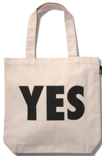
292804 Yes JAN : 4980862 292842