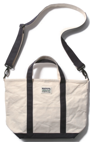
292901 Navy JAN : 4980862 292910