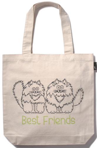
292805 Friends JAN : 4980862 292859