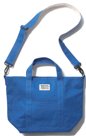
292903 Blue JAN : 4980862 292934