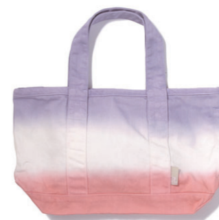
292401 Purple JAN : 4980862 292415