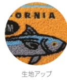
293402 Sardines JAN : 4980862 293429