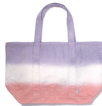
292501 Purple JAN : 4980862 292514

サイズ：W56×H34×D17cm 持ち手：長さ54cm 高さ約24cm 素材：綿 ポケット：外側1箇所、内側2箇所 生産国：中国 小売LOT：2 / 問屋LOT：12 ※この商品は、製品洗い加工のためサイズにばらつきがございます。ご了承ください。