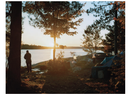
Lake of the Woods

恰幅のいい店員と、使い込まれたノスタルジックなチープなプレート、一枚のナプキンの上に置かれた曲がったフォークとナイフ。アメリカ最南端のレストランという説明も、店で食べた料理も覚えていない。