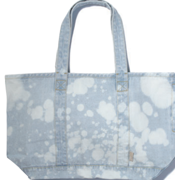
292302 Bleach JAN : 4980862 292323 ブリーチ加工で雲のような模様を表現し、洗いをかけています。