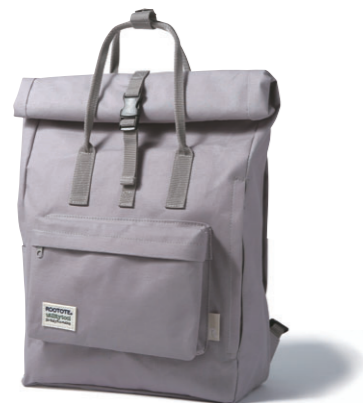
293902 Gray JAN：4980862 293924