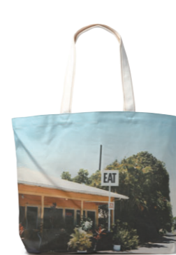
491002 Naalehu JAN: 4980862 491023