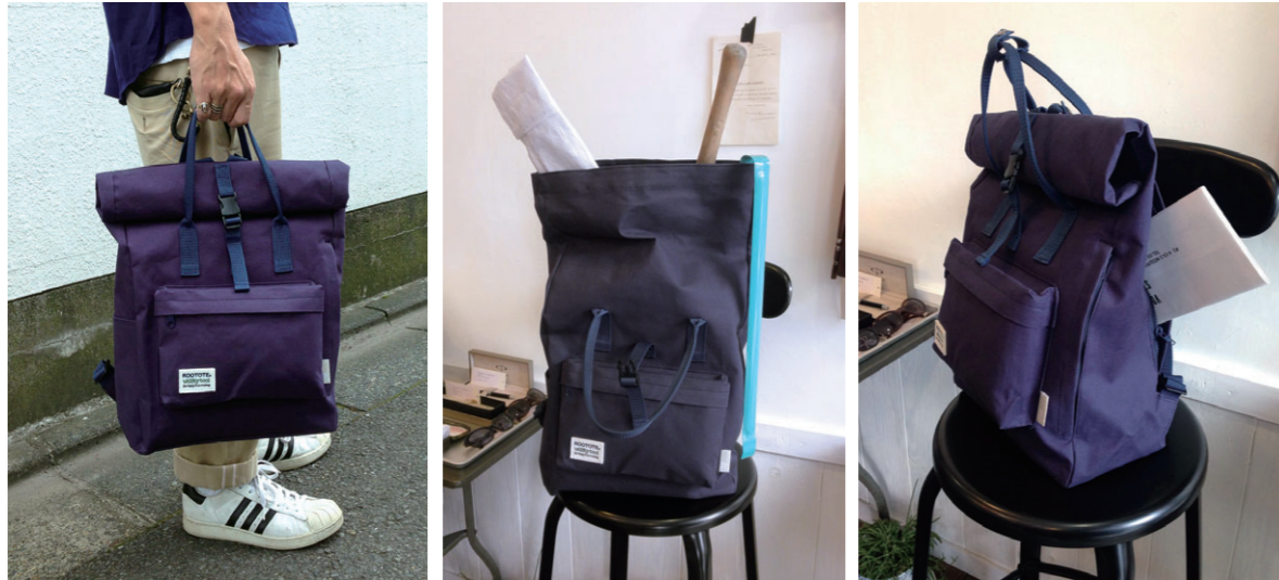
サイドに内側に通じるファスナーポケットがついています。上部を開かなくても中のものが取り出せます。