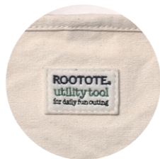
フェルトネーム付

サイズ：W37×H27×D13cm 持ち手：長さ27cm 高さ約10cm ショルダー：最長110cm 素材：綿 ドットボタン ポケット：外側2箇所、内側1箇所 生産国：中国 小売LOT：2 / 問屋LOT：12