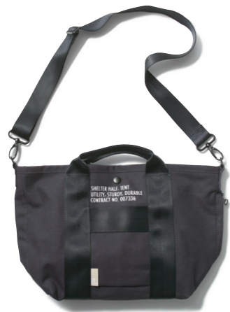
292601 Navy JAN : 4980862 292613

DELI™ 2926 デリ アーミー RT.DELI SC.Army-F 税抜 ¥3,800