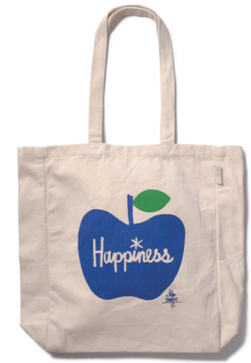
492903 Apple JAN : 4980862 492938