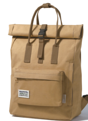
293002 Beige JAN : 4980862 293023