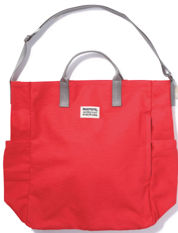
293203 Red JAN: 4980862 293238