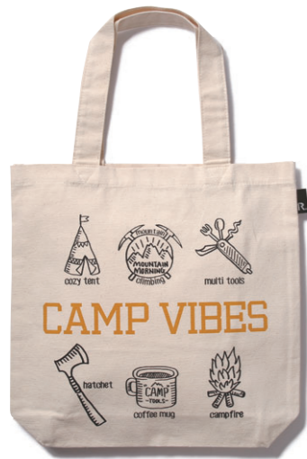
292801 Camp JAN : 4980862 292811