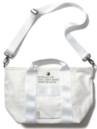
292602 White JAN : 4980862 292620