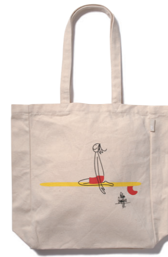
492901 Paddle JAN : 4980862 492914

TALL™ 4929 トール パームグラフィックス RT.TALL.SC.Palm Graphics-A 税抜 ¥3,800