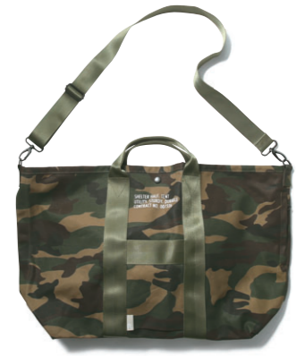
292703 Woodland JAN : 4980862 292736

DELI™ 2922 デリ デニム RT.DELI DENIM-H 税抜 ¥4,500