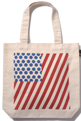
292802 Flag JAN : 4980862 292828