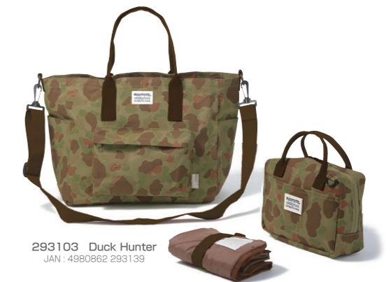
293103 Duck Hunter JAN：4980862 293139