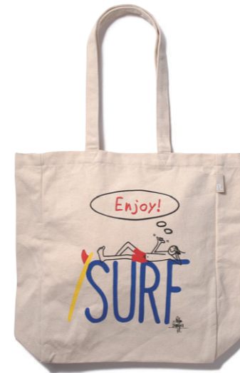
492902 Surf JAN : 4980862 492921