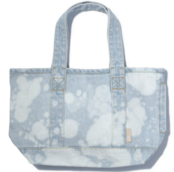
292202 Bleach JAN : 4980862 292224 ブリーチ加工で雲のような模様を表現し、洗いをかけています。

GRANDE™ 2923 グランデ デニム RT.Grande DENIM-H 税抜 ¥5,800