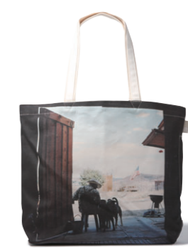
491001 Bryce Canyon JAN: 4980862 491016