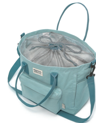
上部にメッシュ巾着が付きます。