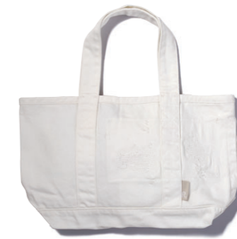
292201 White JAN : 4980862 292217 ホワイトデニムにダメージ加工とリメイク加工を施しました。

サイズ：W41×H24×D12cm 持ち手：長さ40cm 高さ約18cm 素材：綿 ポケット：外側1箇所、内側2箇所 生産国：中国 小売LOT：2 / 問屋LOT：12 ※この商品は、製品洗い加工のためサイズにばらつきがございます。 ご了承ください。