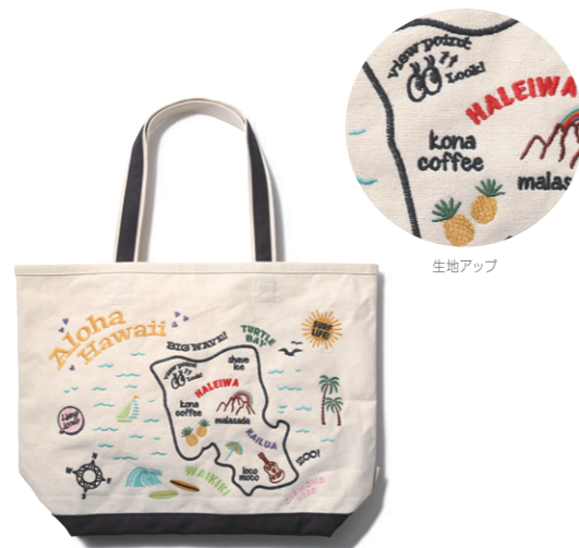
293302 Hawaii JAN : 4980862 293320

サイズ: W45×H32×D15cm 持ち手: 長さ48cm 高さ約22cm 素材: 綿 ポケット: 外側1箇所、内側2箇所 生産国: 中国 小売LOT: 2 / 問屋LOT: 12