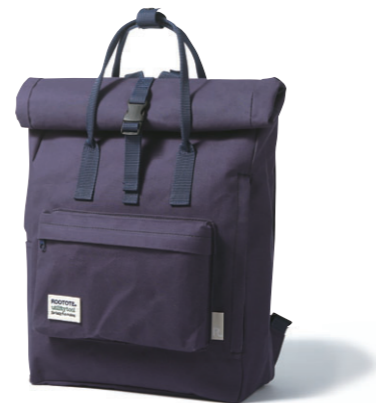
293901 Navy JAN：4980862 293917

サイズ：W31×H54×D13.5cm 持ち手：長さ40cm 高さ約18cm 素材：表地/ポリエステル、ノンフタル酸PVC加工 撥水加工 裏地/ポリエステル 持ち手/ポリプロピレン ポケット：外側3箇所(うちファスナー付2箇所)、内側1箇所 生産国：中国 小売LOT：2/問屋LOT：12