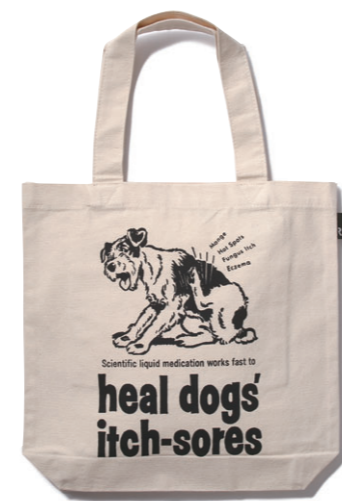
292806 Dog JAN : 4980862 292866

サイズ：W40×H39×D9cm 持ち手：長さ57cm 高さ約27cm 素材：綿 ポケット：外側1箇所、内側2箇所 生産国：インド(プリントは日本) 小売LOT：3/問屋LOT：18