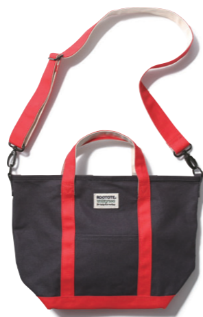
292902 Red JAN : 4980862 292927