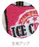
293401 Ice Cream JAN : 4980862 293412