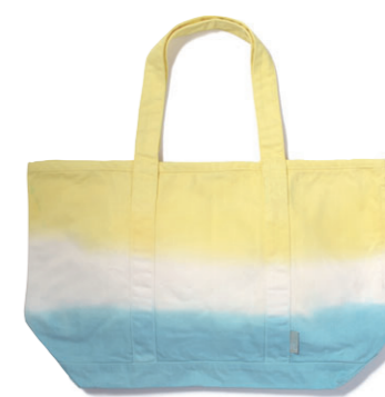
292502 Yellow JAN : 4980862 292521