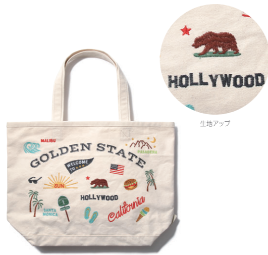
293301 California JAN : 4980862 293313

MEDIUM 2933 ミディアム エンブroidery RT.MED.SC.Embroidery-A 税抜 ¥4,200