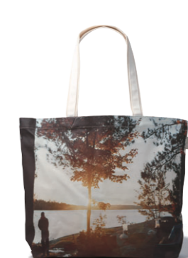
491003 Lake of the Woods JAN: 4980862 491030