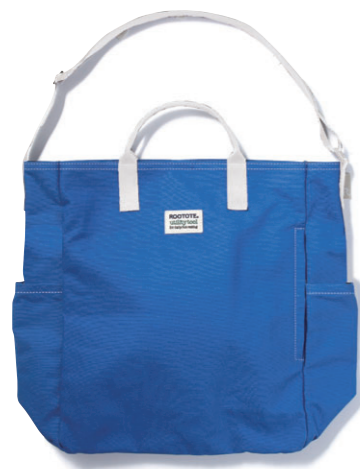
293201 Blue JAN: 4980862 293214

テフロン® コーティングは、他の樹脂コーティングでは得ることのできない、非粘着塗膜を持っています。これにより生地汚れが付きにくくなる特性を実現しました。