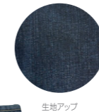
761701 Dark Used JAN : 4980862 761713

ダークでキレイめな仕上がりに 程よいUSED感をプラス。 控えめなストーンウォッシュ加工で アタリを付けた上品な仕上がり。