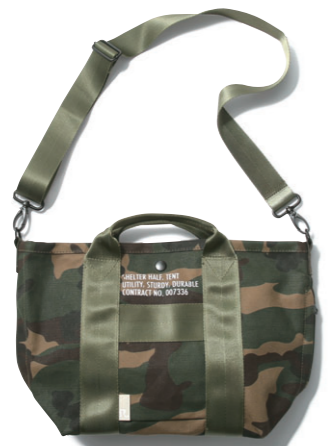
292603 Woodland JAN : 4980862 292637

サイズ：W40×H24×D14cm 持ち手：長さ20cm 高さ約5cm ショルダー：最長110cm 素材：表地/綿 O2のみ撥水加工 持ち手/ポリエステル ドットボタン ポケット：外側2箇所(うちファスナー付1箇所)、内側2箇所、ペンポケット 生産国：中国 小売LOT：2 / 問屋LOT：12