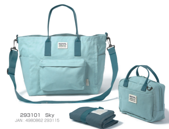
293101 Sky JAN：4980862 293115