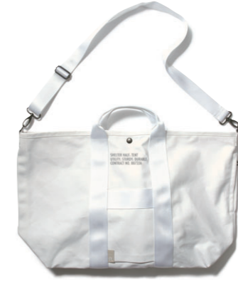
292702 White JAN : 4980862 292729