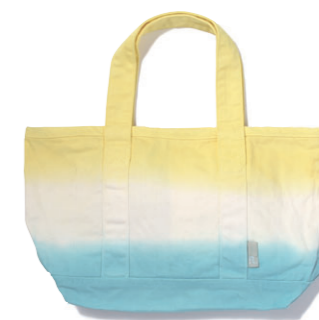
292402 Yellow JAN : 4980862 292422

GRANDE™ 2925 グランデ カラー デニム RT.Grande Color DENIM-G 税抜 ¥6,500