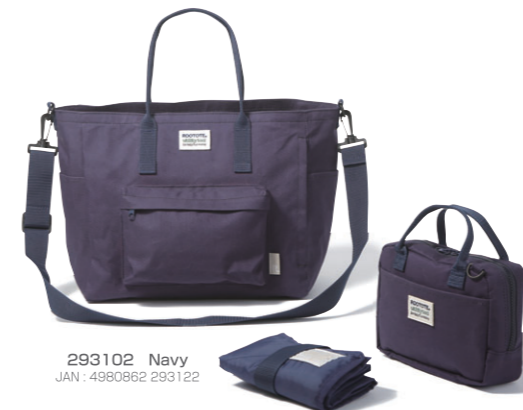
293102 Navy JAN：4980862 293122