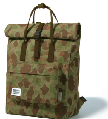
293903 Duck Hunter JAN：4980862 293931