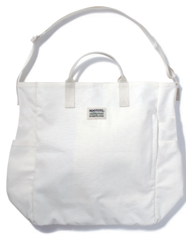
293202 White JAN: 4980862 293221