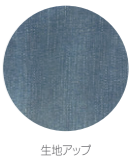
761803 Mid Vintage JAN : 4980862 761836

長年穿き込んだような リアルなヴィンテージ加工。 程よいダメージ加工は 一つ一つ手作業によるもの。