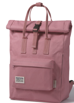
293003 Light Pink JAN : 4980862 293030

サイズ：W27×H50×D12cm 持ち手：長さ38cm 高さ約17cm 素材：表地/ポリエステル、ノンフタル酸PVC加工 撥水加工 裏地/ポリエステル 持ち手/ポリプロピレン ポケット：外側3箇所(うちファスナー付2箇所)、内側1箇所 生産国：中国 小売LOT：2/問屋LOT：12