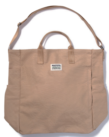
293204 Beige JAN: 4980862 293245