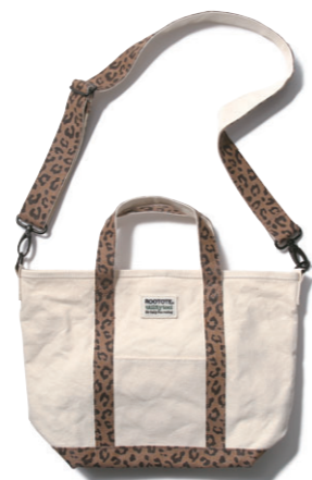
292904 Leo JAN : 4980862 292941