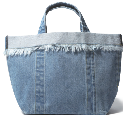
262202 Light Vintage JAN : 4980862 262227