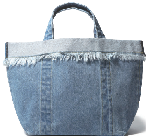
262202 Light Vintage JAN : 4980862 262227