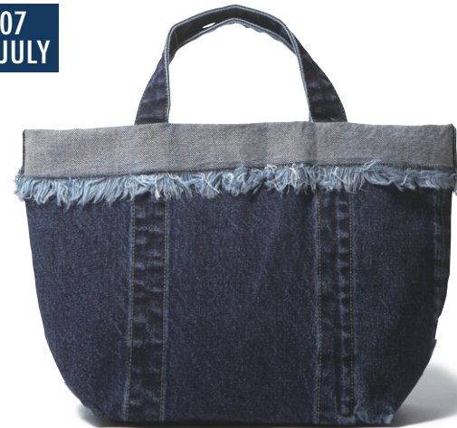
262201 Dark Vintage JAN : 4980862 262210