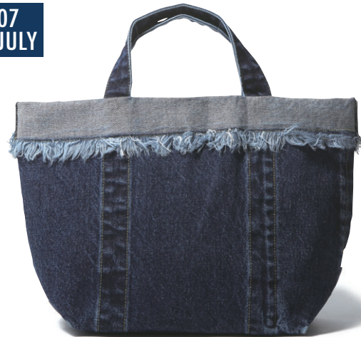
262201 Dark Vintage JAN : 4980862 262210