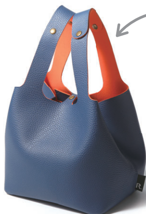
261001 Nvy JAN : 4980862 261015