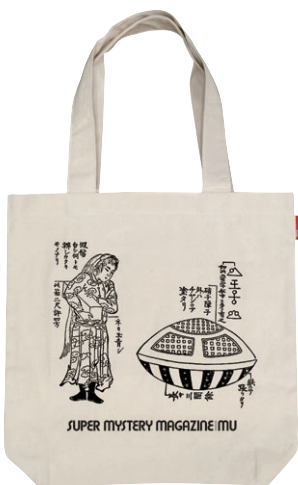
482702 Utsurobune JAN : 4980862 482724