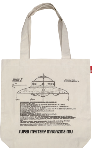
482705 Haunebu JAN : 4980862 482755