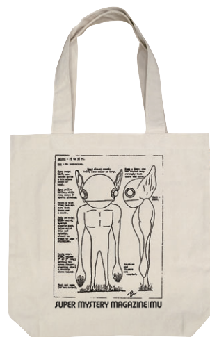
482703 Alien JAN : 4980862 482731