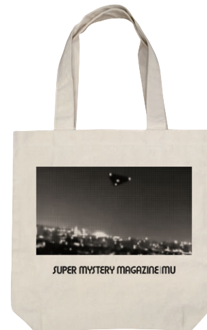
482706 Triangle JAN : 4980862 482762