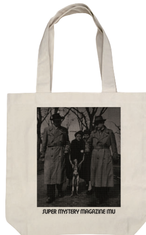
482704 Capture JAN : 4980862 482748