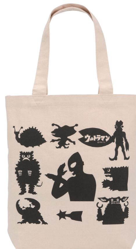
438802 silhouette JAN : 4980862 438820 ※サンプル監修中