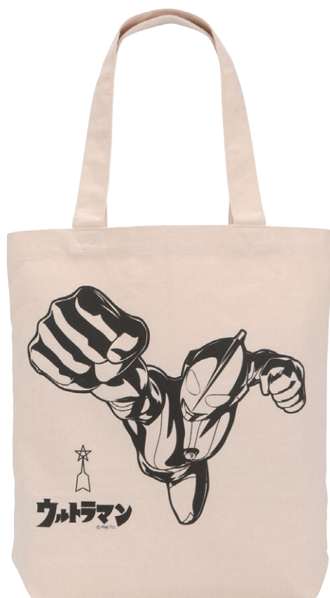
438801 ultraman JAN : 4980862 438813 ※サンプル監修中

サイズ：W39×H40×D9cm 持ち手：長さ56cm 素材：綿 生産国：インド(プリント日本) ポケット：外側1箇所、内側2箇所 小売LOT：3/問屋LOT：18 ▼4388 RT TALL PIJ ウルトラマン-A 税抜 ¥2,800