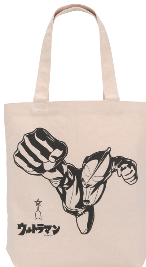
438801 ultraman JAN : 4980862 438813 ※サンプル監修中

サイズ：W39×H40×D9cm 持ち手：長さ56cm 素材：綿 生産国：インド(プリント日本) ポケット：外側1箇所、内側2箇所 小売LOT：3/問屋LOT：18 ▼4388 RT TALL PIJ ウルトラマン-A 税抜 ¥2,800