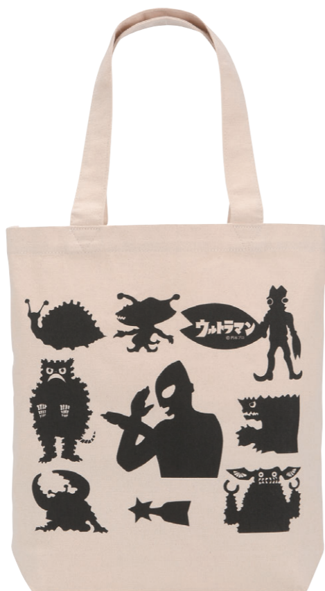
438802 silhouette JAN : 4980862 438820 ※サンプル監修中