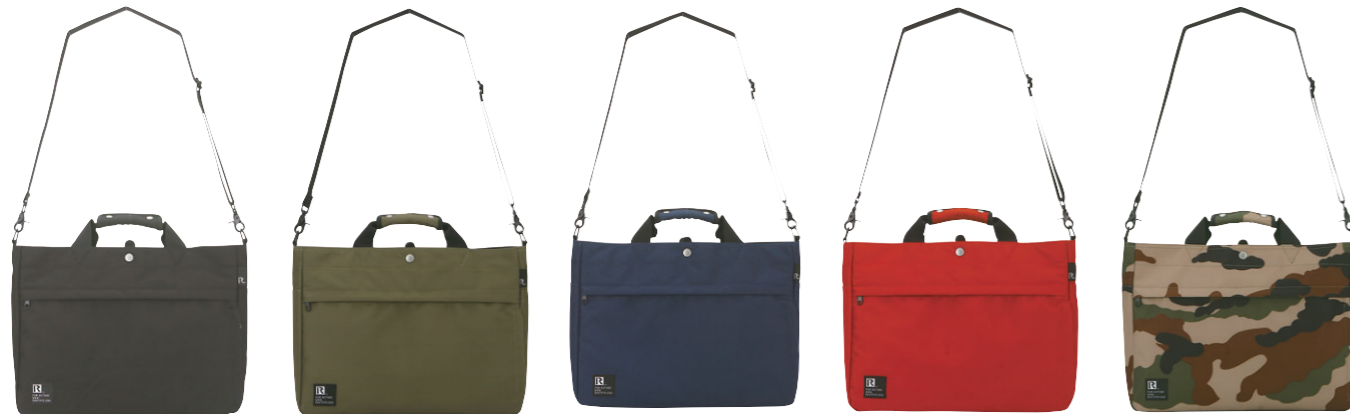
01.BLACK JAN : 4980862 026911

ビジネスに必要なモバイル、書類が収納しやすいイレブんです。11箇所のポケットで荷物を楽に収納できます。持ちやすい基本色を揃えました。本体生地には摩擦、引き裂きに強いCORDURA生地を使い、テフロン加工を施しているため撥水性もあります。