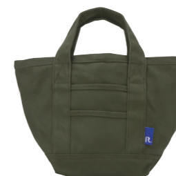
04.KHAKI JAN : 4980862 026447