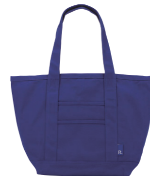
01.ROO BLUE JAN : 4980862 026317

サイズ: W52×H32×D17cm 持ち手: 長さ 57cm 高さ約 24cm 素材: 綿 ドットボタン 生産国: 中国 ポケット: 外側 4 箇所 (うちファスナー付 1 箇所) 内側 1 箇所