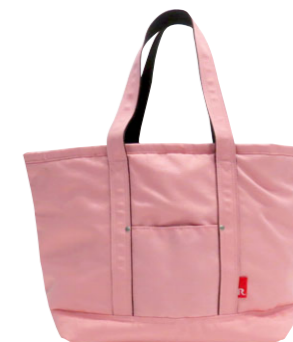
415703 PINK JAN : 4980862 415739