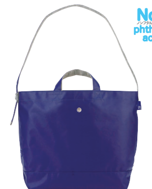
01.ROO BLUE JAN : 4980862 026218

サイズ: W59×H32×D15cm 持ち手: 長さ 22cm 高さ約 10cm ショルダー: 最長 94cm 素材: 表地/ターポリン(ノンフタル酸 PVC) 持ち手/ターポリン(ノンフタル酸 PVC) アクリルテープ ドットボタン 生産国: ベトナム ポケット: 外側ファスナー付 1 箇所 内側 1 箇所