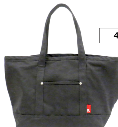
415601 BLACK JAN : 4980862 415616

軽量かつ置いたときに自立しやすい素材を採用。どんなスタイル・シーンにもマッチするシンプルなデザイン。選べるカラーバリエーションも魅力。コラボレーションなど特別なROOTOTEの証、赤のオリジナルタグがポイント。