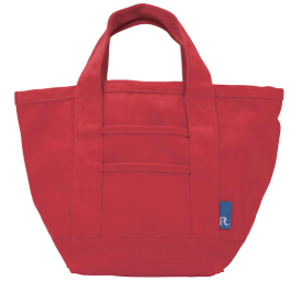
05.RED JAN : 4980862 026454

内側フリポケットには、オリジナルインナーネームが付いています。 (DELI,GRANDE 共通)