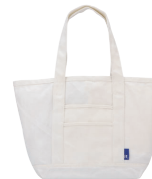
02.NATURAL JAN : 4980862 026324