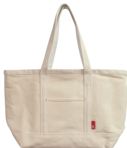
472001 natural JAN : 4980862 472015