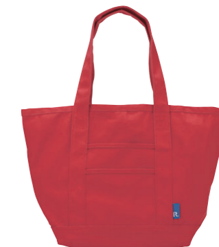
05.RED JAN : 4980862 026355