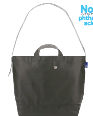
03.BLACK JAN : 4980862 026232