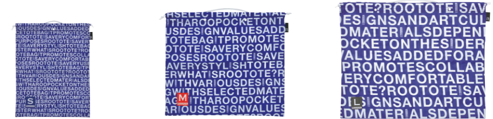
029402 A-SOUP JAN : 4980862 029424

サイズ: S/W31×H39cm M/W41.5×H36.5cm L/W53×H42.5cm 素材: ポリエステル、プラホック、綿ひも 生産国: 中国