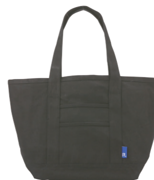
03.BLACK JAN : 4980862 026331

前面のポケットは 2 重になっており、すぐ使うものの収納に便利です。 (DELI,GRANDE 共通)