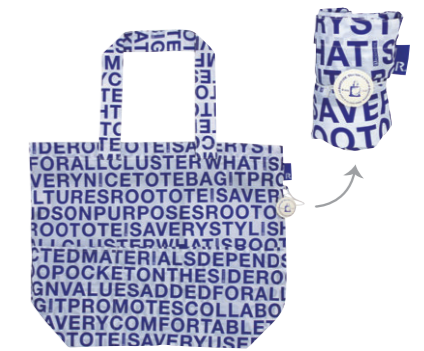
026602 POSI JAN : 4980862 026621