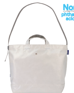
02.WHITE JAN : 4980862 026225