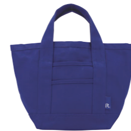
01.ROO BLUE JAN : 4980862 026416

サイズ: W39×H23×D16cm 持ち手: 長さ 30cm 高さ約 12cm 素材: 綿 ドットボタン 生産国: 中国 ポケット: 外側 4 箇所 (うちファスナー付 1 箇所) 内側 1 箇所