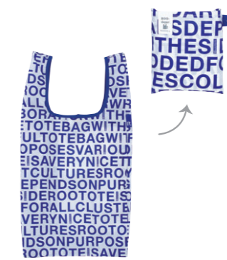
026502 POSI JAN : 4980862 026522