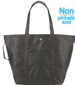
03.BLACK JAN : 4980862 026133