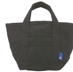
03.BLACK JAN : 4980862 026430