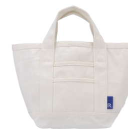
02.NATURAL JAN : 4980862 026423