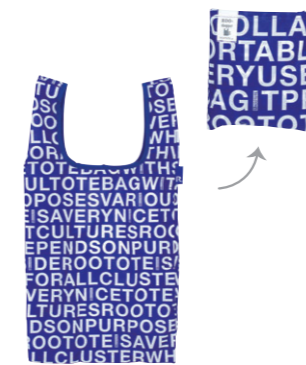
026501 NEGA JAN : 4980862 026515