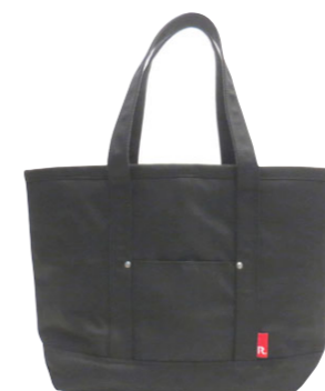
415701 BLACK JAN : 4980862 415715