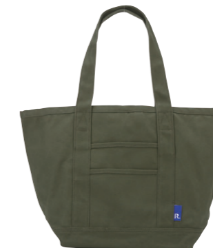
04.KHAKI JAN : 4980862 026348