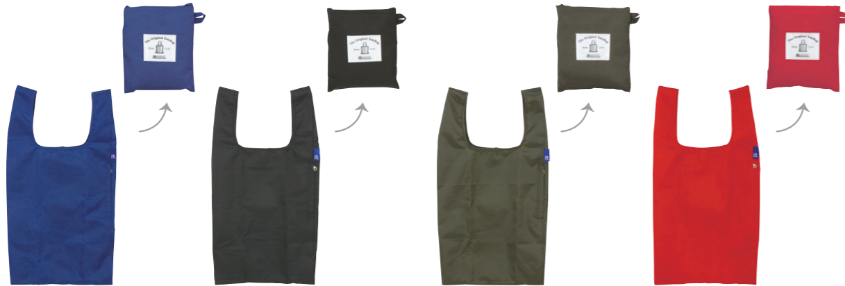
026701 ROOBLUE JAN : 4980862 026713