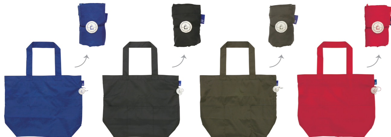
026801 ROOBLUE JAN : 4980862 026812