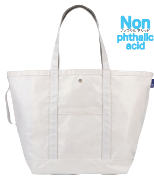
02.WHITE JAN : 4980862 026126