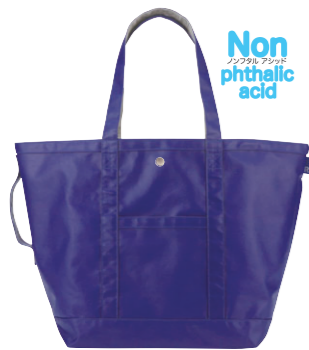
01.ROO BLUE JAN : 4980862 026119

サイズ: W59×H37×D18cm 持ち手: 長さ 58cm 高さ約 25cm 素材: 表地/ターポリン(ノンフタル酸 PVC) 持ち手/ターポリン(ノンフタル酸 PVC) アクリルテープ ドットボタン 生産国: ベトナム ポケット: 外側 2 箇所(うちファスナー付 1 箇所)