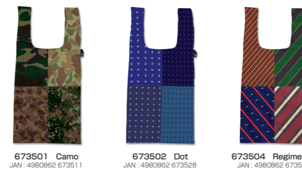
673501 Camo JAN: 4980862 673511 673502 Dot JAN: 4980862 673528 673504 Regimental JAN: 4980862 673542

本体サイズ: W28×H60×D14cm ベルトサイズ: W24×H3cm 本体素材: ポリエステル ポケット: 外側1箇所 生産国: 中国 小売Lot 3 / 問屋Lot 18 6735 RS REGULAR Pocket 税抜 ¥2,800