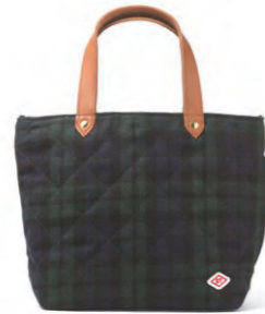
334302 Black watch JAN: 4980862 334320