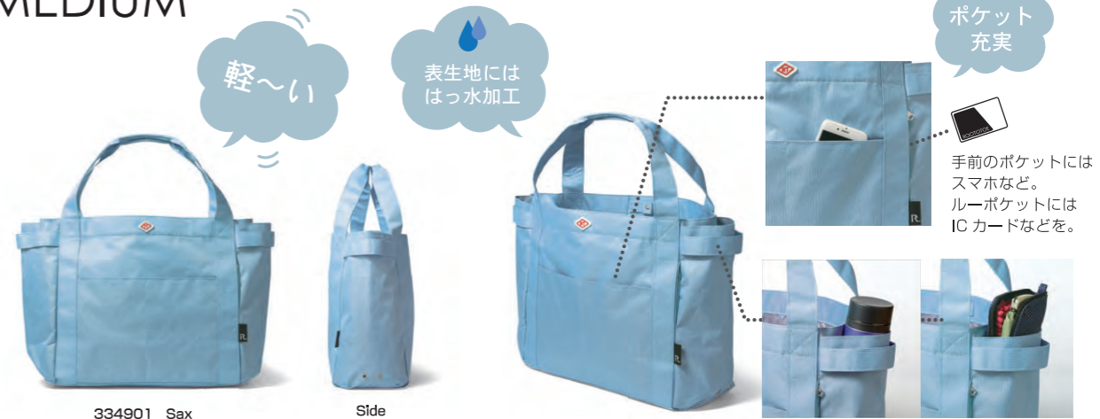
334901 Sax JAN: 4980862 334917