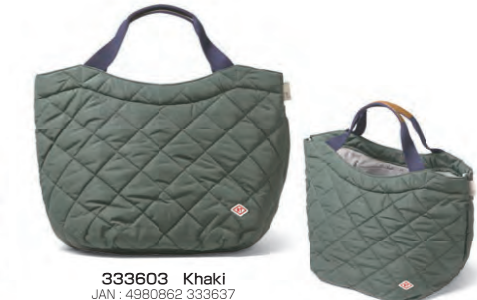
333603 Khaki JAN: 4980862 333637