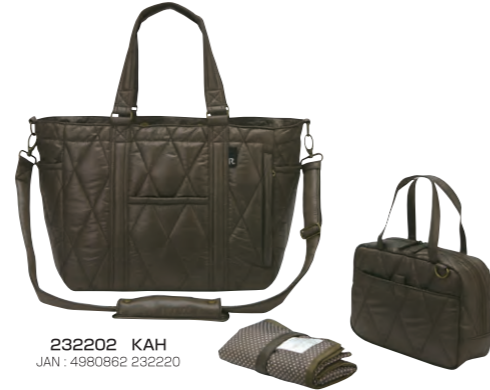
232202 KAH JAN: 4980862 232220