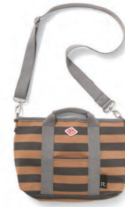
333401 BEG/GRY JAN: 4980862 333415