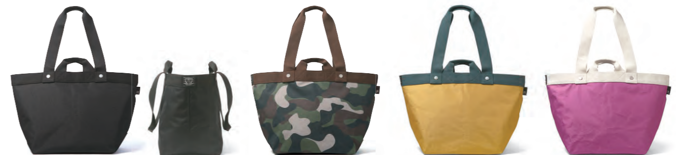
333901 Black JAN: 4980862 333910