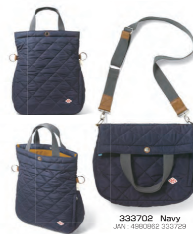
333702 Navy JAN: 4980862 333729