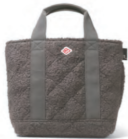
334401 Gray JAN: 4980862 334412