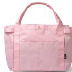
334902 Pink JAN: 4980862 334924