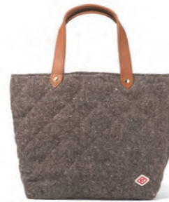
334303 Tubu brown JAN: 4980862 334337

サイズ: W36.5×H26×D12cm 持ち手: 長さ37cm 素材: 表地/表地/O1.ポリエステル、毛 O2.レーヨン、毛、ポリエステル O3.毛、レーヨン 裏地/ポリエステル、綿 マグネットホック ポケット: 外側ファスナー付1箇所、内側3箇所 生産国: インドネシア 小売LOT: 3/問屋LOT: 18