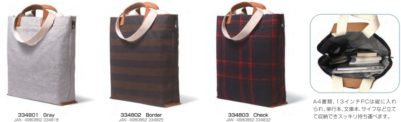
334801 Gray JAN: 4980862 334818