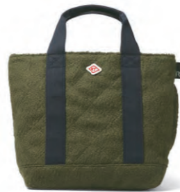
334402 Khaki JAN: 4980862 334429