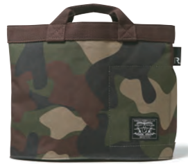
334102 Camo JAN: 4980862 334122