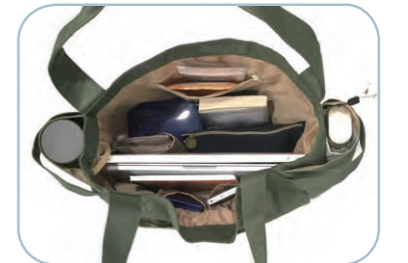
A4書類、13インチPCは横に、ポーチ、単行本、スリム型ランチBOXなどらくらく入ります。