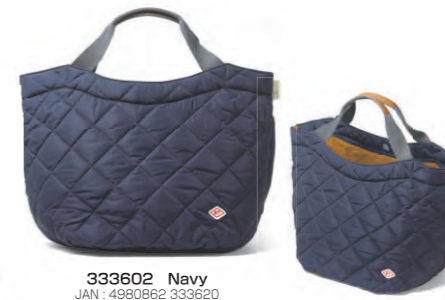
333602 Navy JAN: 4980862 333620