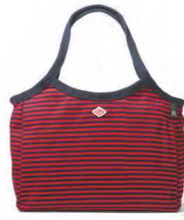
333302 RED/NVY JAN: 4980862 333323