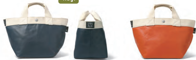
260308 Nvy/Ivo JAN: 4980862 260384