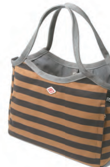
333301 BEG/GRY JAN: 4980862 333316