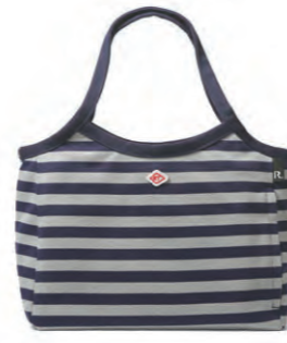
333303 GRY/NVY JAN: 4980862 333330