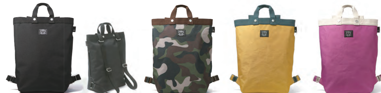
334001 Black JAN: 4980862 334016