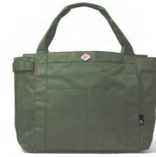
334903 Khaki JAN: 4980862 334931