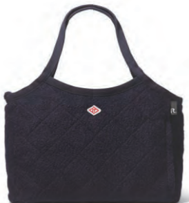
334503 Navy JAN: 4980862 334535