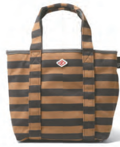
333001 BEG/GRY JAN: 4980862 333019