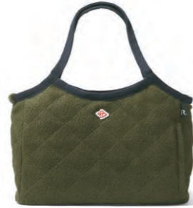
334502 Khaki JAN: 4980862 334528