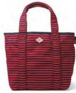
333002 RED/NVY JAN: 4980862 333026