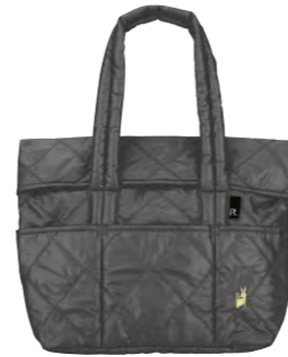
216601 Charcoal JAN: 4980862 216619