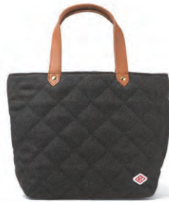
334301 Gray JAN: 4980862 334313