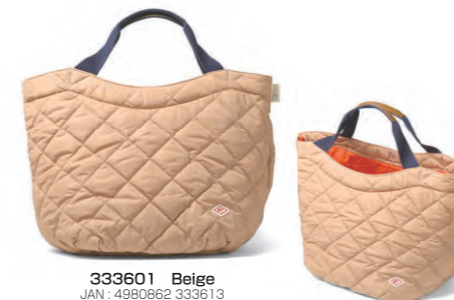
333601 Beige JAN: 4980862 333613