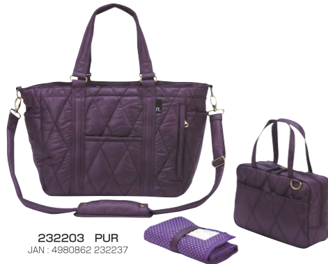
232203 PUR JAN: 4980862 232237

マミールー ベーシック Item: 2322 MR SN BASIC-B Price: 税抜 ¥7,800