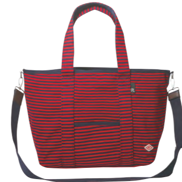
333202 RED/NVY JAN: 4980862 333224