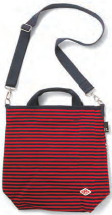
333102 RED/NVY JAN: 4980862 333125