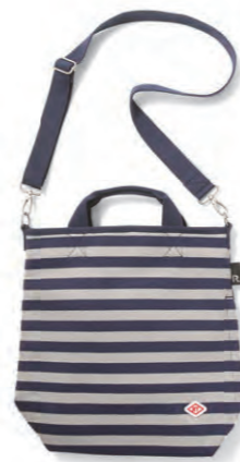
333103 GRY/NVY JAN: 4980862 333132