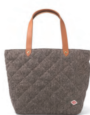
334203 Tubu brown JAN: 4980862 334238

サイズ: W44×H30×D15cm 持ち手: 長さ37cm 素材: 表地/O1.ポリエステル、毛 O2.レーヨン、毛、ポリエステル O3.毛、レーヨン 裏地/ポリエステル、綿 マグネットホック ポケット: 外側ファスナー付1箇所、内側3箇所 生産国: インドネシア 小売LOT: 2/問屋LOT: 12