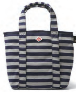
333003 GRY/NVY JAN: 4980862 333033