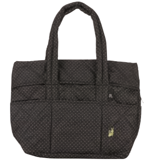
216604 B-Dot JAN: 4980862 216640

フーディー Item: 2166 RT Hoodie ROO-D Price: 税抜 ¥3,800