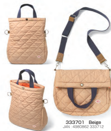
333701 Beige JAN: 4980862 333712