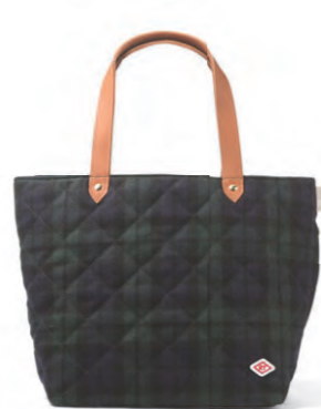
334202 Black watch JAN: 4980862 334221