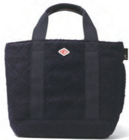
334403 Navy JAN: 4980862 334436