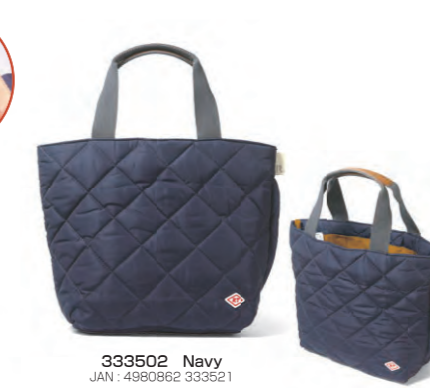
333502 Navy JAN: 4980862 333521