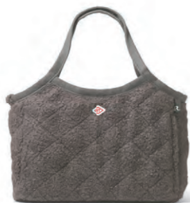
334501 Gray JAN: 4980862 334511