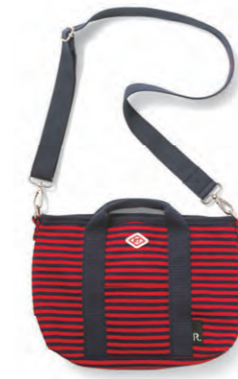
333402 RED/NVY JAN: 4980862 333422