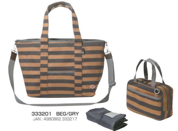
333201 BEG/GRY JAN: 4980862 333217

Item: 3332 SN.マミールー.ボーダー-A Price: 税抜 ¥6,500