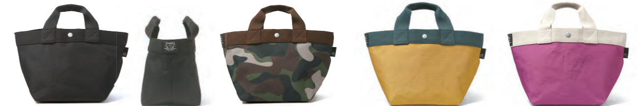
333801 Black JAN: 4980862 333811