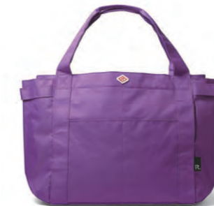
334905 Purple JAN: 4980862 334955