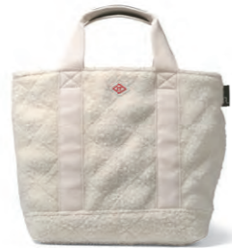
334404 Ivory JAN: 4980862 334443