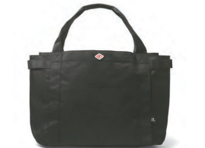
334906 Black JAN: 4980862 334962

7 Jul. Item: 3349 SN. ミディアム. ポケッツ-A Price: 税抜 ¥3,500