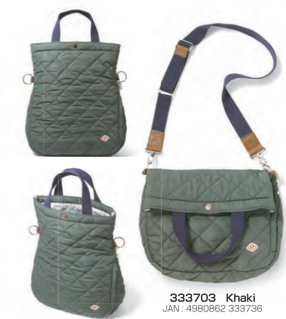
333703 Khaki JAN: 4980862 333736