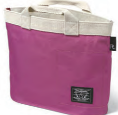
334104 Purple JAN: 4980862 334146

サイズ: W29×H22×D9cm 持ち手: 長さ15.5cm 素材: 表地/ポリエステル、PVB加工 持ち手/ポリエステル ポケット: 外側ファスナー付1箇所、内側5箇所(うちファスナー付1箇所)、ホルダー2箇所 生産国: ベトナム 小売LOT: 2/問屋LOT: 12