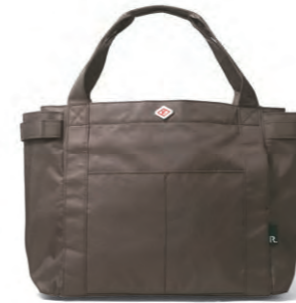
334904 Brown JAN: 4980862 334948