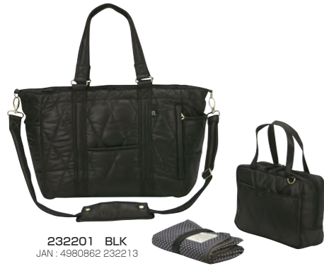
232201 BLK JAN: 4980862 232213