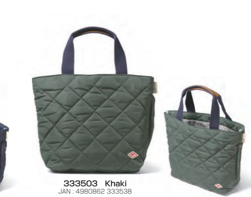
333503 Khaki JAN: 4980862 333538