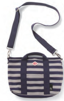
333403 GRY/NVY JAN: 4980862 333439