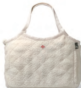
334504 Ivory JAN: 4980862 334542