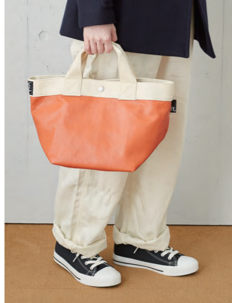
260309 Orange JAN: 4980862 260391

08 Simply natural 2017 A/W Collection vol.52