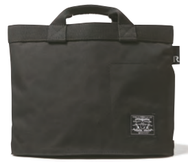
334101 Black JAN: 4980862 334115

バッグインバッグとしても ちょっとそこまでのお出掛けトートとしても 厚手生地と隠しマチで外出先でも自立し、 カフェなどでも邪魔になりません。 天ファスナーポケットにはiPad miniなど タブレットがスッキリ収納できます。