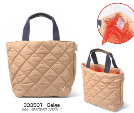
333501 Beige JAN: 4980862 333514