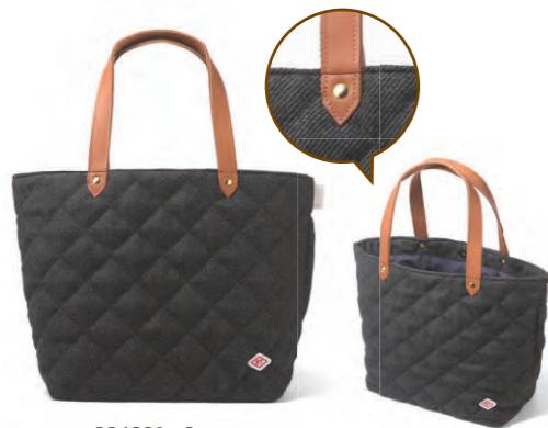
334201 Gray JAN: 4980862 334214