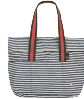
216603 Marine JAN: 4980862 216633