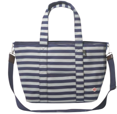
333203 GRY/NVY JAN: 4980862 333231