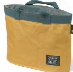
334103 Mustard JAN: 4980862 334139