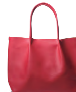
223108 RED JAN: 4980862 223181