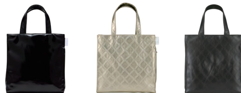
232301 enamel-blk JAN: 4980862 232312

サイズ: W44×H32×D14.5cm 持ち手: 長さ 50cm 素材: 表地 / 合成皮革 持ち手 / 合成皮革 ポーチ / ポリエステル、ドットボタン ポケット: 外側 1 箇所、内側 1 箇所 ポーチ付 生産国: 中国 小売 LOT: 2 / 問屋 LOT: 12