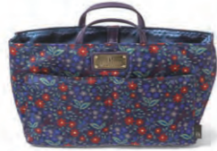
258107 Flower-Navy JAN : 4980862 258176