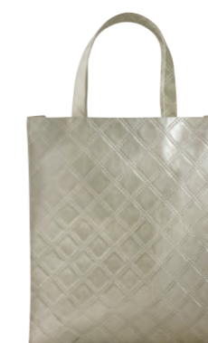
232402 quilting-w-GLD JAN: 4980862 232428