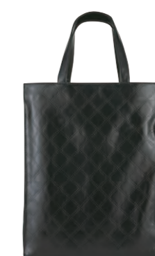
232403 Quilt-BLK JAN: 4980862 232435