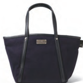
335601 Navy JAN：4980862 335617