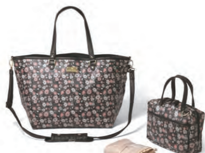
336402 Blk-Flower JAN: 4980862 336423