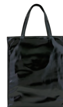
232401 enamel-blk JAN: 4980862 232411

サイズ: W28.5×H35×D9cm 持ち手: 長さ 37cm 素材: 表地 / 合成皮革 裏地 / ポリエステル 持ち手 / 合成皮革 底板 / ベルポーレン マグネットホック ポケット: 外側ファスナー付き 1 箇所、内側 1 箇所 生産国: 中国 小売 LOT: 3 / 問屋 LOT: 18