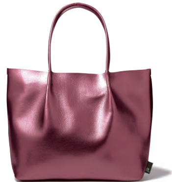
291205 Metallic-PUR JAN : 4980862 291258