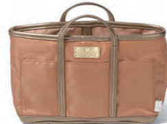
258206 GOLD JAN : 4980862 258268