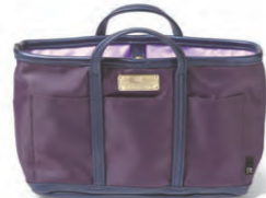
258205 PURPLE JAN : 4980862 258251

サイズ : W25×H16×D7cm 持ち手 : 長さ 13cm 素 材 : 表地 / ポリエステル 裏地 / ポリエステル 持ち手 / 合成皮革 ドットボタン ポケット : 外側 7 箇所(うちファスナー付 1 箇所)、 内側 6 箇所、その他ホルダー 3 箇所 生産国 : 中国 小売 LOT : 2 / 問屋 LOT : 12