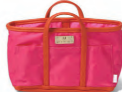
258207 PINK JAN : 4980862 258275