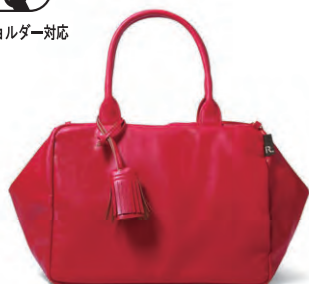
336501 Red JAN: 4980862 336515