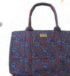
257507 Flower-Navy JAN：4980862 257575