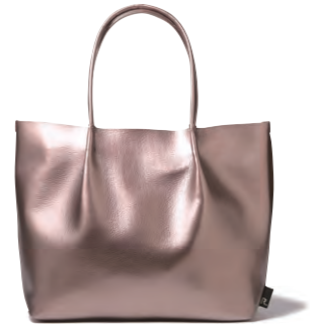
291203 Bronze JAN: 4980862 291234