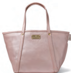
335602 Rose JAN：4980862 335624