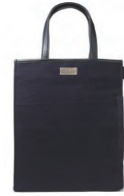
335701 Navy JAN：4980862 335716

サイズ：W28.5×H35×D9cm 持ち手：長さ 37cm 素材：表地 /01, 毛, ポリエステル, その他 02, 合成皮革 裏地 / ポリエステル 持ち手 / 合成皮革 底板 / ベルボーレン、マグネットホック ポケット：外側ファスナー付 1 箇所、内側 1 箇所 生産国：中国 小売 LOT：3 / 問屋 LOT：18