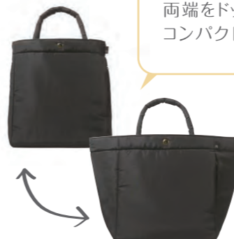
336901 Black JAN: 4980862 336911