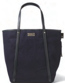
335501 Navy JAN：4980862 335518

サイズ：W42×H32×D17cm 持ち手：長さ 43cm 素材：表地 /01, 毛, ポリエステル, その他 02, 合成皮革 裏地 / ポリエステル 持ち手 / 合成皮革 底板 / ベルボーレン、マグネットホック ポケット：外側ファスナー付 1 箇所、 内側 3 箇所(うちファスナー付 1 箇所) 生産国：中国 小売 LOT：2 / 問屋 LOT：12