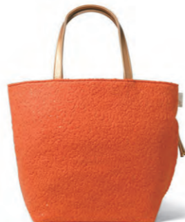
276005 ORG JAN : 4980862 276057