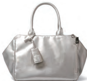
336502 Silver JAN: 4980862 336522