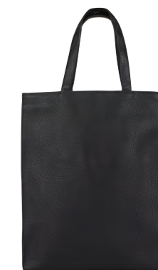
232404 sibo-blk JAN: 4980862 232442