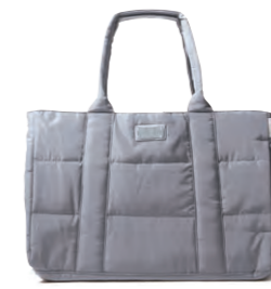
257506 Silver JAN：4980862 257568