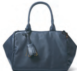
336503 Navy JAN: 4980862 336539