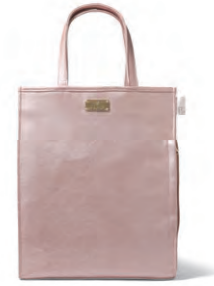
335702 Rose JAN：4980862 335723