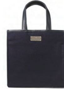
335801 Navy JAN：4980862 335815

サイズ：W24×H24×D10.5cm 持ち手：長さ 31cm 素材：表地 /01, 毛, ポリエステル, その他 02, 合成皮革 裏地 / ポリエステル 持ち手 / 合成皮革 底板 / ベルボーレン、マグネットホック ポケット：外側ファスナー付 1 箇所、内側 1 箇所 生産国：中国 小売 LOT：3 / 問屋 LOT：18