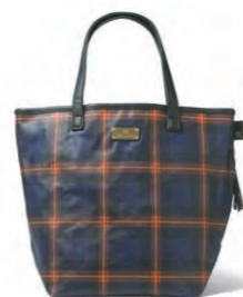
336301 Nvy-Check JAN: 4980862 336317