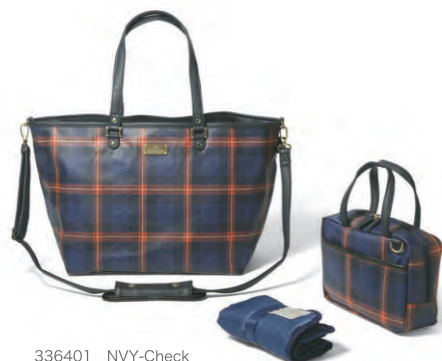
336401 Nvy-Check JAN: 4980862 336416

【トートバッグ】 サイズ: W55×H30×D20cm 持ち手: 長さ 52cm ショルダ: 長さ 120cm 素材: 表地/綿、ノンフタル酸PVCラミネート加工 裏地/ポリエステル マグネットホック ポケット: 外側ファスナー付1箇所、内側6箇所(うちファスナー付1箇所) 【ポーチ】 サイズ: W21×H15×D8cm 持ち手: 長さ 30cm 素材: 表地/綿、ノンフタル酸PVCラミネート加工 裏地/ポリエステル ポケット: 外側1箇所、内側1箇所 【オムツ替えシート】 サイズ: W45×H68cm 素材: シート部分 ポリエステル 生産国: ベトナム 小売LOT: 2 / 問屋LOT: 12