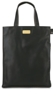
274802 Ami-blk JAN：4980862 274824

サイズ：W28.5×H35×D9cm 持ち手：長さ 37cm 素材：表地 / 合成皮革 裏地 / ポリエステル 持ち手 / 合成皮革 底板 / ベルボーレン、マグネットホック ポケット：外側ファスナー付 1 箇所、内側 1 箇所 生産国：中国 小売 LOT：3 / 問屋 LOT：18