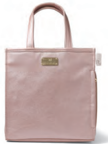
335802 Rose JAN：4980862 335822