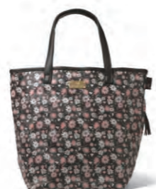
336302 Blk-Flower JAN: 4980862 336324

赤ちゃんとお出かけを少しでも快適に!楽しく! という思いから「マミールー」は生まれました。