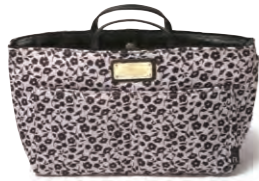
258103 Flower JAN : 4980862 258138