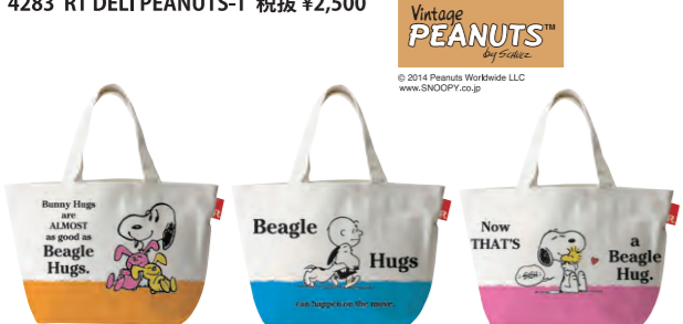
428301 Bunny JAN: 4980862 428319 428302 SN&CB JAN: 4980862 428326 428303 SN&WS JAN: 4980862 428333