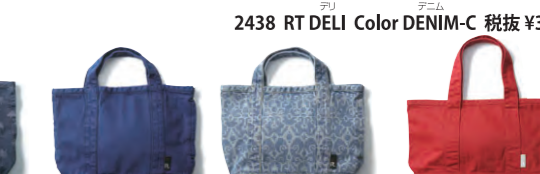
243601 Overdye JAN: 4980862 243615 243602 Historical JAN: 4980862 243622 243802 Tomato JAN: 4980862 243820