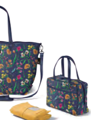
255201 CHECK JAN: 4980862 255212