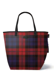
255202 FLOWER JAN: 4980862 255229