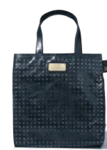
289402 Hole-NVY JAN: 4980862 289422

サイズ: W24×H24×D10.5cm 持ち手: 長さ31cm 素材: 表地/O2, 合成皮革 /O3, 綿, レーヨン 裏地/ポリエステル 持ち手/合成皮革 底板/ベルボレーン, マグネットホック ポケット: 外側ファスナー付1箇所, 内側1箇所 生産国: 中国 小売LOT: 3 / 間屋LOT: 18 2894 RT.Square.Lustre-0H 税抜 ¥2,800