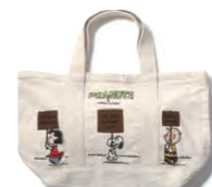
492601 Party JAN: 4980862 492617