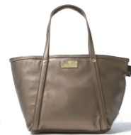
256102 Bronze JAN: 4980862 256127