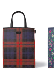
255302 FLOWER JAN: 4980862 255328