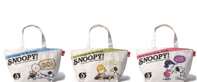
431201 GO! JAN: 4980862 431210 431202 MUSIC JAN: 4980862 431227 431203 DANCE JAN: 4980862 431234

サイズ: W40×H39×D10cm 持ち手: 長さ52cm 高さ20cm 素材: 綿 ポケット: 外側ファスナー付1箇所、内側1箇所 生産国: 中国 小売LOT: 2 / 問屋LOT: 12