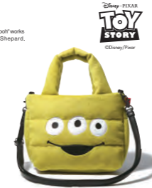
438103 Alien JAN: 4980862 438134