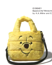
438102 Pooh JAN: 4980862 438127

サイズ: W27×H18×D8cm 持ち手: 長さ30cm ショルダー: 長さ最長120cm 素材: 表地 持ち手/O2, O5, O6, ポリエステル, O3, O4, ポリエステル, レーヨン 裏地/ポリエステル 本体 中わた/ダウン, フェザー ポケット: 外側ファスナー付1箇所(入り口2箇所), 内側1箇所 生産国: 中国 4381 BR.Disney-P 税抜 ¥3,800