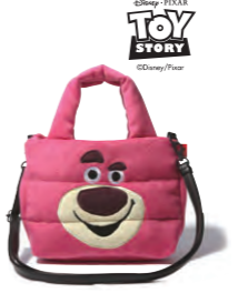
438104 Lotso JAN: 4980862 438141