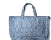
243502 Historical JAN: 4980862 243523

サイズ: W56×H34×D17cm 持ち手: 長さ54cm 高さ約24cm 素材: 綿 ポケット: 外側1箇所、内側2箇所 生産国: 中国 小売LOT: 2 / 問屋LOT: 12