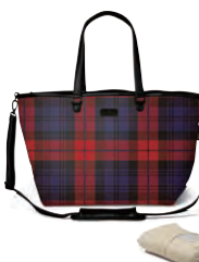
255101 CHECK JAN: 4980862 255113

【トートバッグ】サイズ: W55×H30×D20cm 持ち手: 長さ52cm ショルダー: 長さ最長120cm 素材: 表地/綿, ノンフタル酸PVCラミネート加工 裏地/ポリエステル 持ち手/合成皮革 マグネットホック ポケット: 外側ファスナー付1箇所, 内側6箇所(うちファスナー付1箇所) 【ポーチサイズ】サイズ: W21×H15×D8cm 持ち手: 長さ30cm 素材: 表地/綿 ノンフタル酸PVCラミネート加工 裏地/ポリエステル ポケット: 外側1箇所, 内側1箇所 【オムツ替えシート】サイズ: W45×H68cm 素材: シート部分 ポリエステル 生産国: ベトナム 小売LOT: 2 / 間屋LOT: 12 2551 MR.REG.LT.Shibo-Lami-E 税抜 ¥6,500