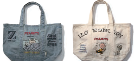
431501 Dream JAN: 4980862 431517 431502 Snoopy JAN: 4980862 431524

サイズ: W41×H24×D12cm 持ち手: 長さ40cm 高さ約18cm 素材: 綿 ポケット: 外側1箇所、内側2箇所 生産国: 中国 小売LOT: 2 / 問屋LOT: 12