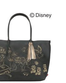
434003 Alice JAN: 4980862 434037

サイズ: W42×H28.5×D14cm 持ち手: 長さ43cm 高さ約18cm 素材: 表地/合成皮革 裏地/ポリエステル 持ち手/合成皮革 底板/ベルボレーン マグネットホック ポケット: 外側ファスナー付1箇所, 内側3箇所(うちファスナー付1箇所) 生産国: 中国 小売LOT: 2 / 間屋LOT: 12 4813 RT.MED.Otona Disney-T 税抜 ¥4,500