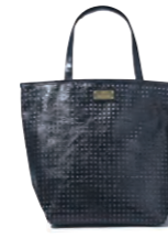
289202 Hole-NVY JAN: 4980862 289224

サイズ: W42×H32×D17cm 持ち手: 長さ43cm 素材: 表地/O2, 合成皮革 /O3, 綿, レーヨン 裏地/ポリエステル 持ち手/合成皮革 底板/ベルボレーン, マグネットホック ポケット: 外側ファスナー付1箇所, 内側3箇所(うちファスナー付1箇所) 生産国: 中国 小売LOT: 2 / 間屋LOT: 12 2892 RT.Medium.Lustre-0H 税抜 ¥3,200