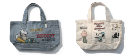
431401 Linus JAN: 4980862 431418 431402 Night JAN: 4980862 431425