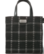
255901 Check-blk JAN: 4980862 255915