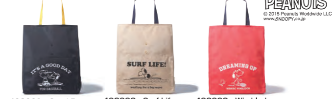
493001 Good Day JAN: 4980862 493010 493002 Surf Life JAN: 4980862 493027 493003 Wimbledon JAN: 4980862 493034