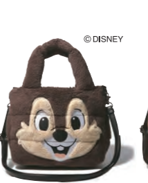
438105 Chip JAN: 4980862 438158