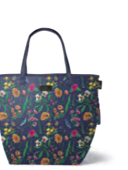
255301 CHECK JAN: 4980862 255311