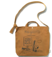
492402 Surf JAN: 4980862 492426

サイズ: W41×H24×D12cm 持ち手: 長さ40cm 高さ約18cm 素材: 綿 ポケット: 外側1箇所、内側2箇所 生産国: 中国 小売LOT: 2 / 問屋LOT: 12