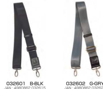
032601 B-BLK JAN：4980862 032615

サイズ：W3.8cm、最長時120cm(テブ部分のみ) 素材：ナイロンテブ、本革 生産国：中国 小売LOT：3/問屋LOT：18 0326 OP. STRAP NY38-A 税抜 ¥1,200