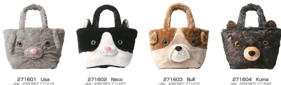
271601 Usa JAN：4980862 271618

サイズ：W39×H21×D17.5cm 持ち手：長さ41.5cm 素材：表地/ポリエステル 裏地/ポリエステル マグネットホック ポケット：外側ファスナー付1箇所、内側3箇所(うちファスナー付1箇所) 生産国：中国 小売LOT：3/問屋LOT：18 2716 RT DELI SN Fur Animal-C 税抜 ¥3,500