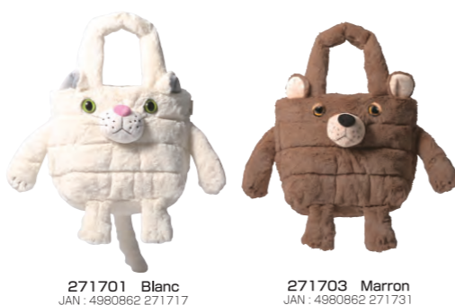
271701 Blanc JAN：4980862 271717

サイズ：W33×H24×D17cm 持ち手：長さ40cm 素材：表地/ポリエステル 裏地/ポリエステル 本体中わた/ダウン、フェザー ポケット：外側ファスナー付1箇所(入り口2箇所)、内側2箇所 生産国：中国 小売LOT：2/問屋LOT：12 2717 FE DELI SN Animal-A 税抜 ¥4,800