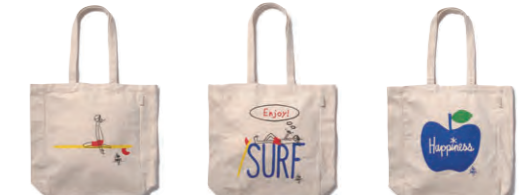
492901 Paddle JAN: 4980862 492914 492902 Surf JAN: 4980862 492921 492903 Apple JAN: 4980862 492938

4929 RT TALL SC Palm Graphics-A 税抜 ¥3,800