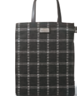
255801 Check-blk JAN: 4980862 255816