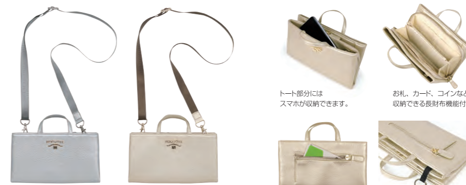
(シボメタリック合皮)