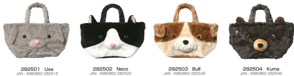
282501 Usa JAN：4980862 282515

サイズ：W27×H17×D7cm 持ち手：長さ22cm ショルダー：長さ最長130cm 素材：表地/ポリエステル 裏地/ポリエステル マグネットホック ポケット：外側ファスナー付1箇所、内側1箇所 生産国：中国 小売LOT：3/問屋LOT：18 2825 BR SN Fur Animal-C 税抜 ¥3,200