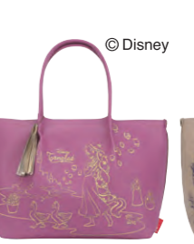
434001 Tangled JAN: 4980862 434013

サイズ: W42×H25×D17cm 持ち手: 長さ42cm 高さ約17cm 素材: 表地/合成皮革 持ち手/合成皮革 ポーチ/ポリエステル 生産国: 中国 ポケット: 外側1箇所, 内側1箇所, ポーチ付 小売LOT: 2 / 間屋LOT: 12 4340 RT.DELI.Otona Disney-Z 税抜 ¥4,800