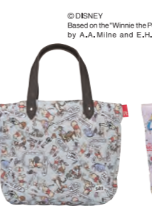
480602 Pooh JAN: 4980862 480621