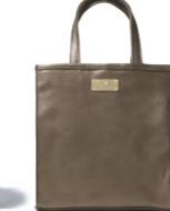
255902 Bronze JAN: 4980862 255922