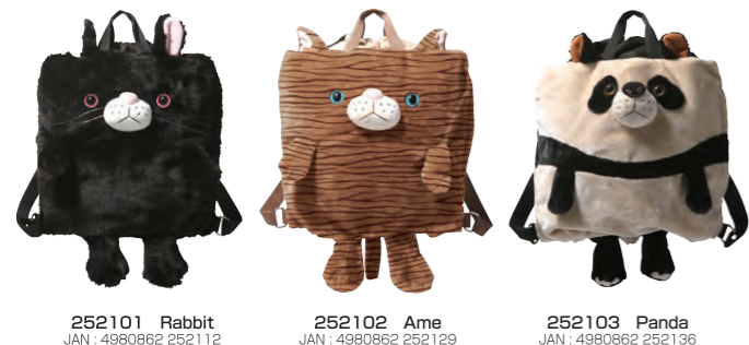
252101 Rabbit JAN：4980862 252112

サイズ：W32×H30×D8.5cm 持ち手：長さ19cm ショルダー：最長95cm 素材：表地/ポリエステル 裏地/ポリエステル ドットボタン ポケット：外側ファスナー付1箇所、内側ファスナー付1箇所 生産国：中国 小売LOT：2/問屋LOT：12 2521 RT 2way SN Fur Animal-D 税抜 ¥4,200