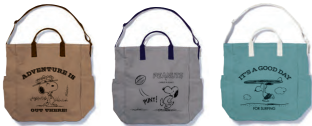
434901 Adventure JAN: 4980862 434914 434902 Kick JAN: 4980862 434921 434903 Surf JAN: 4980862 434938