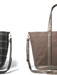
256002 Bronze JAN: 4980862 256028