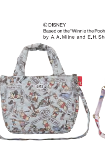
480802 Pooh JAN: 4980862 480829