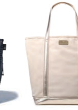
289203 Hanp-gold JAN: 4980862 289231