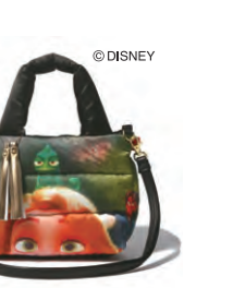
438108 Tangled JAN: 4980862 438189

サイズ: W36.5×H26×D12cm 持ち手: 長さ37cm 高さ約15cm 素材: 表地/ポリエステル 裏地/ポリエステル 持ち手/本革, ポリエステル 生産国: 中国 ポケット: 外側ファスナー付1箇所, 内側3箇所 小売LOT: 2 / 間屋LOT: 12 4806 RT.DELI.Otona Disney-P 税抜 ¥4,200