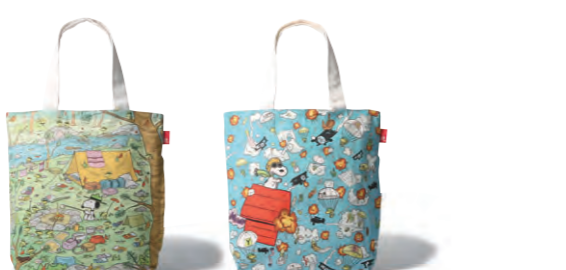
431101 Beagle Scout JAN: 4980862 431111 431102 Flying Ace JAN: 4980862 431128