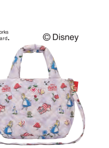
480803 Alice JAN: 4980862 480836

サイズ: W46×H33×D23cm 持ち手: 長さ37cm 高さ約16cm 素材: 表地/ポリエステル 裏地/ポリエステル 持ち手/ポリエステル マグネット 生産国: 中国 ポケット: 外側ファスナー付1箇所, 内側3箇所(うちファスナー付1箇所) 小売LOT: 2 / 間屋LOT: 12 4807 RT.ROUND Otona Disney-P 税抜 ¥4,800