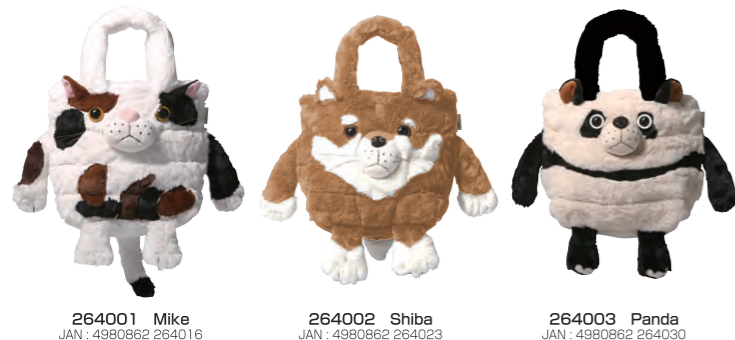
264001 Mike JAN：4980862 264016

サイズ：W33×H24×D17cm 持ち手：長さ40cm 素材：表地/ポリエステル 裏地/ポリエステル 中わた/ポリエステル ポケット：外側ファスナー付1箇所(入り口2箇所)、内側2箇所 生産国：中国 小売LOT：2/問屋LOT：12 2640 RT DELI SN ZOO-A 税抜 ¥4,800