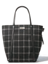
255701 Check-blk JAN: 4980862 255717

サイズ: W42×H32×D17cm 持ち手: 長さ43cm 素材: 表地/O1, ポリエステル, レーヨン, その他 O2, 合成皮革 裏地/ポリエステル 持ち手/合成皮革 底板/ベルボレーン マグネットホック ポケット: 外側ファスナー付1箇所 内側3箇所(うちファスナー付1箇所) 生産国: 中国 小売LOT: 2 / 間屋LOT: 12 2557 RT.MED.Lustre-0L 税抜 ¥3,500