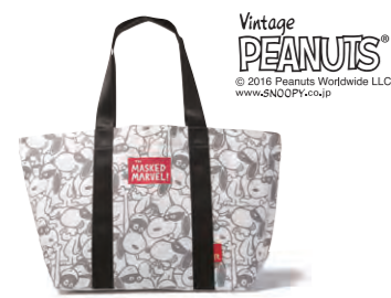
492302 Black JAN: 4980862 492327

サイズ: W40×H32×D7cm 持ち手: 20cm ショルダー: 全長115cm 素材: 綿 ドットボタン ポケット: 外側1箇所、内側2箇所 生産国: 中国 小売LOT: 2 / 問屋LOT: 12