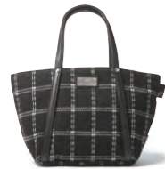
256101 Check-blk JAN: 4980862 256110

サイズ: W24×H24×D10.5cm 持ち手: 長さ31cm 素材: 表地/O1, ポリエステル, レーヨン, その他 裏地/合成皮革 マグネットホック ポケット: 外側ファスナー付1箇所, 内側1箇所 生産国: 中国 小売LOT: 3 / 間屋LOT: 18 2559 RT.SQUARE.Lustre-0L 税抜 ¥3,000