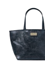
289602 Hole-NVY JAN: 4980862 289620

サイズ: W39×H21×D17.5cm 持ち手: 長さ37.5cm 素材: 表地/O2, 合成皮革 /O3, 綿, レーヨン 裏地/ポリエステル 持ち手/合成皮革, マグネットホック ポケット: 外側ファスナー付1箇所, 内側3箇所(うちファスナー付1箇所) 生産国: 中国 小売LOT: 3 / 間屋LOT: 18 2896 RT.DELI.Lustre-0H 税抜 ¥2,800