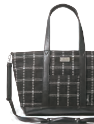
256001 Check-blk JAN: 4980862 256011

サイズ: W55×H30×D20cm 持ち手: 長さ52.5cm ショルダー: 長さ最長120cm 素材: 表地/O1, ポリエステル, レーヨン, その他 O2, ポリエステル 裏地/ポリエステル 持ち手/合成皮革 マグネットホック ポケット: 外側2箇所(うちファスナー付1箇所), 内側4箇所(うちファスナー付1箇所) 生産国: 中国 小売LOT: 2 / 間屋LOT: 12 2560 RT.Grande.Lustre-0L 税抜 ¥4,800