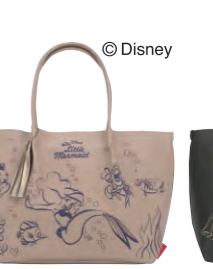
434002 Mermaid JAN: 4980862 434020