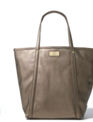
255702 Bronze JAN: 4980862 255724