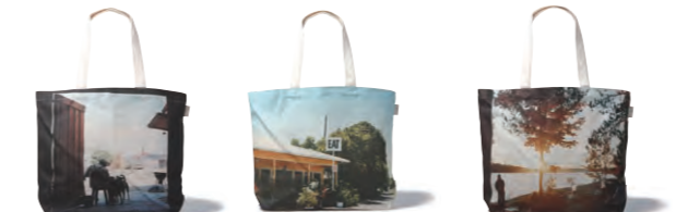
491001 Bryce Canyon JAN: 4980862 491016 491002 Naalehu JAN: 4980862 491023 491003 Lake of the Woods JAN: 4980862 491030

サイズ: W43×H38×D11cm 持ち手: 長さ60cm 高さ約30cm 素材: 綿 ポケット: 外側1箇所、内側2箇所 生産国: 中国 小売LOT: 2 / 問屋LOT: 12