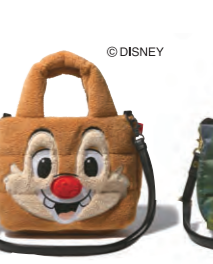
438106 Dale JAN: 4980862 438165