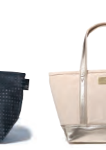
289603 Hanp-gold JAN: 4980862 289637