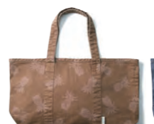
243901 Pineapple JAN: 4980862 243912 243902 California JAN: 4980862 243929

サイズ: W36×H26×D12cm 持ち手: 長さ28cm 高さ約18cm 素材: 綿 ポケット: 外側1箇所、内側1箇所 生産国: 中国 小売LOT: 2 / 問屋LOT: 12