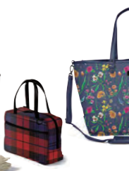
255102 FLOWER JAN: 4980862 255120