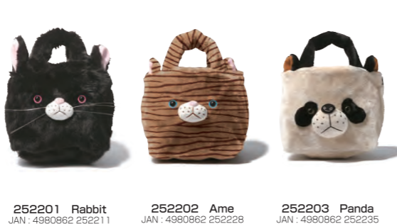
252201 Rabbit JAN：4980862 252211

サイズ：W22×H17×D17cm 持ち手：長さ22cm ショルダー：長さ最長140cm 素材：表地/ポリエステル 裏地/ポリエステル マグネットホック ポケット：外側ファスナー付1箇所、内側1箇所 生産国：中国 小売LOT：3/問屋LOT：18 2522 BR SN Fur Animal-D 税抜 ¥3,200