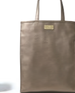
255802 Bronze JAN: 4980862 255823