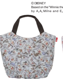
480702 Pooh JAN: 4980862 480720