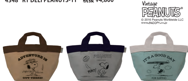
434801 Adventure JAN: 4980862 434815 434802 Kick JAN: 4980862 434822 434803 Surf JAN: 4980862 434839

サイズ: W32×H39×D12cm 持ち手: 26cm ショルダー: 全長110cm 素材: 表地/ポリエステル、ノンフタル酸PVC加工 裏地/ポリエステル 持ち手/ポリエステル ドットボタン ポケット: 外側3箇所 (うちファスナー付1箇所) 内側2箇所 生産国: 中国 小売Lot 2 / 問屋Lot 12