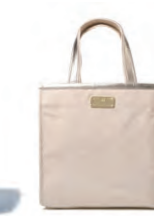
289403 Hanp-gold JAN: 4980862 289439