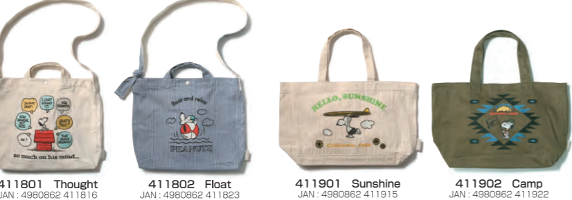
411801 Thought JAN: 4980862 411816 411802 Float JAN: 4980862 411823 411901 Sunshine JAN: 4980862 411915 411902 Camp JAN: 4980862 411922

サイズ: W41×H24×D12cm 持ち手: 40cm 素材: 綿 ポケット: 外側1箇所、内側2箇所 生産国: 中国 小売LOT: 2 / 問屋LOT: 12