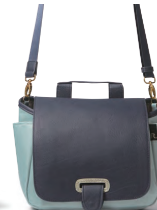
341602 NAVY JAN: 4980862 341625