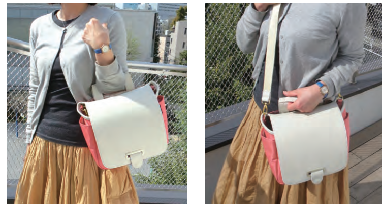
↑ 手提げやショルダーなど、シーンやお好みに応じて持ち方もいろいろ↑

バーハンドルにバッグがあれば、かがみずしに荷物とり出せます。旅先では、手提げトートやショルダーバッグに変身、そのまま使うことができます。大人の女子旅をもっと楽々、スマートに。お出かけや旅のおともに「オトモルー」です。