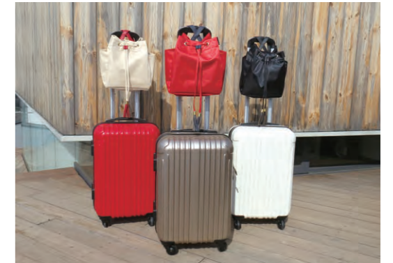
キャリーカートのバーハンドルに被せて持つことができます。