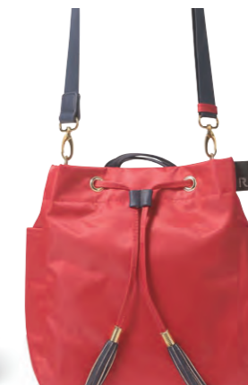
341702 RED JAN: 4980862 341724