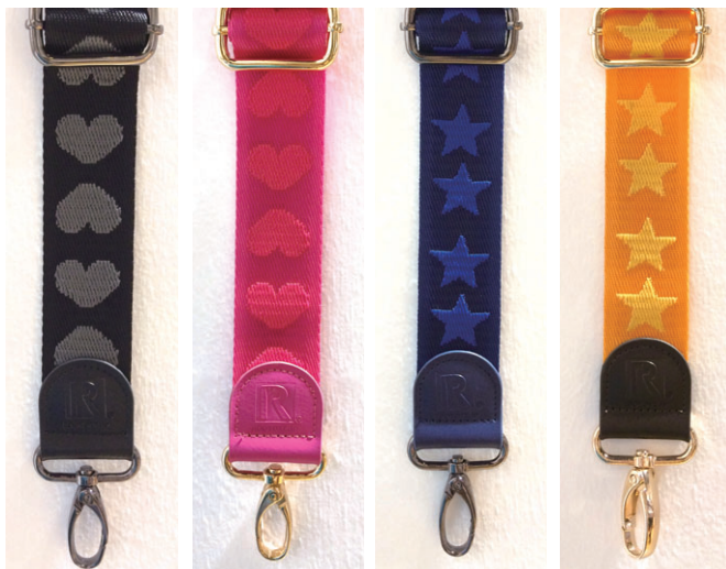
342101 H-BLK JAN: 4980862 342110 342102 H-PIK JAN: 4980862 342127 342103 S-NVY JAN: 4980862 342134 342104 S-ORG JAN: 4980862 342141