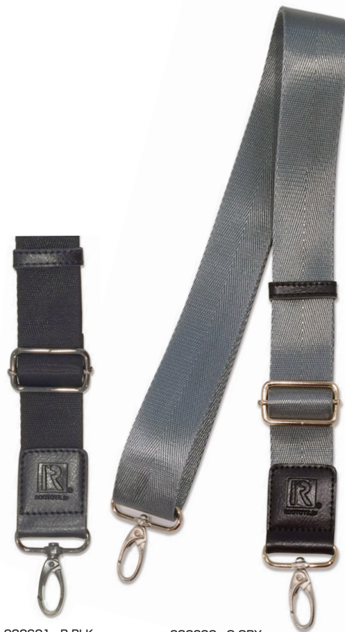
032601 B-BLK JAN: 4980862 032615 032602 G-GRY JAN: 4980862 032622