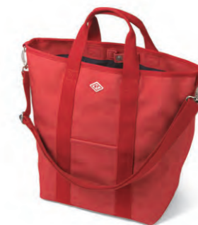
163604 Red JAN : 4980862 163647