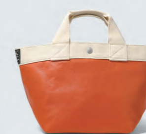
260309 Orange JAN: 4980862 260391