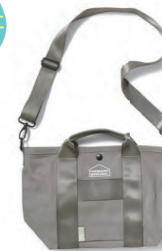
338501 Gray JAN : 4980862 338519