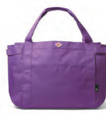
334905 Purple JAN : 4980862 334955