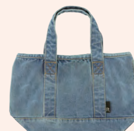
314302 Med Used JAN : 4980862 314322