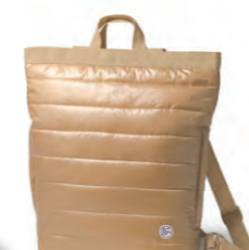
340803 Beige JAN: 4980862 340833