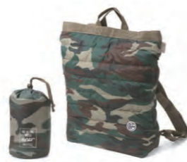
171002 Woodland JAN: 4980862 171024