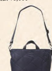
340501 Navy JAN: 4980862 340512