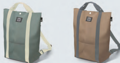
154903 SAGE JAN: 4980862 154935