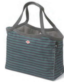
163803 Navy/Green JAN : 4980862 163838