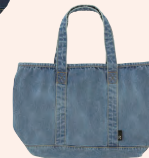
314402 Med Used JAN : 4980862 314421