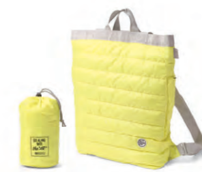
171101 Yellow JAN: 4980862 171116

サイズ: W38×H40×D13cm 持ち手: 17cm(ショルダー最長100cm) 素材: 表地/ポリエステル はっ水加工 裏地/ポリエステル 持ち手/ポリプロピレン 中わた/ポリエステル ドットボタン ポケット: 外側ファスナー付1箇所(入り口2箇所)、内側ファスナー1箇所 生産国: 中国 小売LOT: 2/問屋LOT: 12