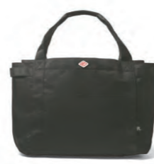
334906 Black JAN : 4980862 334962