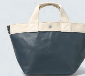
260308 NAVY/IVO JAN: 4980862 260384

サイズ: W41×H23×D20cm 持ち手: 28cm 素材: 表地/合成皮革 裏地/ポリエステル 持ち手/ポリエステル ドットボタン ポケット: 外側ファスナー付1箇所、内側ファスナー付1箇所 生産国: 中国 小売LOT: 3/問屋LOT: 18