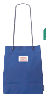
319707 Blue JAN: 4980862 319778