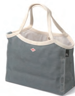
163801 Gray JAN : 4980862 163814

サイズ : W35×H24×D14cm 持ち手 : 42cm 素材 : 表地/綿 裏地/ポリエステル、綿 持ち手/ポリエステル 底板/ベルボレーン ドットボタン ポケット : 外側ファスナー付1箇所、内側2箇所 生産国 : ベトナム 小売LOT : 2 / 問屋LOT : 12