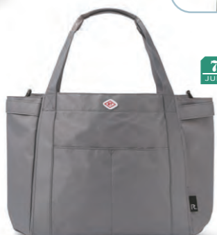
164001 Gray JAN : 4980862 164019