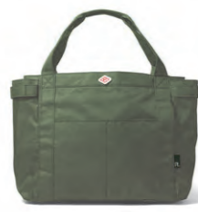
334903 Khaki JAN : 4980862 334931