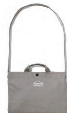
338701 Gray JAN : 4980862 338717