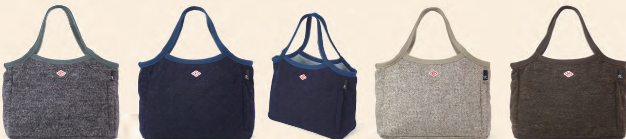
167501 Gray JAN: 4980862 167515

サイズ: W35×H24×D14cm 持ち手: 42cm 素材: 表地/01,02,04 ポリエステル, 羊毛 03, ポリエステル, アクリル, 羊毛 裏地/ポリエステル, 綿 持ち手/ポリエステル ドットボタン ポケット: 外側ファスナー付1箇所, 内側3箇所(うちファスナー付1箇所) 生産国: 中国 小売LOT: 2/問屋LOT: 12