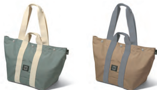
154803 SAGE JAN: 4980862 154836