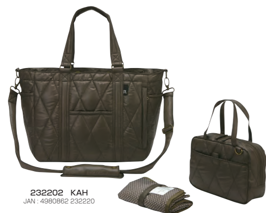
232202 KAH JAN: 4980862 232220