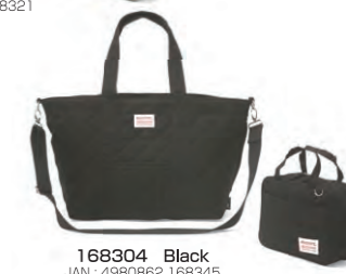
168304 Black JAN: 4980862 168345