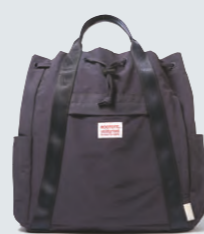
319402 Navy JAN: 4980862 319426