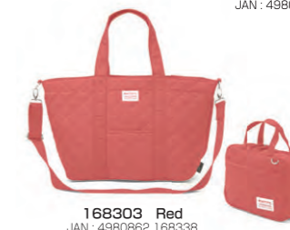
168303 Red JAN: 4980862 168338