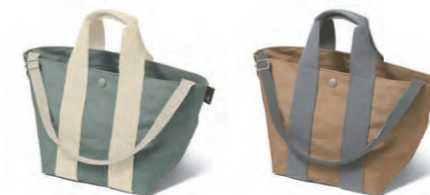
154703 SAGE JAN: 4980862 154737