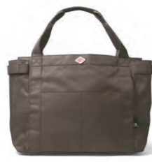
334904 Brown JAN : 4980862 334948