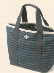
163703 Navy/Green JAN : 4980862 163739