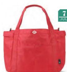
164003 Red JAN : 4980862 164033