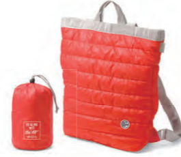
171005 Red JAN: 4980862 171055

Thermore® THERMAL INSULATION EXPERTS SINCE 1972