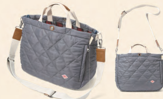
167003 GRAY JAN: 4980862 167034