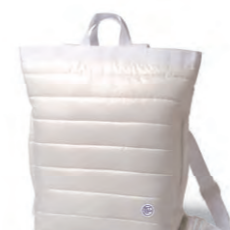
340802 White JAN: 4980862 340826