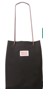
341301 Black JAN: 4980862 341311