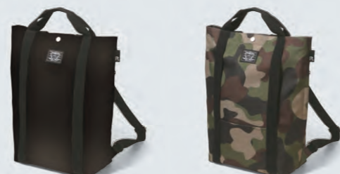
154901 Black JAN: 4980862 154911

サイズ: W37×H42×D13cm 持ち手: 24cm(ショルダー最長106cm) 素材: 表地/ポリエステル 裏PVB加工 持ち手/ポリエステル ドットボタン ポケット: 外側2箇所(うちファスナー付1箇所)、内側ファスナー付1箇所 生産国: ベトナム 小売LOT: 2 / 問屋LOT: 12