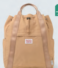
319408 Sand JAN: 4980862 319488