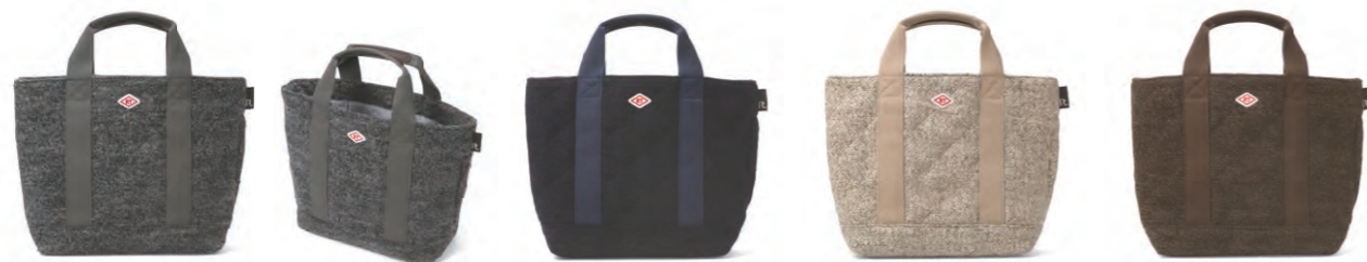
167401 Gray JAN: 4980862 167416

サイズ: W36.5×H26×D12cm 持ち手: 30cm 素材: 表地/01,02,04 ポリエステル, 羊毛 03, ポリエステル, アクリル, 羊毛 裏地/ポリエステル, 綿 持ち手/ポリエステル マグネットホック ポケット: 外側ファスナー付1箇所, 内側3箇所 生産国: 中国 小売LOT: 2/問屋LOT: 12