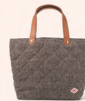
334303 Tubu brown JAN: 4980862 334337