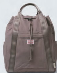
339002 Gray JAN: 4980862 339028