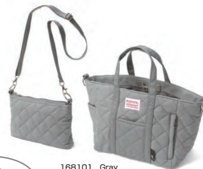
168101 Gray JAN: 4980862 168116

ITEM : 1681 SN, デリ, コットンキルティングーA PRICE: 税抜 ¥4,500