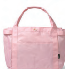
334902 Pink JAN : 4980862 334924