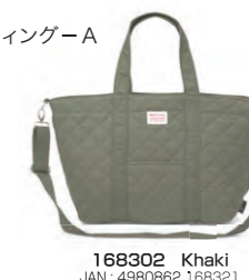
168302 Khaki JAN: 4980862 168321