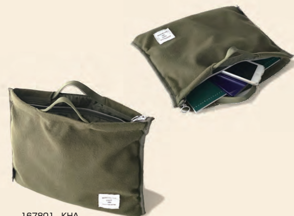
167801 KHA JAN : 4980862 167812

サイズ: W32×H25×D9cm 持ち手: 15cm 素材: 表地/ポリエステル 裏地/ポリエステル 持ち手/ポリエステル ポケット: 外側1箇所、内側7箇所(うちファスナー付1箇所) 生産国: ベトナム 小売LOT: 2/問屋LOT: 12