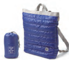
171004 Blue JAN: 4980862 171048