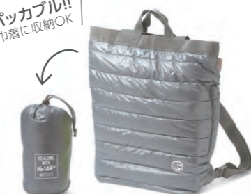
171003 Chacoal JAN: 4980862 171031