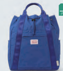
319407 Blue JAN: 4980862 319471