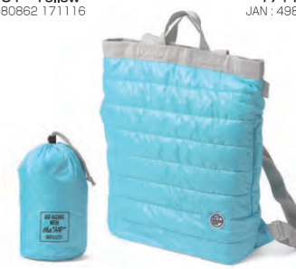
171103 Emerald JAN: 4980862 171130