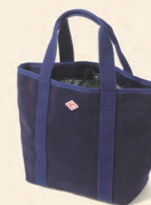
163702 Navy JAN : 4980862 163722