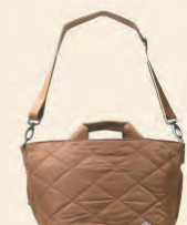
340602 Brown JAN: 4980862 340628