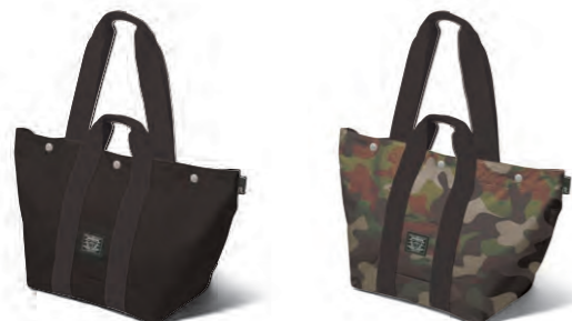
154801 Black JAN: 4980862 154812

サイズ: W54×H32×D20cm 持ち手: 大64cm 小21cm 素材: 表地/ポリエステル 裏PVB加工 持ち手/ポリエステル ドットボタン ポケット: 外側2箇所(うちファスナー付1箇所)、内側ファスナー付1箇所 生産国: ベトナム 小売LOT: 2 / 問屋LOT: 12