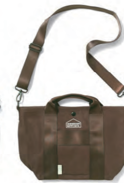
338503 Brown JAN : 4980862 338533