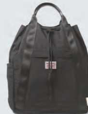
339001 Black JAN: 4980862 339011