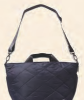
340601 Navy JAN: 4980862 340611