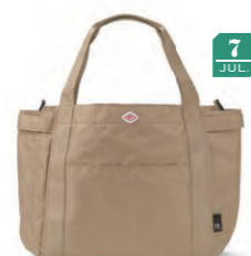
164004 Beige JAN : 4980862 164040