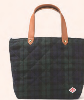
334302 Black watch JAN: 4980862 334320

サイズ: W36.5×H26×D12cm 持ち手: 長さ37cm 素材: 表地/02.レーヨン、毛、ポリエステル 03.毛、レーヨン 裏地/ポリエステル、綿 マグネットホック ポケット: 外側ファスナー付1箇所、内側3箇所 生産国: 中国 小売LOT: 3/問屋LOT: 18