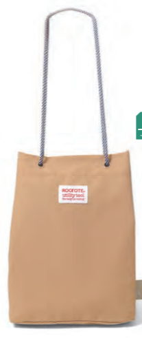
319708 Sand JAN: 4980862 319785