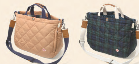
167001 BEIGE JAN: 4980862 167010

サイズ: W36×H28×D16cm 持ち手: 26cm(ショルダー最長110cm) 素材: 表地/ポリエステル 裏地/ポリエステル 持ち手/ポリエステル ドットボタン ポケット: 外側ファスナー付1箇所、内側2箇所(うちファスナー付1箇所) 生産国: ベトナム 小売LOT: 2 / 問屋LOT: 12