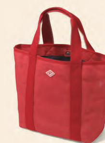
163704 Red JAN : 4980862 163746