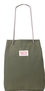
319703 Khaki JAN: 4980862 319730