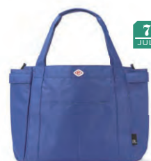
164002 Blue JAN : 4980862 164026