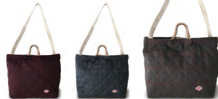
167301 WINE JAN: 4980862 167317