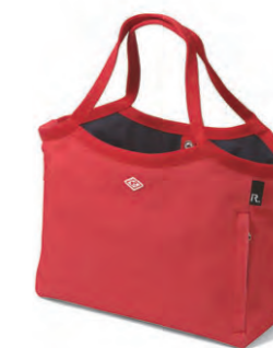
163804 Red JAN : 4980862 163845