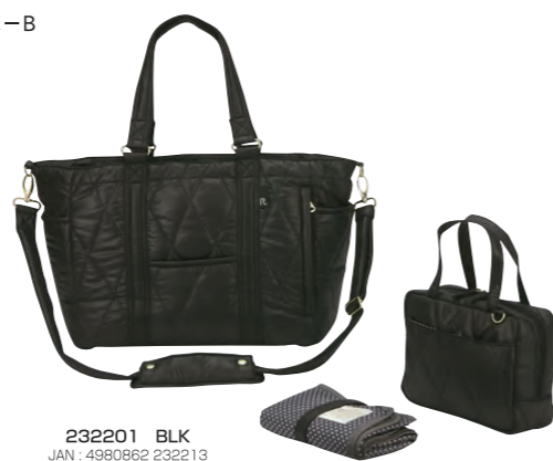
232201 BLK JAN: 4980862 232213

【トートバッグ】サイズ: W55×H30×D18cm 持ち手: 長さ50cm ショルダー: 長さ最長120cm 素材: 表地/ポリエステル 裏地/ポリエステル マグネットホック ポケット: 外側4箇所(うちファスナー付1箇所)、内側10箇所(うちファスナー付1箇所) 【ポーチ】サイズ: W21×H15×D8cm 持ち手: 長さ30cm 素材: 表地/ポリエステル 裏地/ポリエステル ポケット: 外側1箇所、内側1箇所 【オムツ替えシート】サイズ: W45×H68cm 素材: ポリエステル 生産国: 中国 小売LOT: 2/問屋LOT: 12