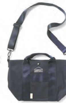
338502 Navy JAN : 4980862 338526