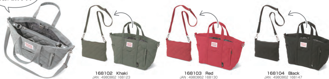
168102 Khaki JAN: 4980862 168123