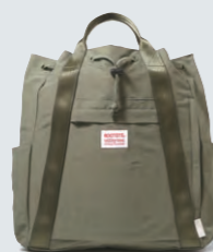
319403 Khaki JAN: 4980862 319433