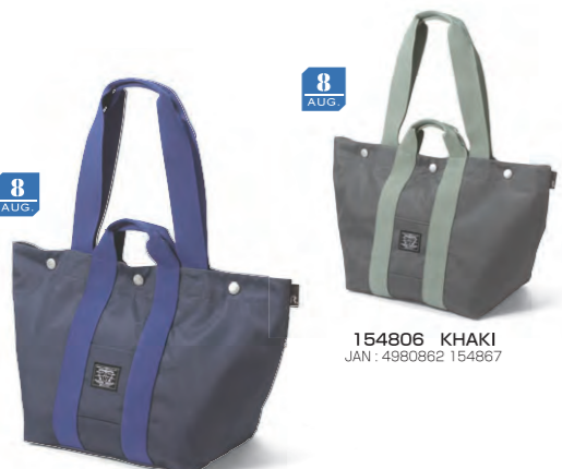
154805 Navy JAN: 4980862 154850