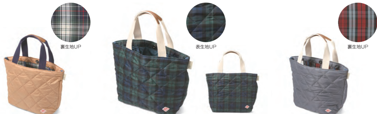
166901 BEIGE JAN: 4980862 166914

サイズ: W36.5×H26×D12cm 持ち手: 37cm 素材: 表地/ポリエステル 裏地/ポリエステル 持ち手/ポリエステル マグネットホック ポケット: 外側ファスナー付1箇所、内側3箇所 生産国: ベトナム 小売LOT: 3 / 問屋LOT: 18