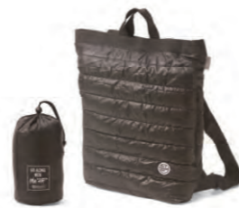
171001 Black JAN: 4980862 171017

サイズ: W38×H40×D13cm 持ち手: 17cm(ショルダー最長100cm) 素材: 表地/ポリエステル はっ水加工 裏地/ポリエステル 持ち手/ポリプロピレン 中わた/ポリエステル ドットボタン ポケット: 外側ファスナー付1箇所(入り口2箇所)、内側ファスナー1箇所 生産国: 中国 小売LOT: 2/問屋LOT: 12