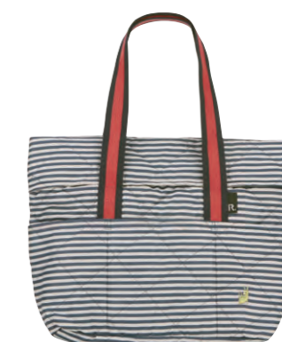
216603 Marine JAN: 4980862 216633

サイズ: W44×H32×D15cm 持ち手: 長さ46cm 素材: 表地/ポリエステル 裏地/綿、ポリエステル 持ち手/ポリエステル マグネット ポケット: 外側5箇所(うちファスナー付2箇所) 内側3箇所(うちファスナー付1箇所) 生産国: 中国 小売LOT: 2/問屋LOT: 12