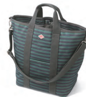
163603 Navy/Green JAN : 4980862 163630