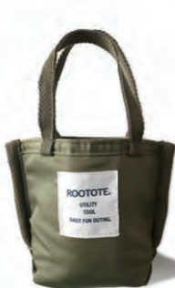
168001 KHA JAN : 4980862 168017

内側にはアルミシートを使用。 背面のルーポケットにはマドラー、お砂糖を入れられます。