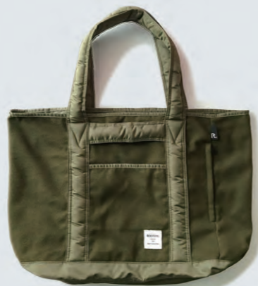
167701 KHA JAN : 4980862 167713

サイズ: W58×H38×D17cm 持ち手: 60cm 素材: 表地/ポリエステル 裏地/ポリエステル 持ち手/ポリエステル ドットボタン ポケット: 外側2箇所(うちファスナー付1箇所)、内側3箇所(うちファスナー付1箇所) 生産国: ベトナム 小売LOT: 2/問屋LOT: 12