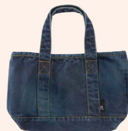
314301 Dark Used JAN : 4980862 314315

サイズ: W38×H23×D11cm 持ち手: 38cm 素材: 綿 ポケット: 外側1箇所、内側2箇所 生産国: 中国 小売LOT: 3/問屋LOT: 18