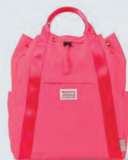
319406 Pink JAN: 4980862 319464