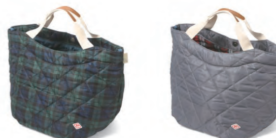
167102 B.Watch JAN: 4980862 167126