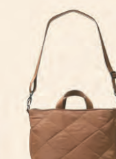
340502 Brown JAN: 4980862 340529