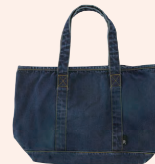
314401 Dark Used JAN : 4980862 314414

サイズ: W51×H33×D17cm 持ち手: 52cm 素材: 綿 ポケット: 外側1箇所、内側2箇所 生産国: 中国 小売LOT: 3/問屋LOT: 18