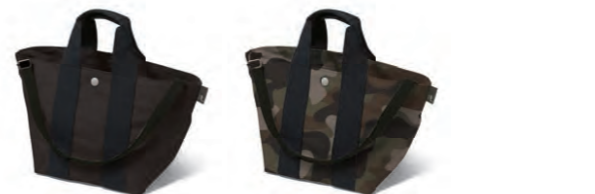
154701 Black JAN: 4980862 154713

サイズ: W41×H23×D20cm 持ち手: 30cm 素材: 表地/ポリエステル 裏PVB加工 持ち手/ポリエステル ドットボタン ポケット: 外側ファスナー付1箇所、内側ファスナー付1箇所 生産国: ベトナム 小売LOT: 3 / 問屋LOT: 18