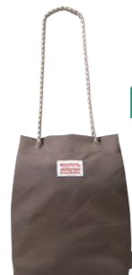
341302 Gray JAN: 4980862 341328