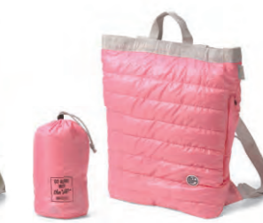
171102 Pink JAN: 4980862 171123