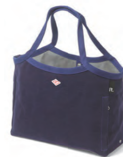
163802 Navy JAN : 4980862 163821