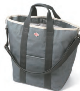
163601 Gray JAN : 4980862 163616

サイズ : W43×H34×D17cm 持ち手 : 28cm(ショルダー最長110cm) 素材 : 表地/綿 裏地/ポリエステル、綿 持ち手/ポリエステル 底板/ベルボレーン ドットボタン ポケット : 外側2箇所(うちファスナー付1箇所)、 内側3箇所(うちファスナー付1箇所) 生産国 : ベトナム 小売LOT : 2 / 問屋LOT : 12