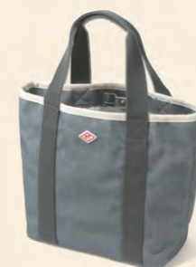
163701 Gray JAN : 4980862 163715

サイズ : W36.5×H26×D12cm 持ち手 : 37cm 素材 : 表地/綿 裏地/ポリエステル、綿 持ち手/ポリエステル 底板/ベルボレーン ドットボタン ポケット : 外側ファスナー付1箇所、内側3箇所 生産国 : ベトナム 小売LOT : 3 / 問屋LOT : 18