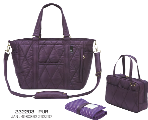
232203 PUR JAN: 4980862 232237