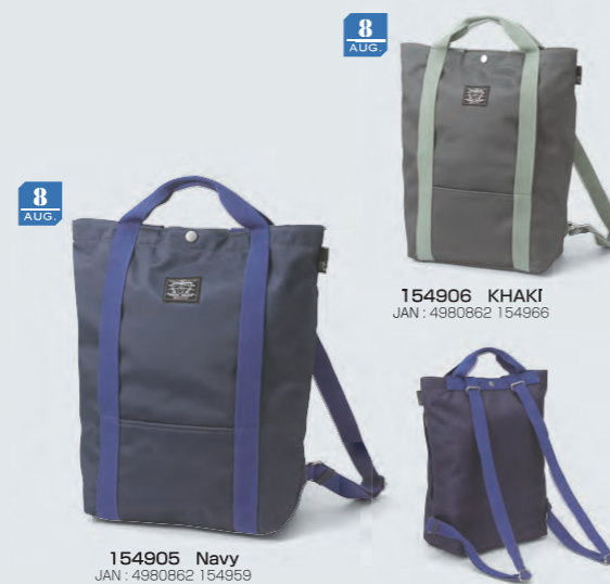
154905 Navy JAN: 4980862 154959