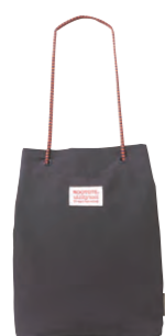
319702 Navy JAN: 4980862 319723