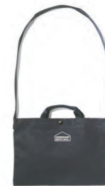
338702 Navy JAN : 4980862 338724