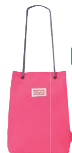
319706 Pink JAN: 4980862 319761