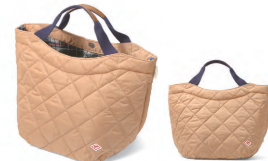
167101 BEIGE JAN: 4980862 167119

サイズ: W46×H33×D23cm 持ち手: 35cm 素材: 表地/ポリエステル 裏地/ポリエステル 持ち手/ポリエステル マグネットホック ポケット: 外側ファスナー付1箇所、内側3箇所(うちファスナー付1箇所) 生産国: ベトナム 小売LOT: 2 / 問屋LOT: 12