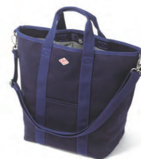
163602 Navy JAN : 4980862 163623