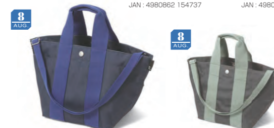
154705 Navy JAN: 4980862 154751