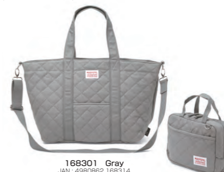
168301 Gray JAN: 4980862 168314

サイズ: W55×H30×D20cm ポーチ/W21×H15×D8cm 持ち手: 48cm(ショルダー最長110cm) 素材: 表地/綿 裏地/ポリエステル 持ち手/綿 マグネットホック ポケット: 外側2箇所(うちファスナー付1箇所), 内側6箇所(うちファスナー付1箇所) 生産国: 中国 小売LOT: 2/問屋LOT: 12