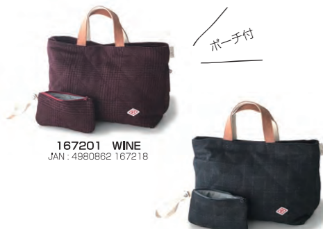
167201 WINE JAN: 4980862 167218

サイズ: W40×H24×D13cm ポーチ/W18×H10cm 持ち手: 28cm 素材: 表地/ポリエステル, 羊毛 裏地/ポリエステル, 綿 持ち手/革, ポリエステル マグネットホック ポケット: 外側ファスナー付1箇所, 内側2箇所 生産国: 中国 小売LOT: 2/問屋LOT: 12