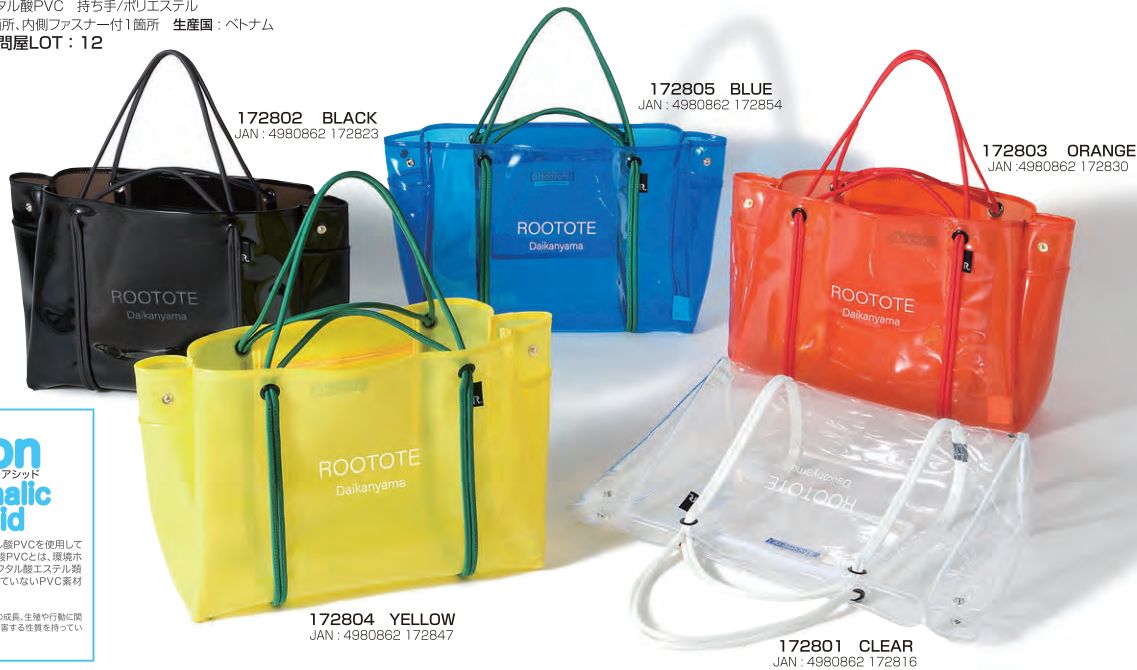
172802 BLACK JAN: 4980862 172823

サイズ: W62×H33×D16cm 持ち手: 55cm, 20cm 素材: 表地/ノンフタル酸PVC 持ち手/ポリエステル ポケット: 外側2箇所、内側ファスナー付1箇所 生産国: ベトナム 小売LOT: 2/ 問屋LOT: 12