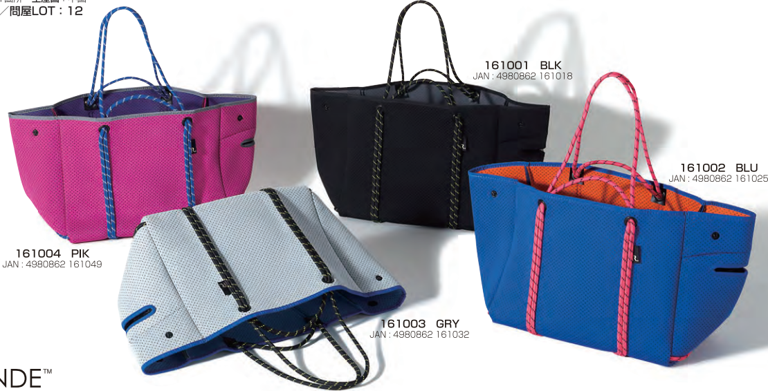
161004 PIK JAN: 4980862 161049

サイズ: W62×H30×D24cm 持ち手: 55cm, 20cm 素材: 表地/ポリエステル 持ち手/ポリエステル ポケット: 外側1箇所 生産国: 中国 小売LOT: 2/ 問屋LOT: 12