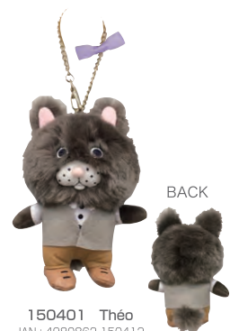
150401 Théo JAN: 4980862 150412

サイズ: W約10×H約12×D約6.5cm 素材: ポリエステル 生産国: 中国 小売LOT: 2/問屋LOT: 12