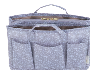
343501 Sauvage JAN: 4980862 343513