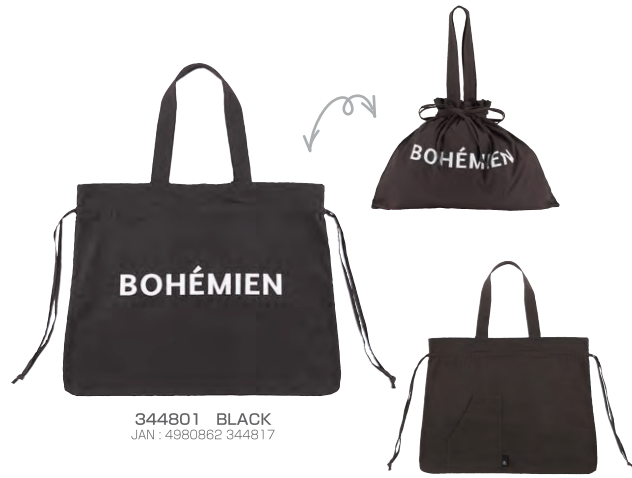
344801 BLACK JAN: 4980862 344817