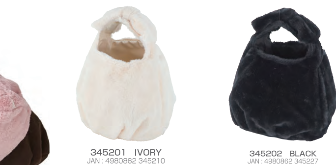
345201 IVORY JAN: 4980862 345210

サイズ: W30×H30×D17cm 素材: ポリエステル ポケット: 外側ファスナー付1箇所 内側1箇所 生産国: 中国 小売LOT: 2/問屋LOT: 12