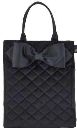
344903 BLACK JAN: 4980862 344930