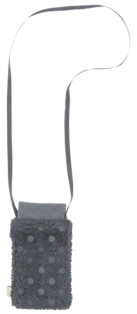
345603 GRAY JAN: 4980862 345630