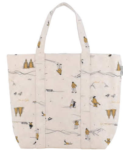
344401 Patinage JAN: 4980862 344411