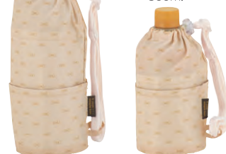
343803 Ruban JAN: 4980862 343834