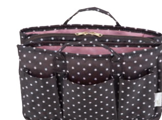
343502 à pois JAN: 4980862 343520