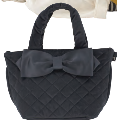
345003 BLACK JAN: 4980862 345036