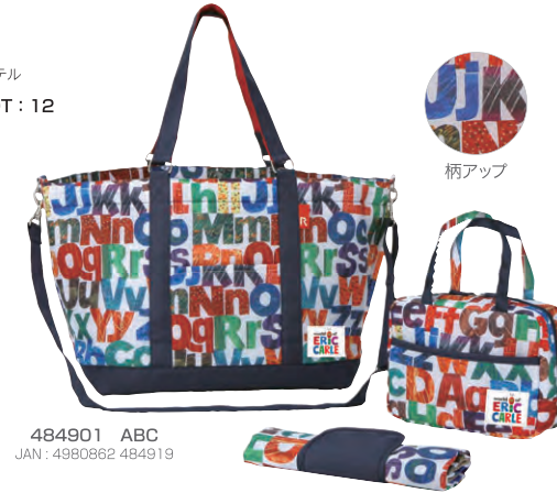
484901 ABC JAN: 4980862 484919