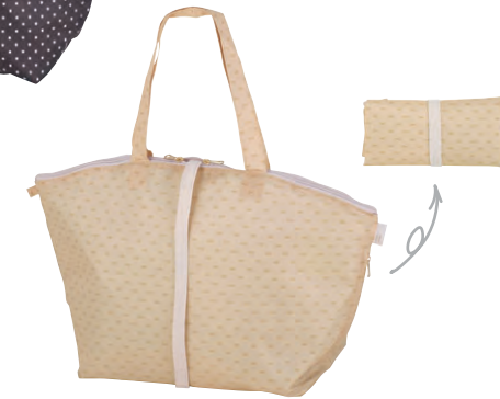
344003 Ruban JAN: 4980862 344039

サイズ: W55×H35×D20cm 持ち手: 55cm 素材: 表地/ポリエステル 裏地/アルミシート 持ち手/ポリエステル ポケット: 外側ファスナー付1箇所 内側ファスナー付1箇所 生産国: 中国 小売LOT: 3/問屋LOT: 18