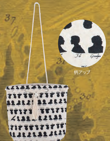
344602 Famille JAN: 4980862 344626