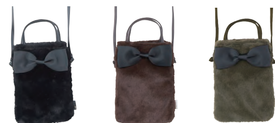
345302 BLACK JAN: 4980862 345326

サイズ: W13×H18cm 持ち手: 20cm ショルダー: 130cm 素材: ポリエステル 持ち手/合成皮革 ポケット: 外側1箇所 生産国: 中国 小売LOT: 3/問屋LOT: 18