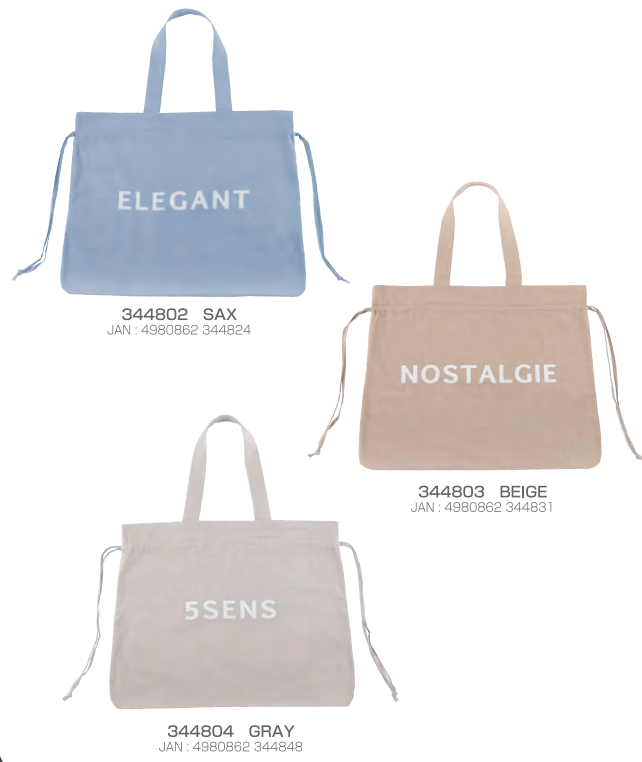
344802 SAX JAN: 4980862 344824