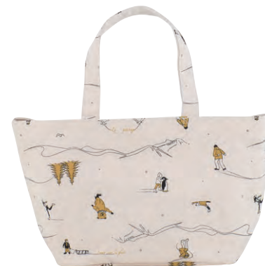
344501 Patinage JAN: 4980862 344510