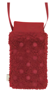
345602 RED JAN: 4980862 345623