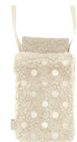
345601 IVORY JAN: 4980862 345616