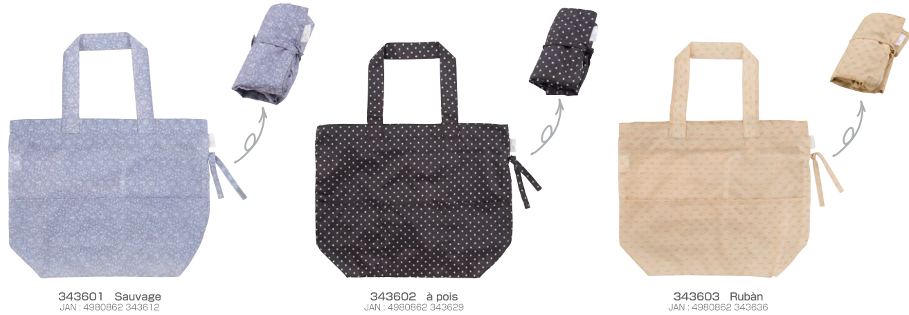
343601 Sauvage JAN: 4980862 343612