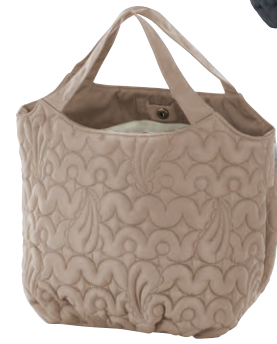
344201 BEIGE JAN: 4980862 344213