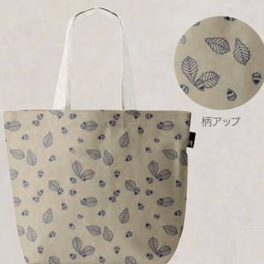
343004 Gland JAN: 4980862 343049