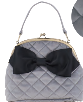
345102 GRAY JAN: 4980862 345128