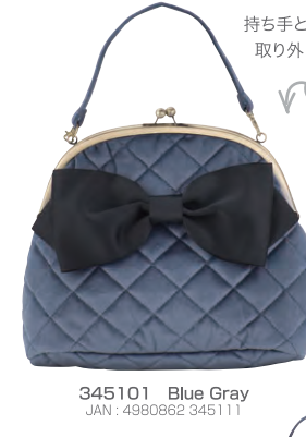
345101 Blue Gray JAN: 4980862 345111