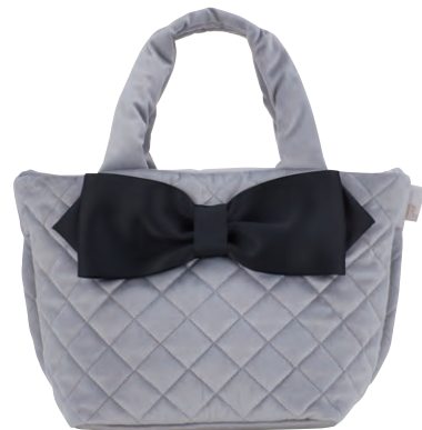
345002 GRAY JAN: 4980862 345029