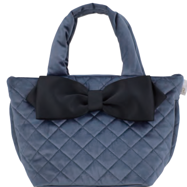
345001 Blue Gray JAN: 4980862 345012