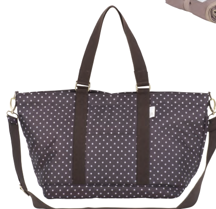
343402 à pois JAN: 4980862 343421