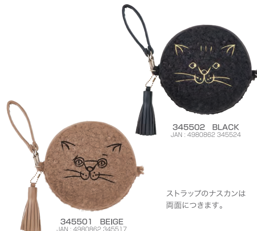
345501 BEIGE JAN: 4980862 345517