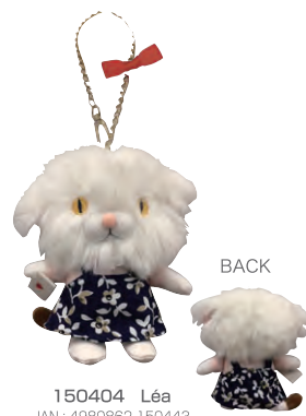
150404 Léa JAN: 4980862 150443