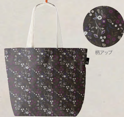
343001 Sauvage JAN: 4980862 343016