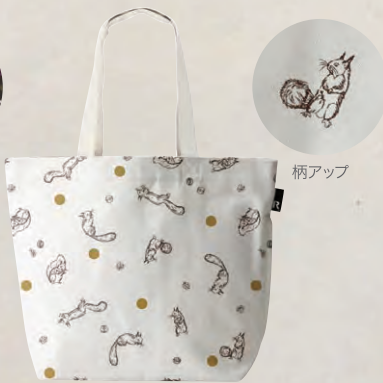
343002 Preferee JAN: 4980862 343025