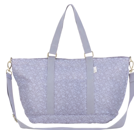
343401 Sauvage JAN: 4980862 343414