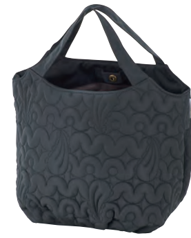
344202 BLACK JAN: 4980862 344220