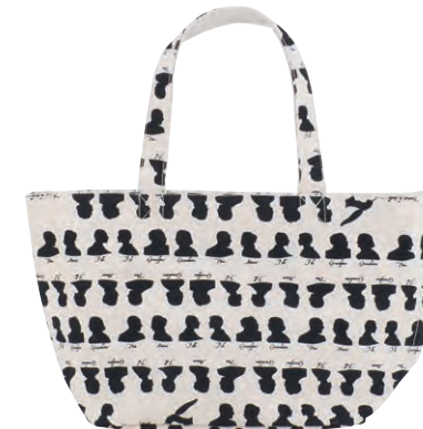
344502 Famille JAN: 4980862 344527