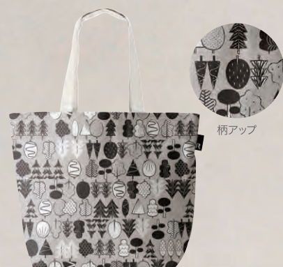
343005 Morimori JAN: 4980862 343056