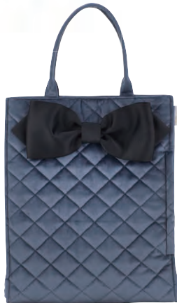
344901 Blue Gray JAN: 4980862 344916