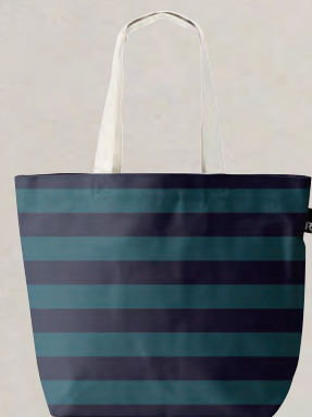
343003 Mousse JAN: 4980862 343032