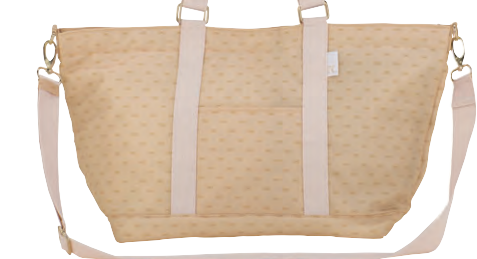
343403 Ruban JAN: 4980862 343438