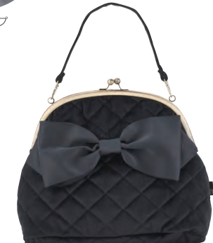
345103 BLACK JAN: 4980862 345135