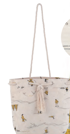
344601 Patinage JAN: 4980862 344619