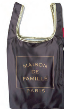
985301 BRN JAN: 4980862 985317