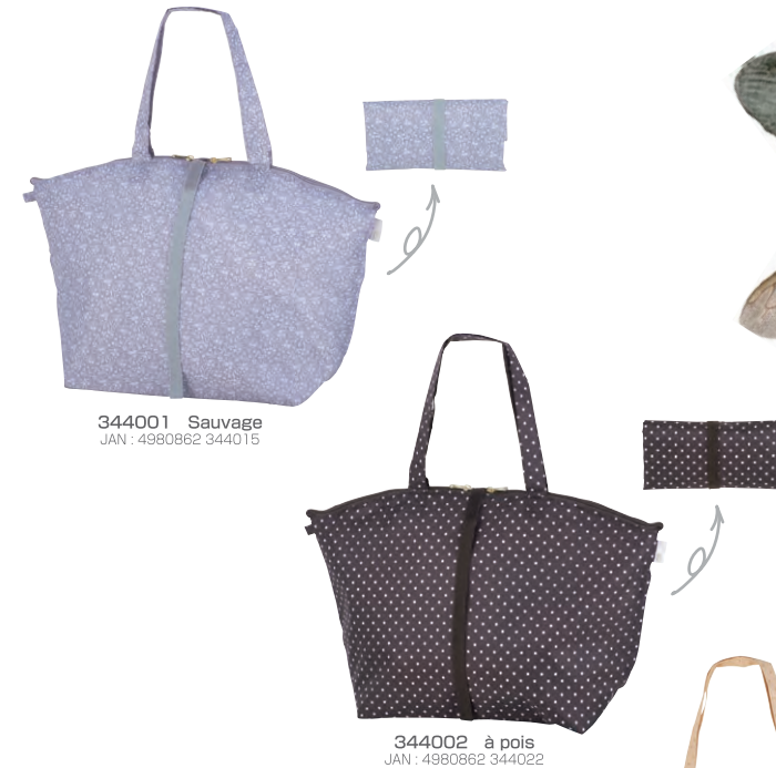
344001 Sauvage JAN: 4980862 344015

サイズ: W32×H21.5×D11.5cm 持ち手: 33cm 素材: 表地/ポリエステル 裏地/アルミボンディング 持ち手/ポリエステル ポケット: 外側ファスナー付1箇所 内側ファスナー付1箇所 生産国: 中国 小売LOT: 3/問屋LOT: 18