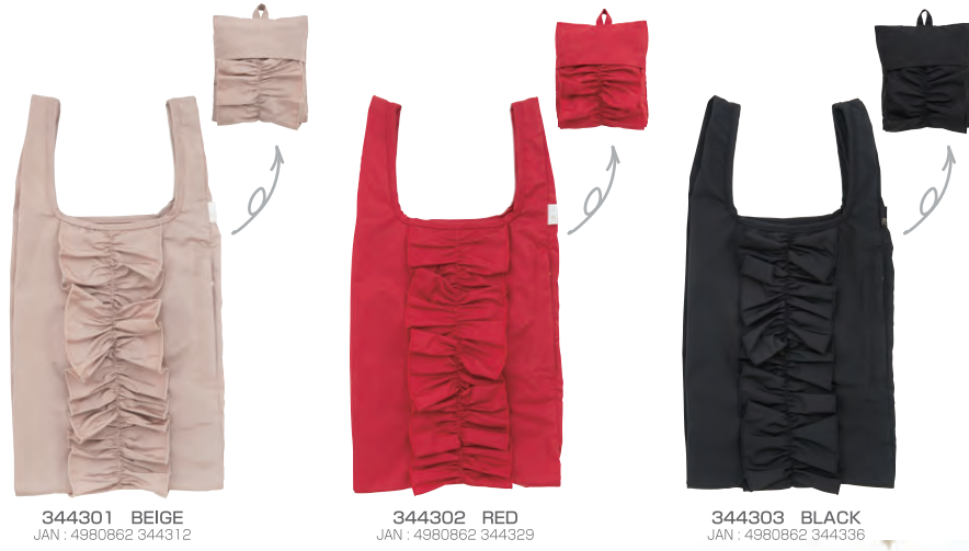
344301 BEIGE JAN: 4980862 344312