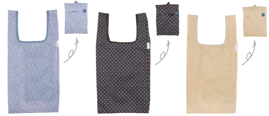
344101 Sauvage JAN: 4980862 344114

サイズ: W28×H55×D11cm (収納時: W13×H15cm) 素材: ポリエステル ポケット: 外側ファスナー付1箇所 内側1箇所 生産国: 中国 小売LOT: 3/問屋LOT: 18