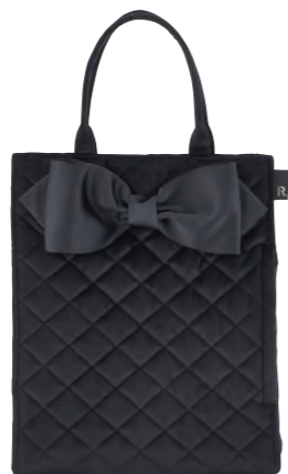
344903 BLACK JAN: 4980862 344930