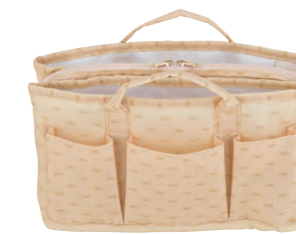
343503 Ruban JAN: 4980862 343537