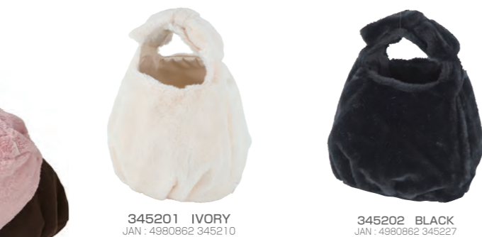
345201 IVORY JAN: 4980862 345210

サイズ: W30×H30×D17cm 素材: ポリエステル ポケット: 外側ファスナー付1箇所 内側1箇所 生産国: 中国 小売LOT: 2/問屋LOT: 12