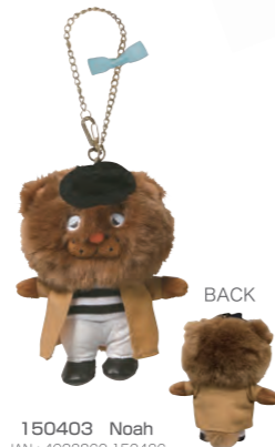
150403 Noah JAN: 4980862 150436