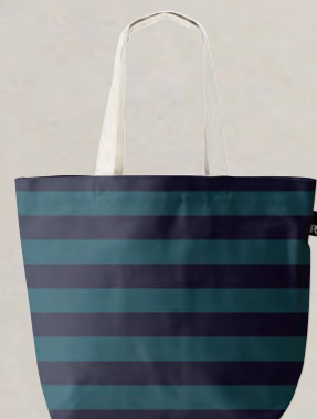
343003 Mousse JAN: 4980862 343032