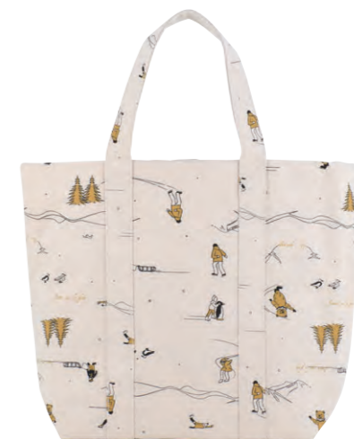
344401 Patinage JAN: 4980862 344411