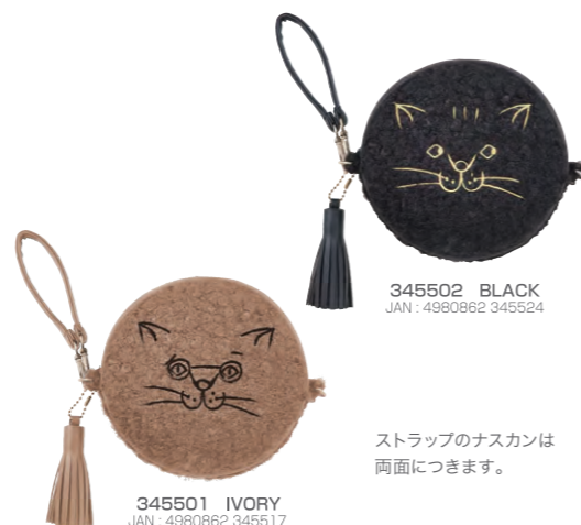
345502 BLACK JAN: 4980862 345524