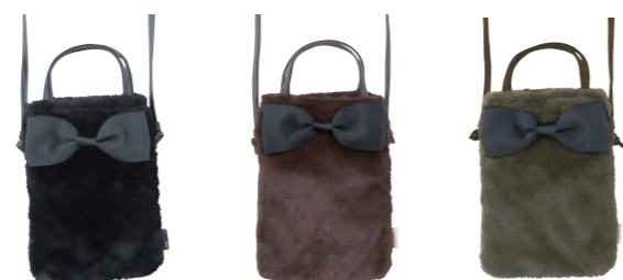
345302 BLACK JAN: 4980862 345326

サイズ: W13×H18cm 持ち手: 20cm ショルダー: 130cm 素材: ポリエステル 持ち手/合成皮革 ポケット: 外側1箇所 生産国: 中国 小売LOT: 3/問屋LOT: 18