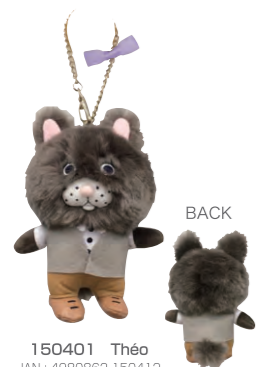
150401 Théo JAN: 4980862 150412

サイズ: W約10×H約12×D約6.5cm 素材: ポリエステル 生産国: 中国 小売LOT: 2/問屋LOT: 12