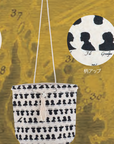
344602 Famille JAN: 4980862 344626