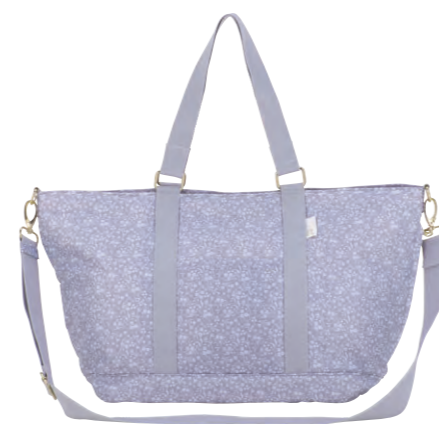
343401 Sauvage JAN: 4980862 343414