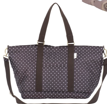
343402 à pois JAN: 4980862 343421