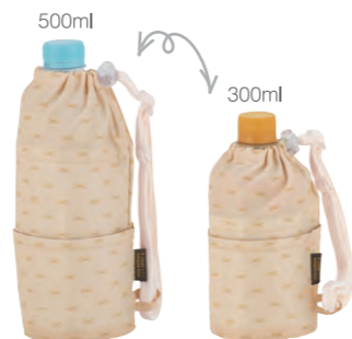
343803 Ruban JAN: 4980862 343834