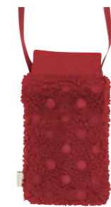
345602 RED JAN: 4980862 345623