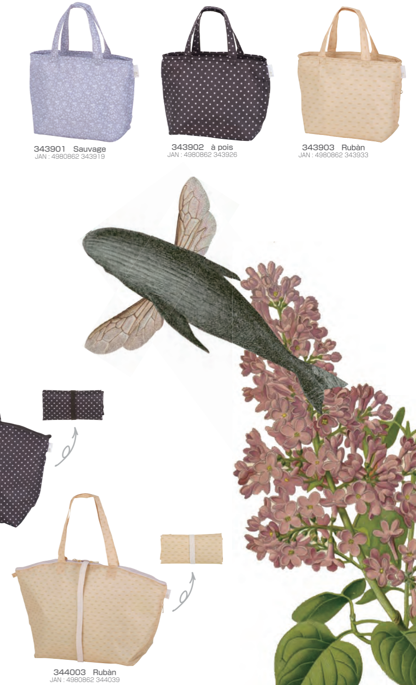
343901 Sauvage JAN: 4980862 343919

サイズ: W55×H35×D20cm 持ち手: 55cm 素材: 表地/ポリエステル 裏地/アルミシート 持ち手/ポリエステル ポケット: 外側ファスナー付1箇所 内側ファスナー付1箇所 生産国: 中国 小売LOT: 3/問屋LOT: 18