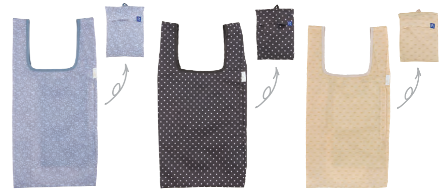
344101 Sauvage JAN: 4980862 344114

サイズ: W28×H55×D11cm (収納時: W13×H15cm) 素材: ポリエステル ポケット: 外側ファスナー付1箇所 内側1箇所 生産国: 中国 小売LOT: 3/問屋LOT: 18