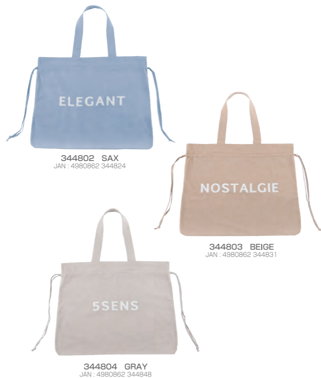
344802 SAX JAN: 4980862 344824