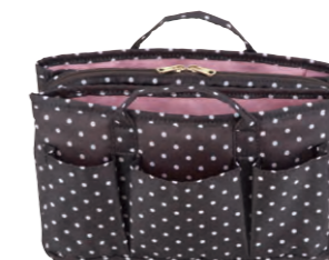
343502 à pois JAN: 4980862 343520