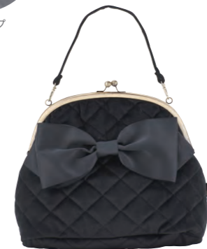
345103 BLACK JAN: 4980862 345135