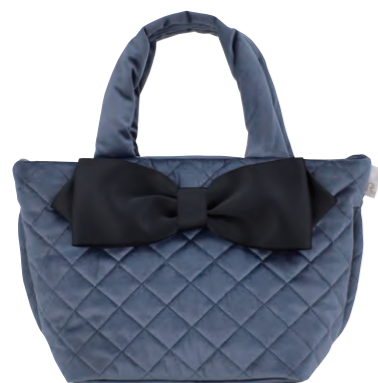
345001 Blue Gray JAN: 4980862 345012

サイズ: W42×H24×D17cm 持ち手: 40cm 素材: ポリエステル ポケット: 外側ファスナー付1箇所(入り口2箇所) 内側3箇所(うちファスナー付1箇所) 生産国: 中国 小売LOT: 2/問屋LOT: 12