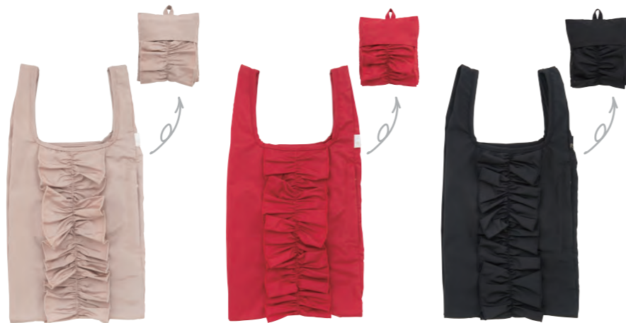
344301 BEIGE JAN: 4980862 344312

サイズ: W22×H43×D11cm (収納時: W13×H13cm) 素材: ポリエステル ポケット: 外側ファスナー付1箇所 内側1箇所 生産国: 中国 小売LOT: 3/問屋LOT: 18