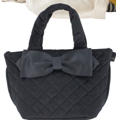
345003 BLACK JAN: 4980862 345036