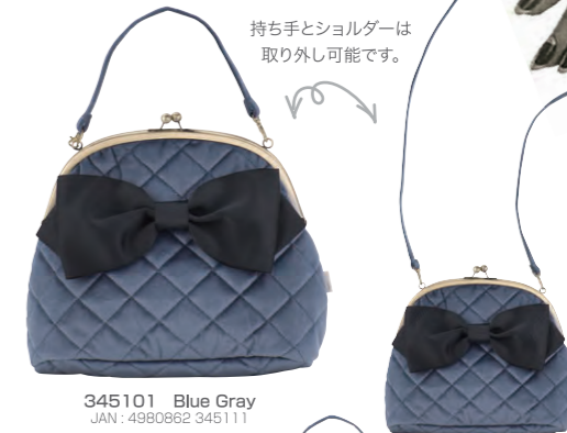
345101 Blue Gray JAN: 4980862 345111