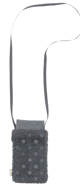
345603 GRAY JAN: 4980862 345630