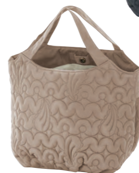
344201 BEIGE JAN: 4980862 344213