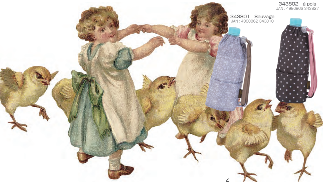
343802 à pois JAN: 4980862 343827

サイズ: (最長時) W8×H21×D8cm (最短時) W8×H15×D8cm 素材: 表地/ポリエステル 裏地/アルミボンディング 生産国: 中国 小売LOT: 4/問屋LOT: 24