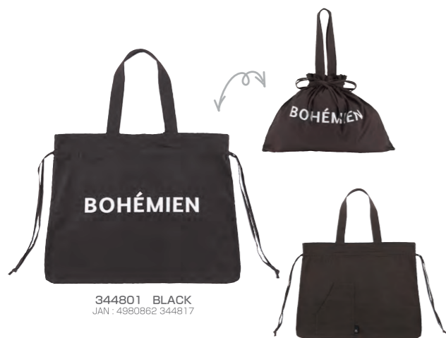
344801 BLACK JAN: 4980862 344817