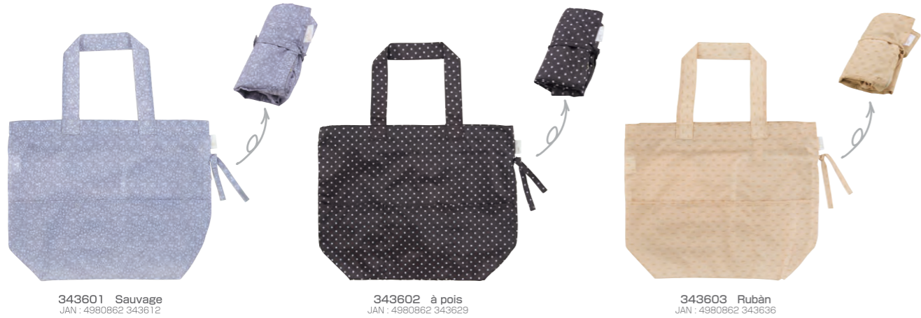
343601 Sauvage JAN: 4980862 343612