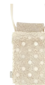
345601 IVORY JAN: 4980862 345616

サイズ: W37.5×H28.5×D18cm 持ち手: 30cm 素材: ポリエステル ドットボタン ポケット: 外側ファスナー付1箇所 内側3箇所(うちファスナー付1箇所) 生産国: 中国 小売LOT: 2/問屋LOT: 12