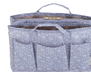
343501 Sauvage JAN: 4980862 343513