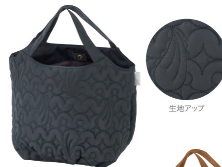
344202 BLACK JAN: 4980862 344220