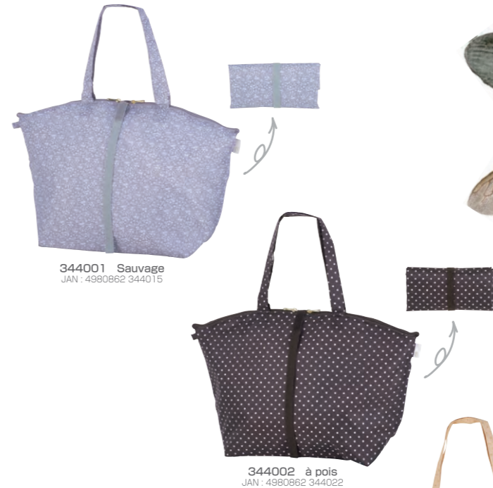
344001 Sauvage JAN: 4980862 344015

サイズ: W32×H21.5×D11.5cm 持ち手: 33cm 素材: 表地/ポリエステル 裏地/アルミボンディング 持ち手/ポリエステル ポケット: 外側ファスナー付1箇所 内側ファスナー付1箇所 生産国: 中国 小売LOT: 3/問屋LOT: 18