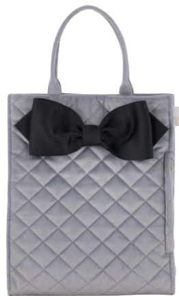
344902 GRAY JAN: 4980862 344923