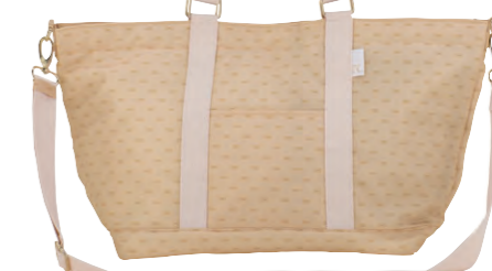
343403 Ruban JAN: 4980862 343438