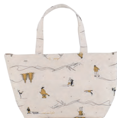
344501 Patinage JAN: 4980862 344510