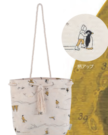
344601 Patinage JAN: 4980862 344619