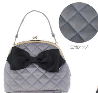
345102 GRAY JAN: 4980862 345128

サイズ: W27.5×H22.5×D12cm 持ち手: 35cm ショルダー: 最長140cm 素材: ポリエステル ポケット: 外側2箇所 内側2箇所(うちファスナー付1箇所) 生産国: 中国 小売LOT: 2/問屋LOT: 12