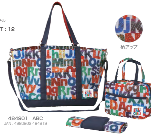
484901 ABC JAN: 4980862 484919