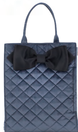
344901 Blue Gray JAN: 4980862 344916

サイズ: W28.5×H35×D9cm 持ち手: 37cm 素材: ポリエステル 底板/ベルボレーン マグネットホック ポケット: 外側ファスナー付1箇所 内側1箇所 生産国: 中国 小売LOT: 2/問屋LOT: 12