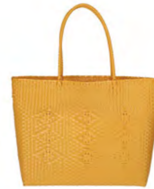
189903 YELLOW JAN: 4980862 189937