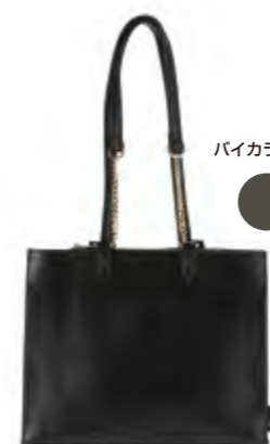
189501 BLACK JAN : 4980862 189517