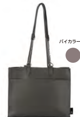
189502 CharcoalGRAY JAN : 4980862 189524