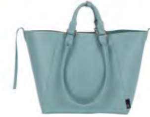
189605 IceBLUE JAN: 4980862 189654