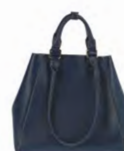
ANOTHER FORM 両サイドの紐を結べば容量も調整可能。