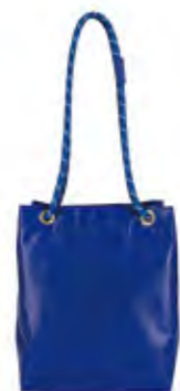
189803 BLUE JAN: 4980862 189838