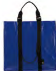
189703 BLUE JAN: 4980862 189739