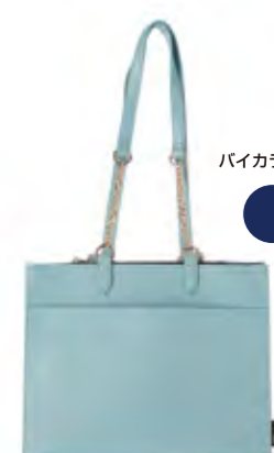
189504 IceBLUE JAN : 4980862 189548