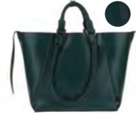
189603 GREEN JAN: 4980862 189630