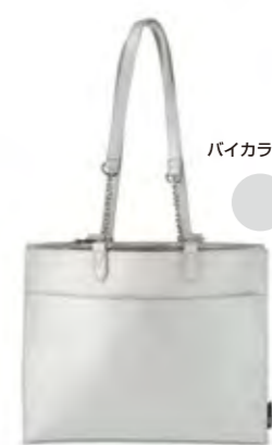
189503 SILVER JAN : 4980862 189531