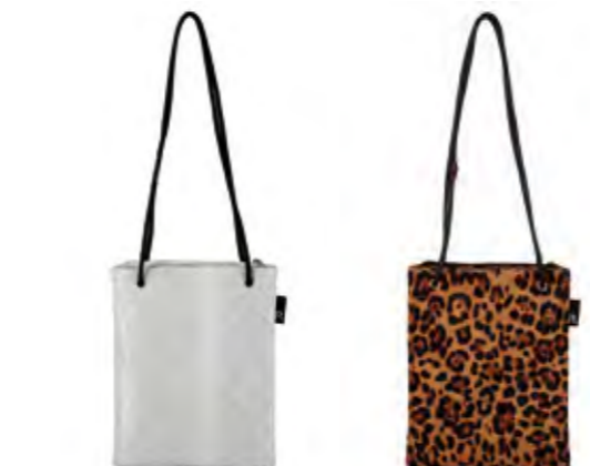
190101 Python JAN: 4980862 190117