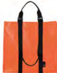
189701 ORANGE JAN: 4980862 189715