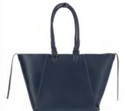
SHOULDER 肩かけ用の持ち手使用時は、短い持ち手は内側に入り込む仕様。

リアルレザーの様な、しなやかな質感のフェイクレザーを採用することで、きちんと感を保ちながらデイリー使いしやすいバッグの軽さを実現。