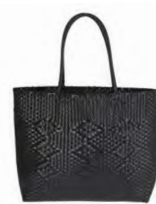
189901 BLACK JAN: 4980862 189913