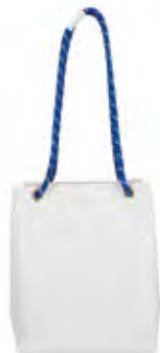
189802 WHITE JAN: 4980862 189821