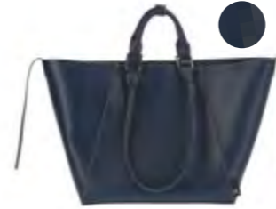
189601 NAVY JAN: 4980862 189616