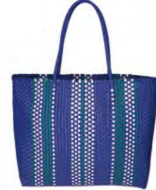
189904 Dark-MIX JAN: 4980862 189944