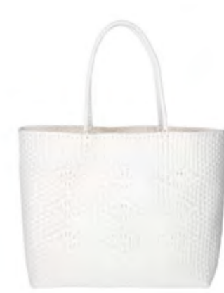
189902 WHITE JAN: 4980862 189920