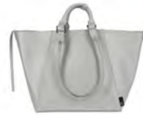
189604 SILVER JAN: 4980862 189647