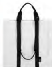
189702 WHITE JAN: 4980862 189722