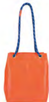
189801 ORANGE JAN: 4980862 189814