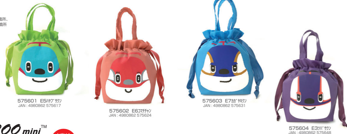
575601 E5しやがッ JAN: 4980862 575617