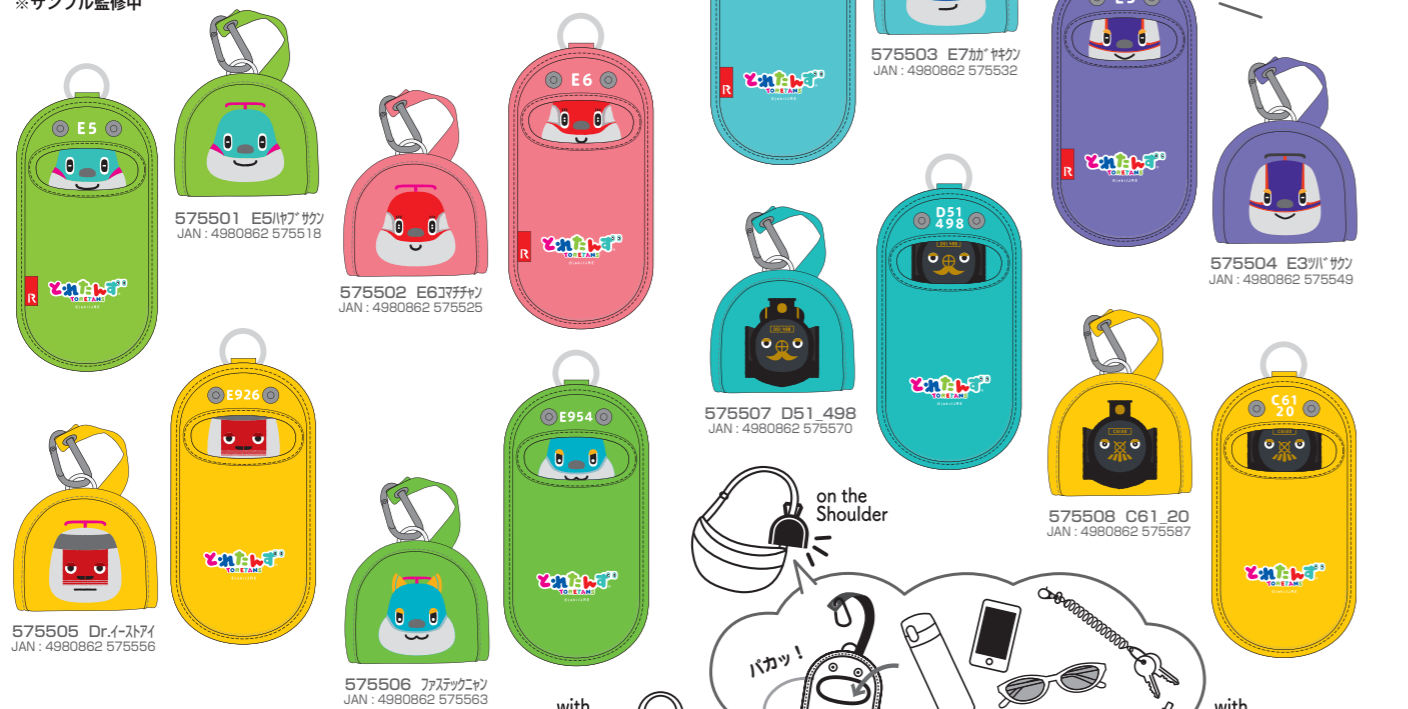
575501 E5しやがッ JAN: 4980862 575518

普段はバッグのアクセサリとして装着。 パカッと開けば、ボトルやスマホなどを 収納できる外付けポケットに変身!