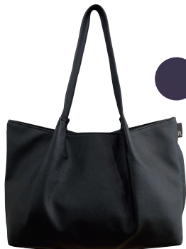
298001 BLACK JAN: 4980862 298011

サイズ: W40×H28×D15cm 持ち手: 49cm 素材: 表地/合成皮革 裏地/ポリエステル 持ち手/合成皮革 底板/バルボレーン マグネットホック ポケット: 外側ファスナー付き1箇所(ファスナー付きポケット内側にマスク用ポケット1箇所)、内側3箇所(うちファスナー付き1箇所) 生産国: 中国