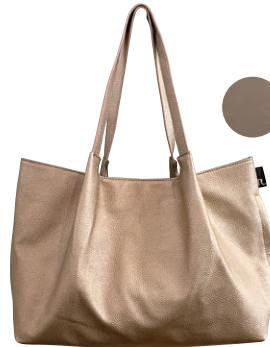
298003 M-Champagne JAN: 4980862 298035