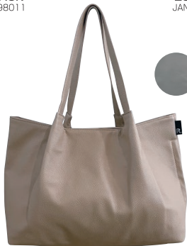
298005 GREIGE JAN: 4980862 298059