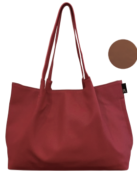
298004 RED JAN: 4980862 298042