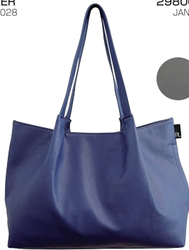
298006 BLUE JAN: 4980862 298066