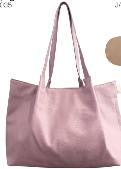
298007 PINK JAN: 4980862 298073