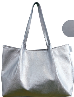
298002 SILVER JAN: 4980862 298028