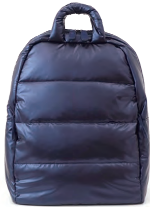
199702 Dark-Navy JAN: 4980862 199721