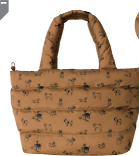
199401 Chien JAN: 4980862 199417