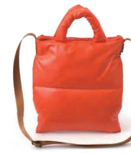
199802 Orange JAN: 4980862 199820