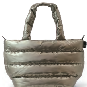
199505 Dusk JAN: 4980862 199554