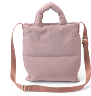
199808 Smoky-Pink JAN: 4980862 199882