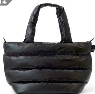
199501 Black JAN: 4980862 199516