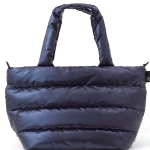
199502 Dark-Navy JAN: 4980862 199523