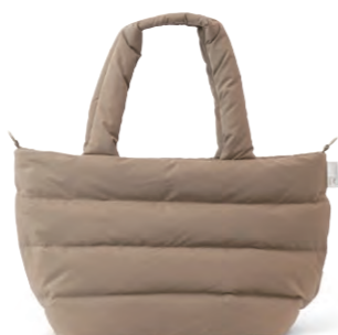
199507 Cafe au lait JAN: 4980862 199578