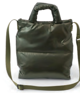
199805 Khaki JAN: 4980862 199851