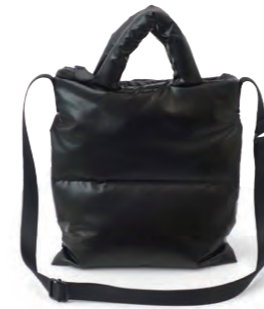
199801 Black JAN: 4980862 199813