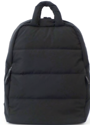
199703 MAT-Black JAN: 4980862 199738

コーディネートに取り入れやすい 6色のカラー展開。 普段づかいからお仕事まで幅広く 使用できます。