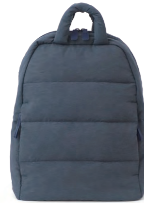
199704 Brush Blue JAN: 4980862 199745

コーディネートに取り入れやすい 6色のカラー展開。 普段づかいからお仕事まで幅広く 使用できます。