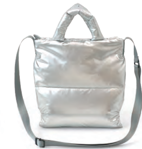
199804 Silver JAN: 4980862 199844