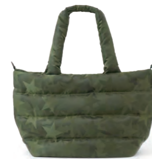
199601 STAR-Khaki JAN: 4980862 199615