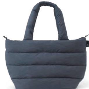
199504 Brush Blue JAN: 4980862 199547