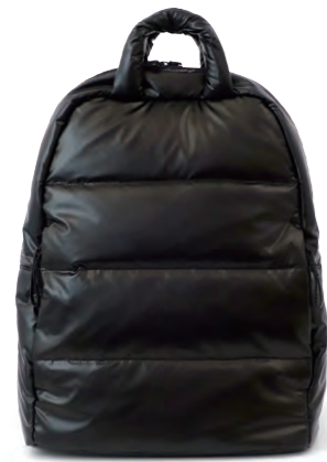
199701 Black JAN: 4980862 199714

素材: 表地/ポリエステル 04,ナイロン ポリエステル 裏地/ポリエステル 持ち手/ポリエステル 04,ナイロン ポリエステル ショルダー/ポリエステル 本体 中わた/フェザー、ダウン ポケット: 外側2箇所(うちファスナー付1箇所(入り口2箇所)、内側1箇所) メイン開閉ファスナー 生産国: 中国