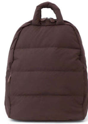
199705 Dark Brown JAN: 4980862 199752