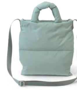
199807 Smoky-Mint JAN: 4980862 199875