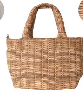
199303 Basket JAN: 4980862 199332