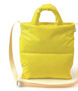
199803 Yellow JAN: 4980862 199837