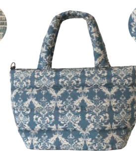
199403 Cashe cashe JAN: 4980862 199431