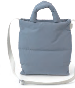
199806 Smoky-Blue JAN: 4980862 199868