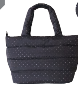
199301 Dot JAN: 4980862 199318