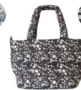
199404 Fruit JAN: 4980862 199448