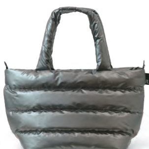
199506 Dark-Gray JAN: 4980862 199561