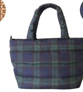
199304 Plaid JAN: 4980862 199349