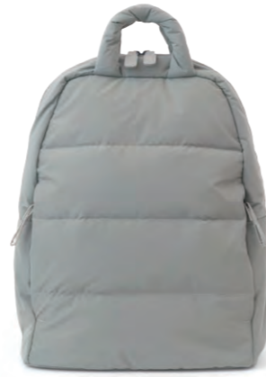
199706 Gray JAN: 4980862 199769