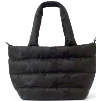
199602 STAR-Black JAN: 4980862 199622