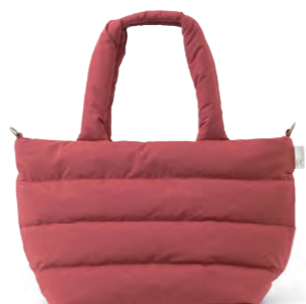
199508 Crimson Red JAN: 4980862 199565