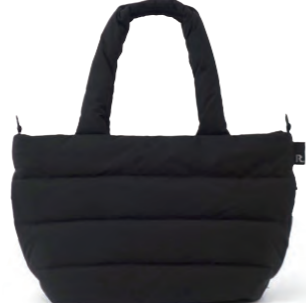
199503 MAT-Black JAN: 4980862 199530