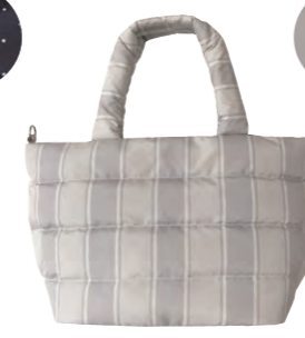
199302 Stripe JAN: 4980862 199325