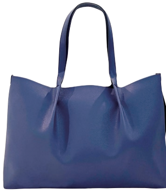
147704 NAVY JAN: 4980862 147746