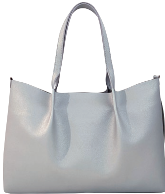
147702 WHITE SILVER JAN: 4980862 147722