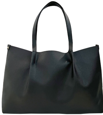
147701 BLACK JAN: 4980862 147715

サイズ: W44×H29×D14cm 持ち手:50cm 素材:表地/合成皮革 持ち手/合成皮革 ポケット: 外側:1箇所、内側:1箇所 生産国: 中国