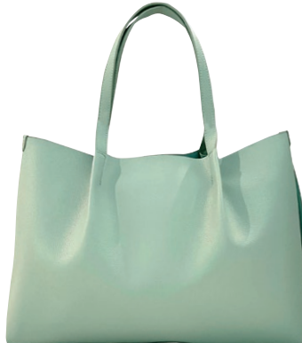
147706 MINTGREEN JAN: 4980862 147760