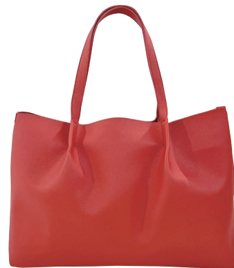
147705 RED JAN: 4980862 147753