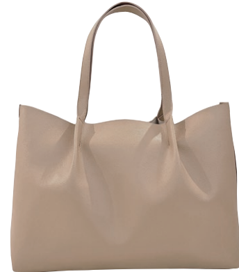
147703 BEIGE JAN: 4980862 147739