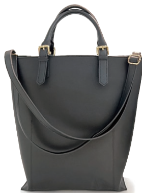
302001 BLACK JAN : 4980862 302015