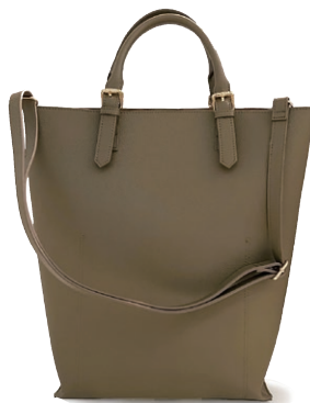
302002 OLIVE JAN : 4980862 302022