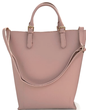
302004 PINK JAN : 4980862 302046