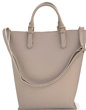
302003 BEIGE JAN : 4980862 302039