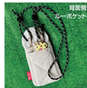
背面側 ルーポケット

サイズ：W12×H23.5cm ショルダー：最長約130cm 素材：表地/ナイロン、裏地/ポリエステル ポケット：外側1箇所 生産国：中国