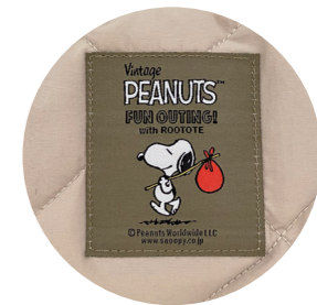
織ネームアップ(共通)