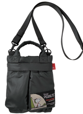
833701 BLACK JAN: 4980862 833717