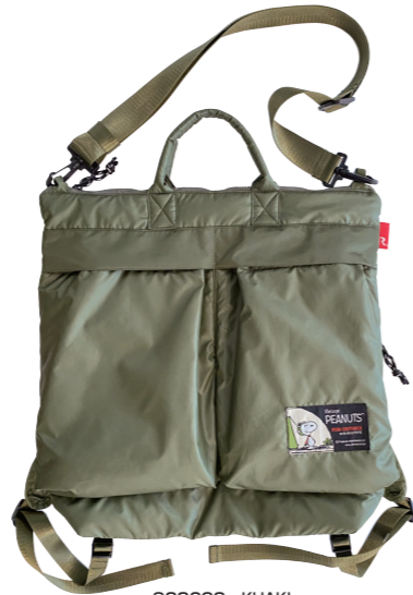
833602 KHAKI JAN: 4980862 833625