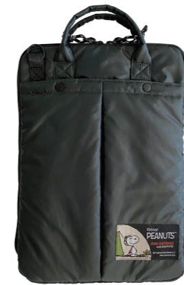
833801 BLACK JAN: 4980862 833816