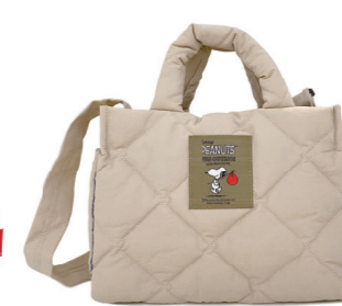
834002 Beige JAN : 4980862 834028