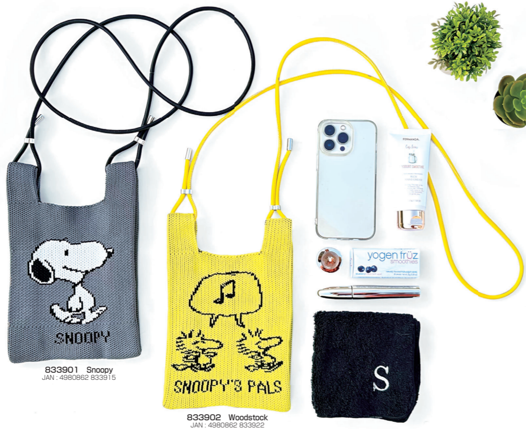
833901 Snoopy JAN : 4980862 833915