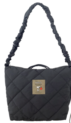
834101 Black JAN : 4980862 834110

サイズ：W43×H28×D15cm 持ち手：13cm ショルダー：最長約120cm 素材：表地/ナイロン、裏地/ポリエステル 持ち手/ショルダー/ナイロン ポケット：外側ファスナー付1箇所、内側2箇所 メイン開閉：ファスナー 生産国：中国