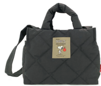
834001 Black JAN : 4980862 834011