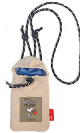
834202 Beige JAN : 4980862 834226