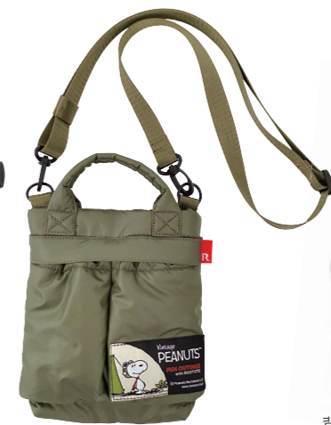
833702 KHAKI JAN: 4980862 833724

Vintage PEANUTS™ © 2023 Peanuts Worldwide LLC www.snoopy.co.jp