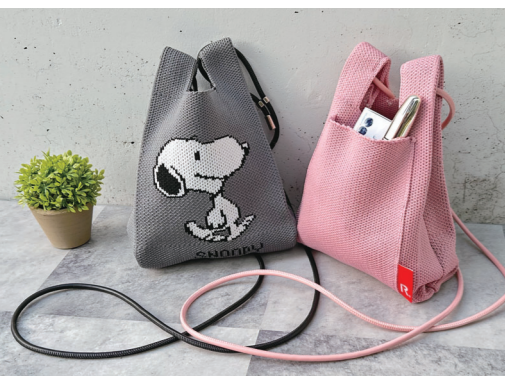
背面にはルーポケット付き