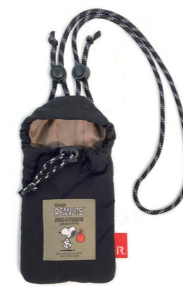
834201 Black JAN : 4980862 834219