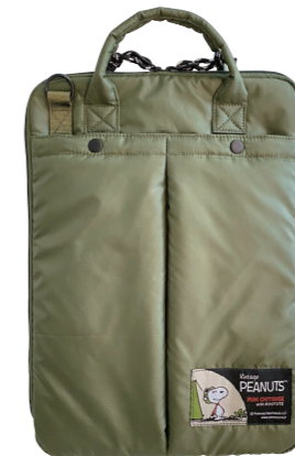
833802 KHAKI JAN: 4980862 833823