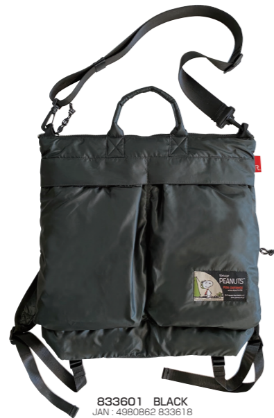
833601 BLACK JAN: 4980862 833618