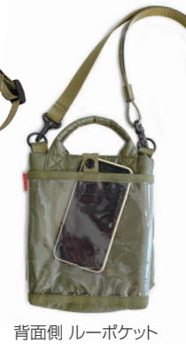
背面側 ルーポケット

Vintage PEANUTS™ © 2023 Peanuts Worldwide LLC www.snoopy.co.jp