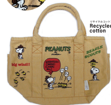
833502 Baegle Scouts JAN: 4980862 833526