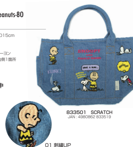
833501 SCRATCH JAN: 4980862 833519

キャッチーな刺繍と製品洗いの風合いが楽しいシリーズ。O2の本体素材にはリサイクルコットンを使用しています。