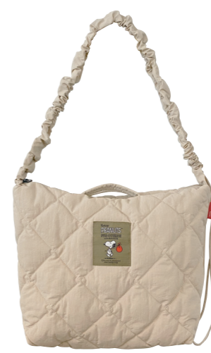
834102 Beige JAN : 4980862 834127