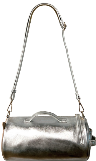
119903 SILVER JAN 4980862 119934