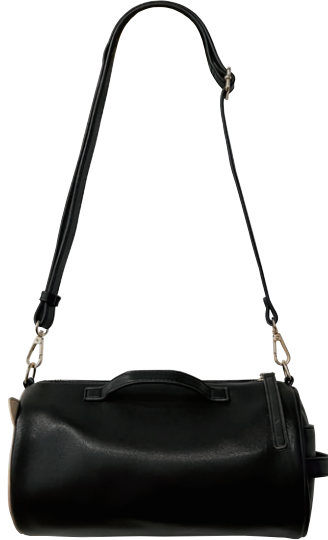
119902 BLACK JAN 4980862 119927