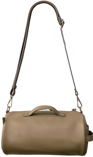
119901 BEIGE JAN 4980862 119910