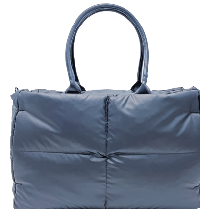
124401 SMOKE NAVY JAN : 4980862 124419