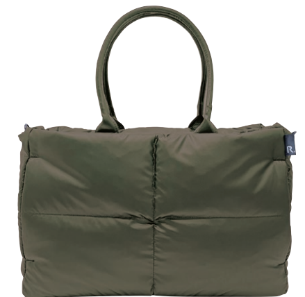
124404 Forest GREEN JAN : 4980862 124440

ショルダー付きのボックスタイプのグランデ。 たっぷりの容量で1泊旅行に最適なサイズです。