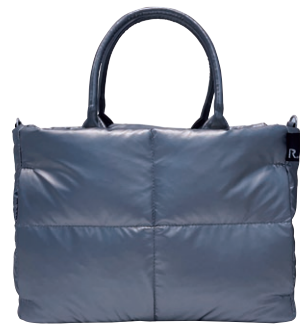
124301 SMOKE NAVY JAN : 4980862 124310