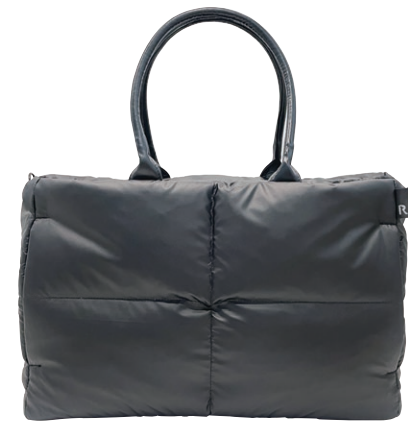
124403 BLACK JAN : 4980862 124433