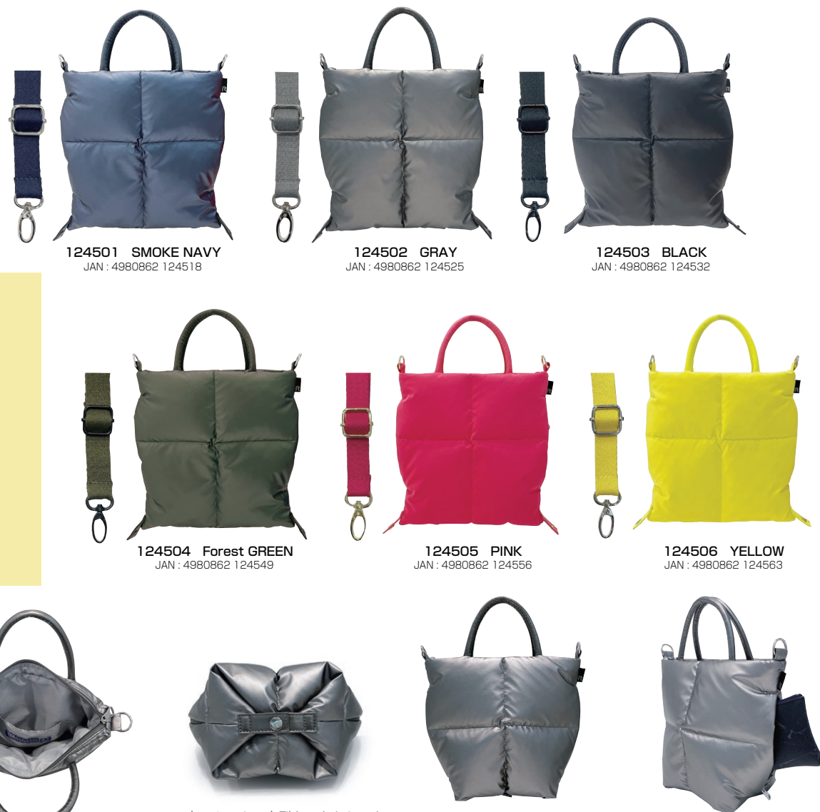
124501 SMOKE NAVY JAN: 4980862 124518