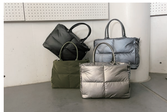
124304 Forest GREEN JAN : 4980862 124341