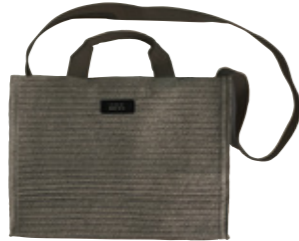
113402 SUMI JAN : 4980862 113420