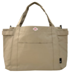
315704 Beige JAN : 4980862 315749