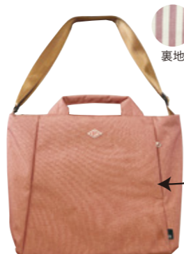
112205 DUSTY PINK JAN : 4980862 112256