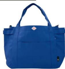
315702 Blue JAN : 4980862 315725