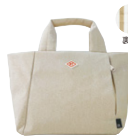
112003 ECRU JAN : 4980862 112034