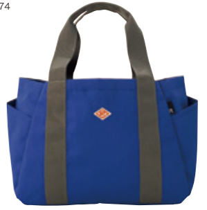
146306 NAVY JAN : 4980862 146367