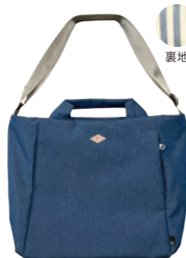
112204 BLUE JAN : 4980862 112249