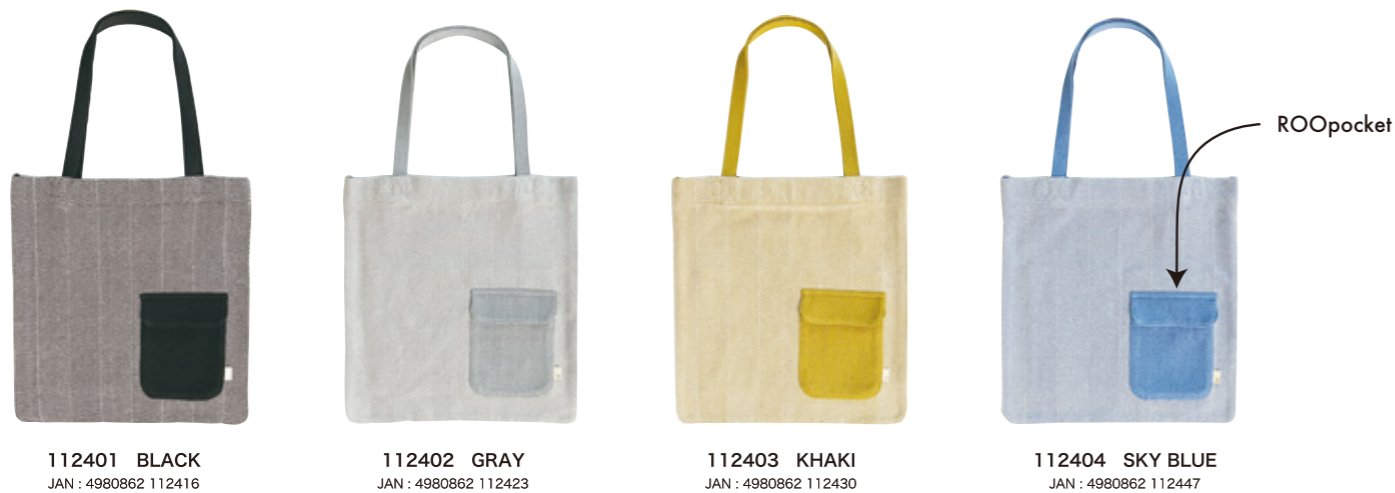
112401 BLACK JAN: 4980862 112416