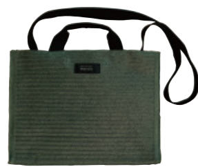
113404 GREEN JAN : 4980862 113444