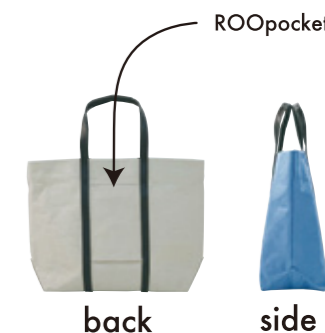
112503 DENIM BLUE JAN: 4980862 112539