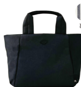
112001 BLACK JAN : 4980862 112010