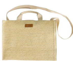
113401 NATURAL JAN : 4980862 113413

サイズ: W33×H25×D12.5cm 持ち手:27cm ショルダー:100cm 素材: 表地 分類外繊維 (P-P) 裏地 ポリエステル ドットボタン 持ち手 ポリエステル ポケット: 外側1箇所 内側ファスナー付1箇所 生産国: 中国