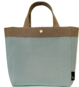
114403 SAGE JAN : 4980862 114434