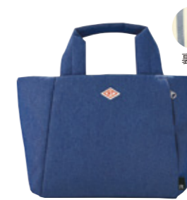
112004 BLUE JAN : 4980862 112041