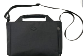
112101 BLACK JAN : 4980862 112119