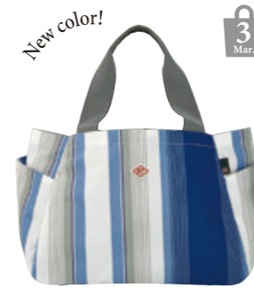
145904 blue line JAN : 4980862 145940

サイズ: W32×H23×D14cm 持ち手: 38cm 素材: 表地/ポリエステル (はっ水加工)、 ドットボタン、持ち手/ポリプロピレン ポケット: 外側2箇所、 内側3箇所 (うちファスナー付1箇所) ホルダー2箇所 生産国: 中国