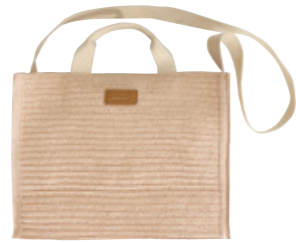
113405 PINK JAN : 4980862 113451