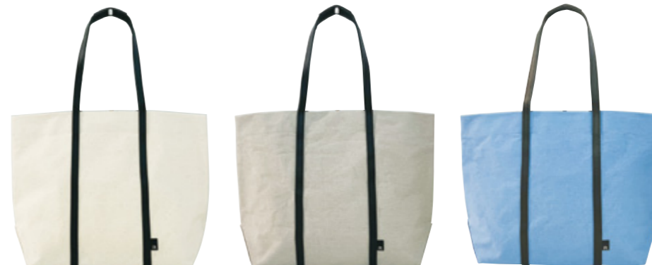
112601 NATURAL JAN: 4980862 112614