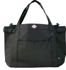
315707 Black JAN : 4980862 315770