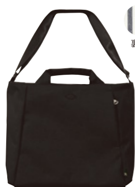
112201 BLACK JAN : 4980862 112218

お仕事や習い事に。ノート PC や書類なども入るミディアム。斜めがけもできるので、国内旅行や自転車でのお出かけにも。本体とショルダーの重さ約 350g。13inch ノート PC、雑誌、ボトル、折り畳み傘、財布、ポーチなどを収納