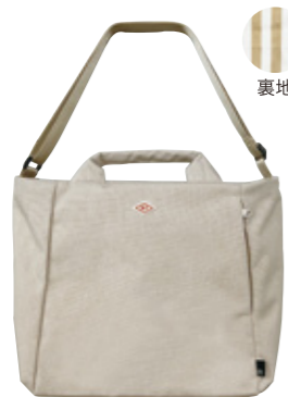
112203 ECRU JAN : 4980862 112232