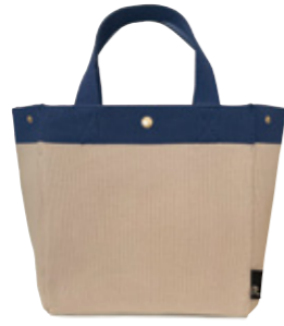
114402 BEIGE JAN : 4980862 114427