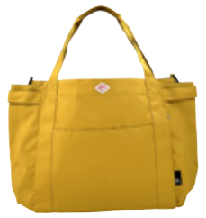
315708 MUSTARD JAN : 4980862 315787