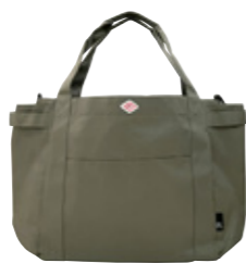
315705 Khaki JAN : 4980862 315756