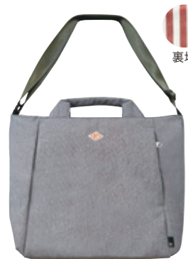
112202 GRAY JAN : 4980862 112225