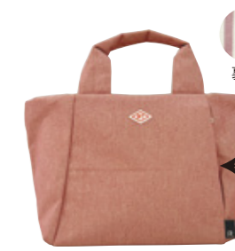
112005 DUSTY PINK JAN : 4980862 112058