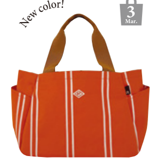
145905 orange line JAN : 4980862 145957