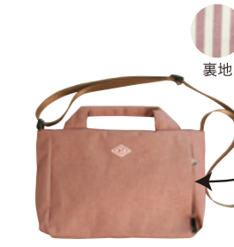
112105 DUSTY PINK JAN : 4980862 112157