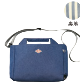
112104 BLUE JAN : 4980862 112140