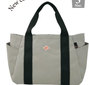
146307 GRAY JAN : 4980862 146374