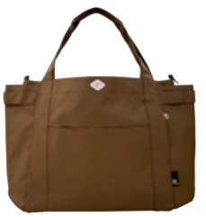
315706 Brown JAN : 4980862 315763