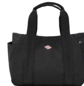
146301 BLACK JAN : 4980862 146312

サイズ: W32×H23×D14cm 持ち手: 38cm 素材: 表地/ポリエステル (はっ水加工)、 ドットボタン、持ち手/ポリプロピレン ポケット: 外側2箇所、 内側3箇所 (うちファスナー付1箇所) ホルダー2箇所 生産国: 中国