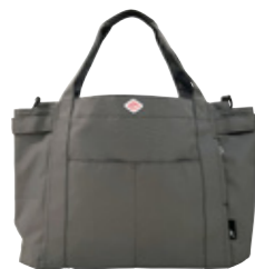
315701 Gray JAN : 4980862 315718