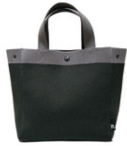
114401 BLACK JAN : 4980862 114410