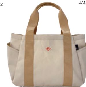
146305 IVORY JAN : 4980862 146350