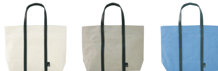
112501 NATURAL JAN: 4980862 112515