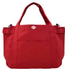
315703 Red JAN : 4980862 315732