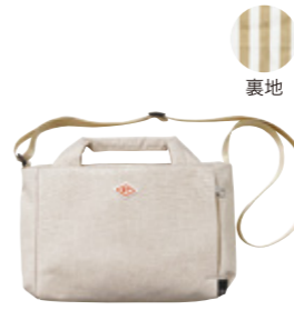
112103 ECRU JAN : 4980862 112133