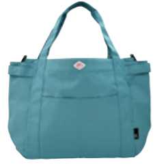
315709 TURQUOISE JAN : 4980862 315794