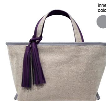
114701 PURPLE JAN: 4980862 114717

サイズ: W45×H22×D17cm 持ち手: 30cm 素材: 表地/綿, 麻 裏地/ポリエステル 持ち手/綿, 麻, 合成皮革 マグネットホック ポケット: 外側:ファスナー付1箇所, 内側:3箇所(うちファスナー付1箇所) 生産国: 中国