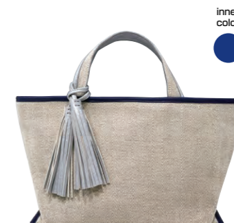
114702 NAVY JAN: 4980862 114724