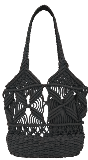
114902 BLACK JAN: 4980862 114922