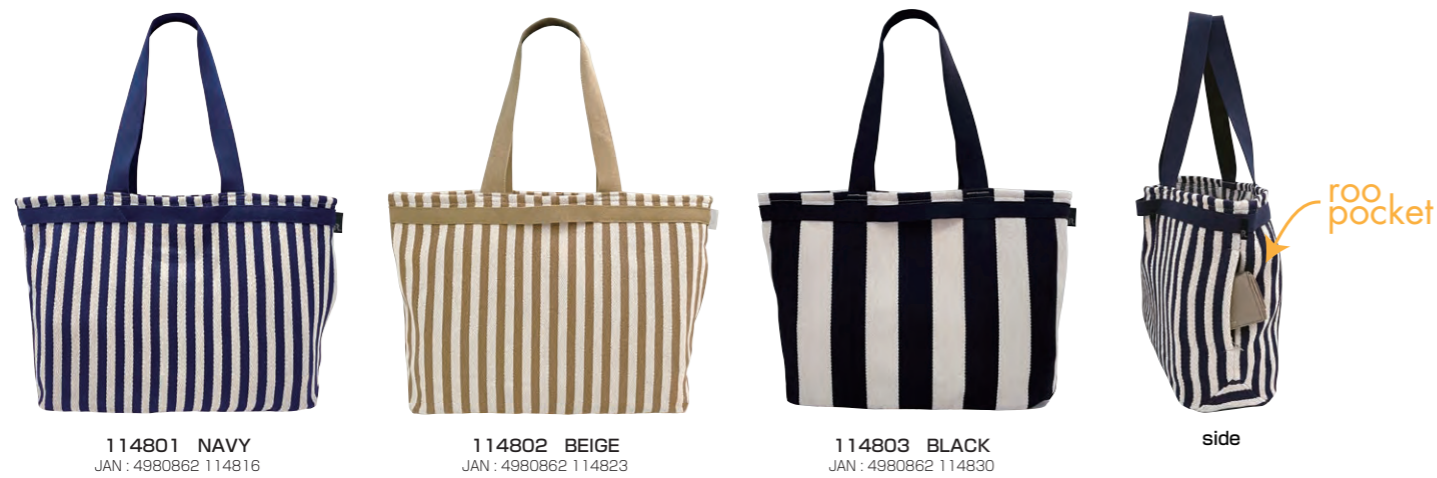
114801 NAVY JAN: 4980862 114816

1148 LT. GRANDE ストライプ-A サイズ: W56×H34×D15cm 持ち手: 61cm 税抜 ¥4,600 素材: 表地/綿(裏メッシュ加工) 持ち手/ポリエステル ドットボタン ポケット: 外側:フアスナー付1箇所、内側:2箇所 生産国: 中国