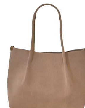
115302 BEIGE JAN: 4980862 115325