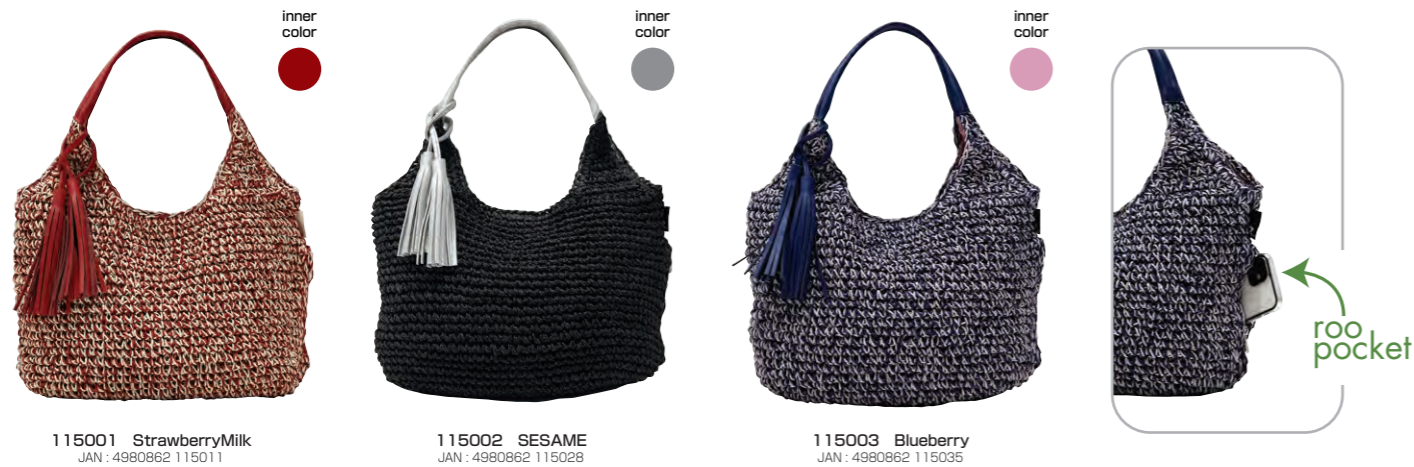
115001 StrawberryMilk JAN: 4980862 115011

サイズ: W45×H38×D14cm 持ち手: 51cm 素材: 表地/分類外繊維(バ-) 裏地/ポリエステル 持ち手/合成皮革 ベルポーレン マグネットホック ポケット: 外側:ファスナー付1箇所、内側:2箇所 生産国: 中国