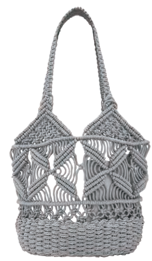
114901 GRAY JAN: 4980862 114915

サイズ:W35xH31xD13cm 持ち手:52cm 素材:表地/ポリエステル 分類外繊維(A'-P) 持ち手/ポリエステル ポケット:1箇所(可動式ポケット) 生産国:中国