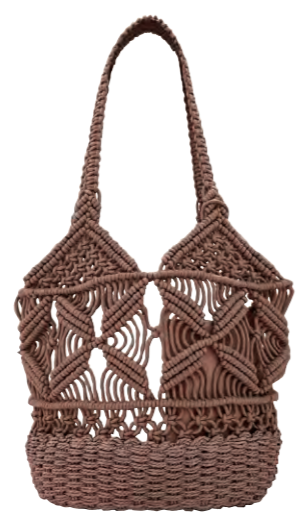
114903 APRICOT BROWN JAN: 4980862 114939