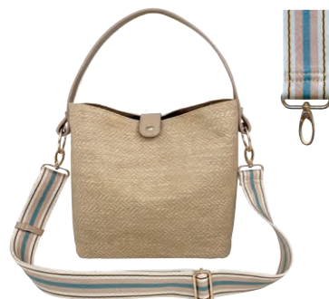
114301 BEIGE JAN: 4980862 114311