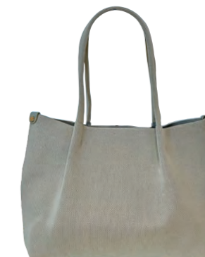
115303 GRAY JAN: 4980862 115332