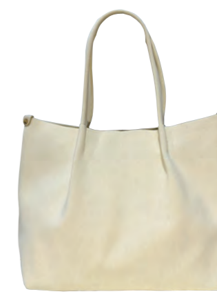
114504 IVORY JAN: 4980862 114540