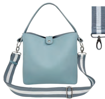
114302 BLUE GRAY JAN: 4980862 114328