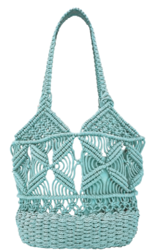
114904 MINT JAN: 4980862 114946