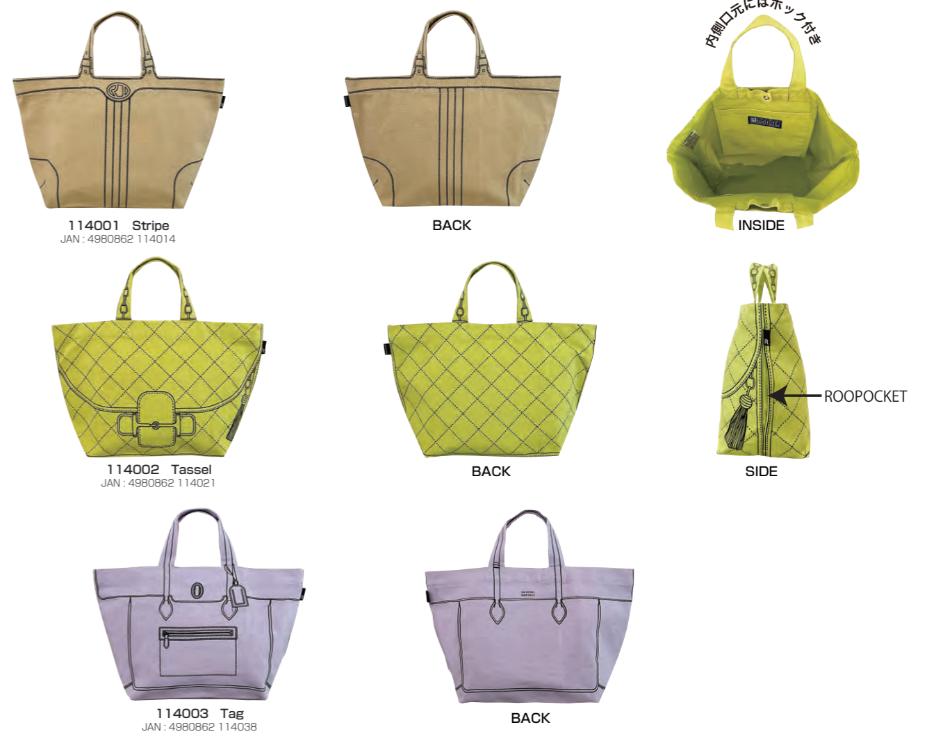
114001 Stripe JAN: 4980862 114014

1140 LT. DELI トート #1-A サイズ: W43×H27×D15.5cm 持ち手: 28cm 税抜 ¥2,600 素材: 表地/綿 持ち手/綿 ドットボタン ポケット: 外側:1箇所、内側:1箇所 生産国: インド