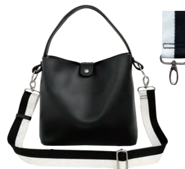
114303 BLACK JAN: 4980862 114335