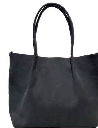
114501 BLACK JAN: 4980862 114519