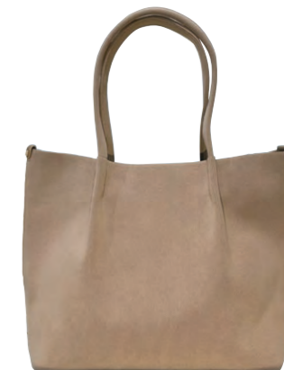
114502 BEIGE JAN: 4980862 114526