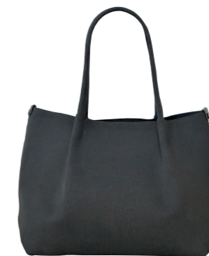
115301 BLACK JAN: 4980862 115318