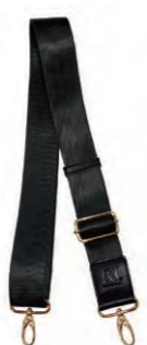
035904 BLK/GLD JAN: 4980862 035944