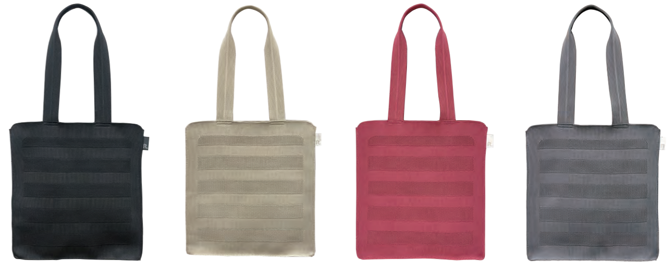
115201 BLACK JAN: 4980862 115219

サイズ: W35×H36×D5cm 持ち手: 63cm 素材: 表地/ポリエステル ポリウレタン 持ち手/ポリエステル ポリウレタン ポケット: 外側:1箇所 生産国: 中国