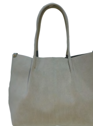
114503 GRAY JAN: 4980862 114533