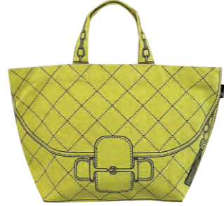
114002 Tassel JAN: 4980862 114021