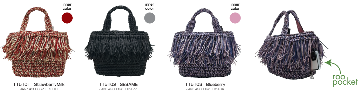
115101 StrawberryMilk JAN: 4980862 115110

サイズ: W34×H22×D16cm 持ち手: 30cm 素材: 表地/分類外繊維(バ-) 裏地/ポリエステル 持ち手/分類外繊維(バ-) ポリエステル ベルポーレン マグネットホック ポケット: 外側:ファスナー付1箇所、内側:1箇所 生産国: 中国