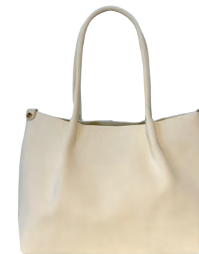
115304 IVORY JAN: 4980862 115349