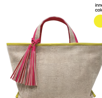
114703 VIVID JAN: 4980862 114731

春夏らしいナチュラルな麻混のヘリンボーン素材に 2色のカラーのパイピングがポイント。 存在感のある幅広の舟形サイズのデザインに仕上げました。 取り外し可能の大きめがタッセル付きです。